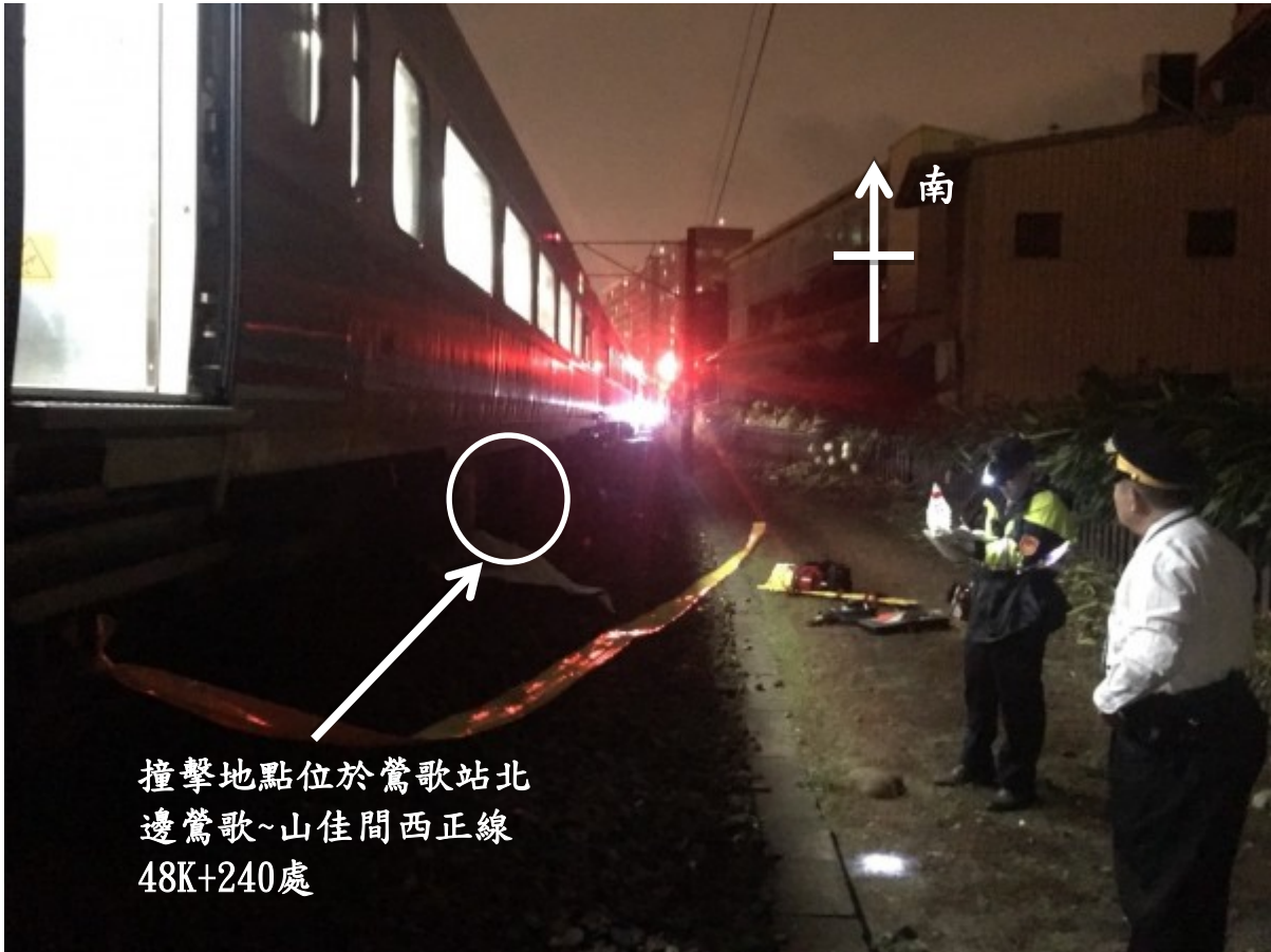
照片二、車底部散佈之屍塊