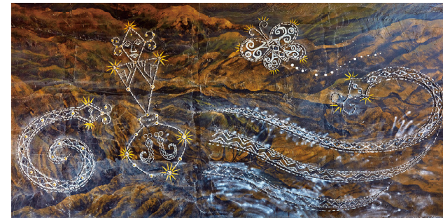
百步蛇和星芒是排灣族的代表性圖騰。

走出幽暗的隧道，光線突然灑落，一望無際的金崙沙灘映入眼簾，朵朵浪花拍打上岸，與隧道另一端純樸村落的日常，交織建構出獨特的迷人景象，既鮮明又深刻，讓旅人都永生難忘。