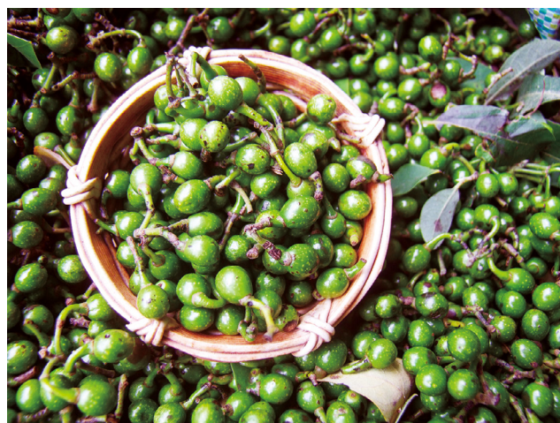
馬告是台灣特有香料，帶著胡椒與薑的清新香氣。

這份便當盡是花東地區嚴選的農、漁特產，山海珍味，菜色豐富多元，份量十足，完整均衡營養，讓您吃飽吃好。售價只要100元。