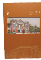
筆記本-橘 280 元