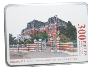
拼圖300片 600 元

台灣鐵道飯店為當時台灣第一座，也是唯一的一座西式飯店。建築外觀為紅磚砌成加入白色洗石子，屋頂為厚重馬薩頂。座落在今新光三越站前百貨及其周邊腹地商圍位址。