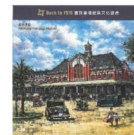
萬用布 180 元