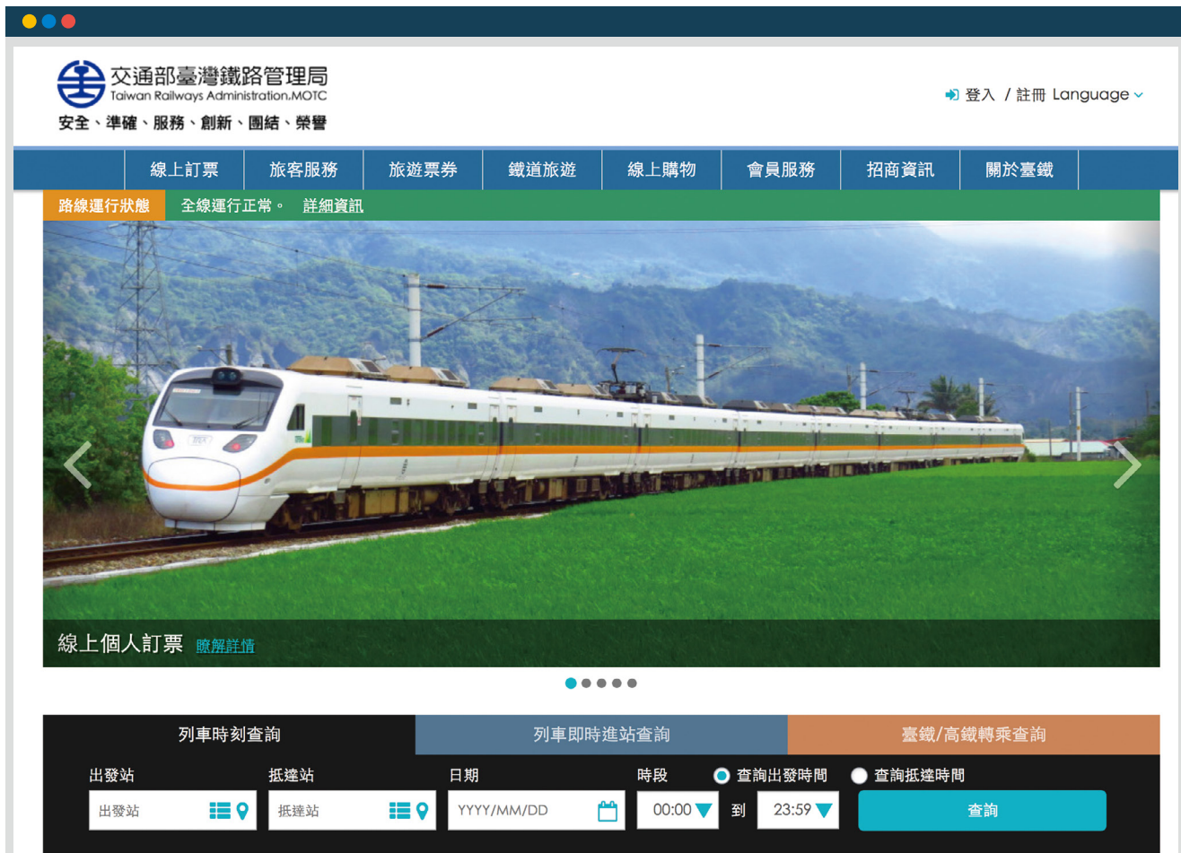
第四代票務系統新增兩鐵列車轉乘時刻查詢功能。