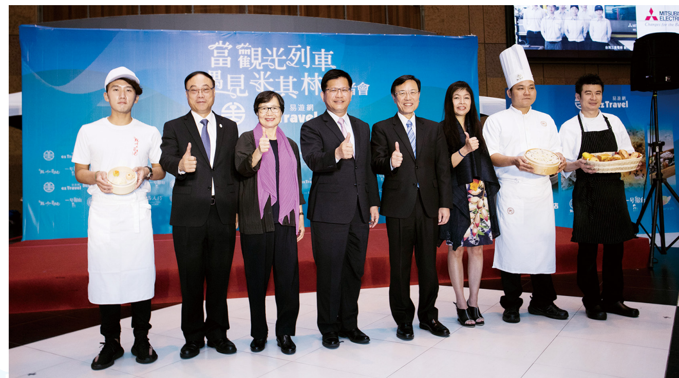
交通部林佳龍部長(中)、觀光局周永暉局長(左二)、台灣觀光協會葉菊蘭會長(左三)與台鐵局張政源局長(右四)，共同參與「當觀光列車遇見米其林」記者會。

夏天的序曲正要展開，現在就收拾行囊搭上觀光列車吧！隨著環遊寶島的沿途風光，開啟一趟食尚的美好旅程。