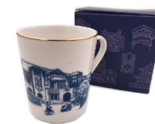
馬克杯 420 元