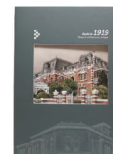
筆記本-綠 280 元