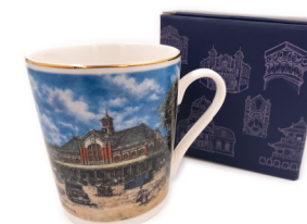
馬克杯 420 元

站體為紅磚構造，文藝復興式西洋建築，呈辰野金吾風格，即採紅磚白橫飾帶外牆，正面為雙衛塔、大山牆，屋頂為木構銅版瓦，正中央聳立凸起呈四方柱體塔樓，富莊嚴細緻之感，極為典雅醒目。