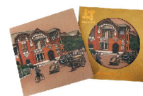
杯墊 180 元

台灣總督府鐵道部由總督府技師森山松之助設計。建築外貌有部分都鐸式建築特徵，外觀處理極為精緻細膩，地面層磚牆為英式砌法。二層為木材構造，部分構架露明，有半木構造的特質。正面圓弧形門廊，兩側各有三根短柱，其後為主山牆，有八角凸窗，為其建築外貌主要特色。