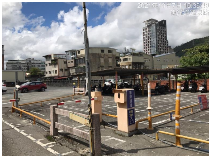
照片二(機車停車場入口及出口處)