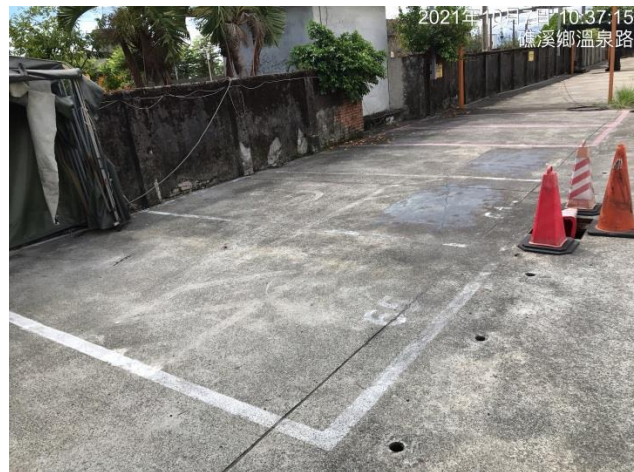
照片四(身障及婦幼停車位)