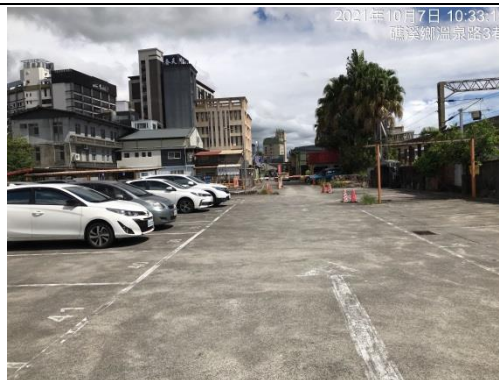
照片六(停車場現況)