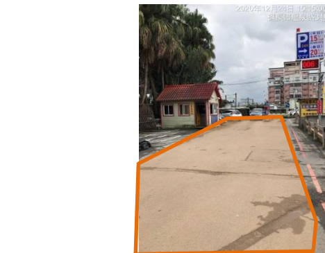
照片五(停車場出入通道由承租人負責維護)