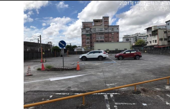
照片七(停車場現況)