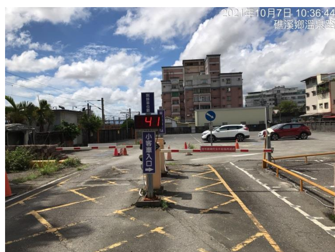
照片一(入口處及出口處)