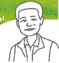
二水鄉鄉長 蘇界欽