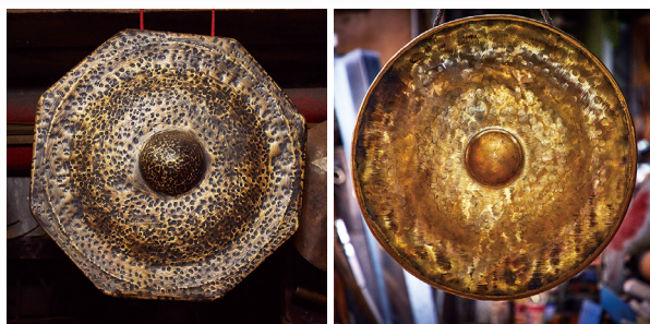
八角鑼 (左) 與花紋鑼面 (右)。

第二代傳人林烈旗回憶，小時候常常在工廠玩耍，爸爸便會吆喝過來幫忙，做著做著，就當起了爸爸的學徒。他說，製鑼最關鍵的工法落