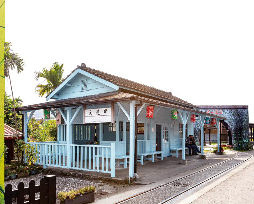
淡藍色木造建築是天送埤火車站的特色。