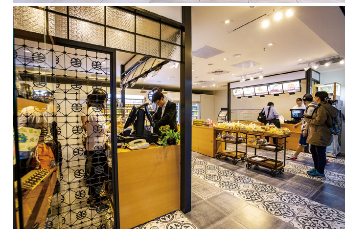
新裝潢的台鐵便當本舖2號店洋溢懷舊工業風。