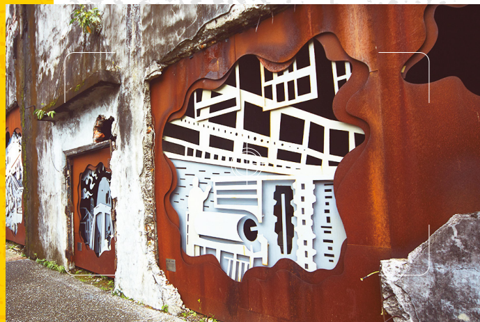
在中里站附近的中興文化創意園區，捕捉舊工廠與新文創融合的美景。

和煦春日，帶著相機搭乘宜蘭線列車，投身壯麗山水之間，93.6 公里的綿延鐵道將東北角獨有的自然與人文資產一一串連，旅人們藉著鏡頭，捕捉、記憶旅途中每時每刻的美好與感動。