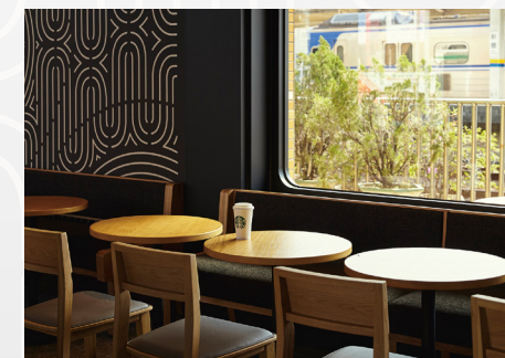
坐在店內可以看到月台及火車。