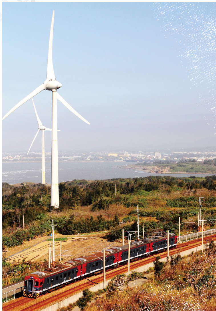
日本信濃鐵道列車馳騁海線。

過去雖然也有過京急電鐵的藍色普通車與東武鐵道的普悠瑪塗裝，不過這次信濃鐵道選定的列車，原本的外觀與自強號截然不同，如此大幅度重新改變外觀塗裝可說是絕無僅有，備受鐵道迷矚目，更有台灣鐵道迷特地追星，就為了一睹自強號行駛於長野縣雪國的風采。