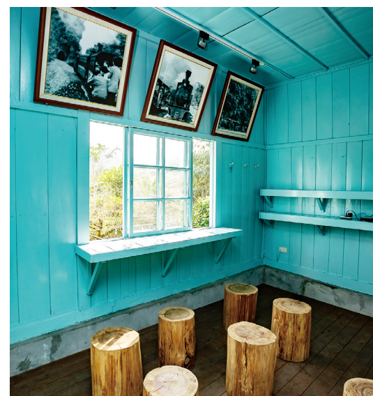
天送埤車站內可見各式舊時文物與照片。