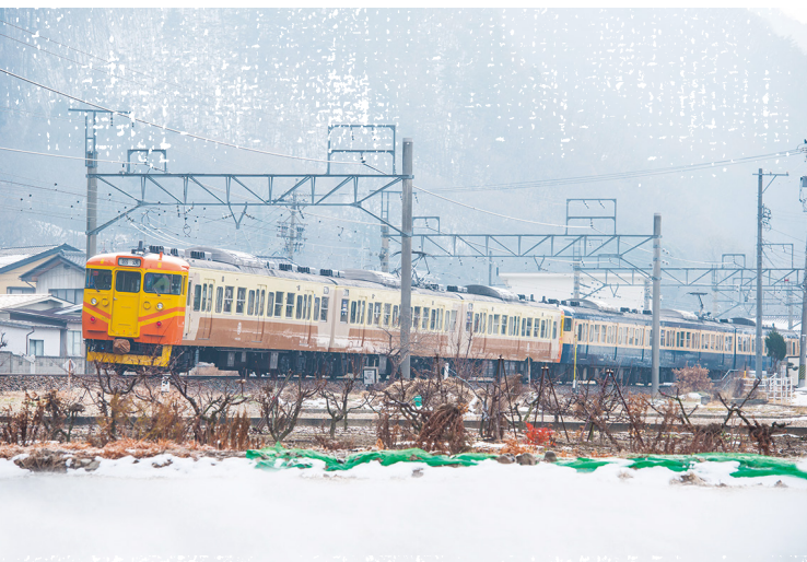
奔馳於日本雪地的自強號列車。

其實，早在去年 11 月 15 日，信濃鐵道就將旗下 115 系列車彩繪成台鐵的 EMU100 型自強號列車外觀，行駛於輕井澤站至妙高高原站之間。這條有著百餘年歷史的鐵道所在地——長野縣，因輕井澤的盛名，是國人旅遊日本的熱門景點，台灣旅客在異地看見自強號奔馳於雪地群山之間，無不格外興奮。