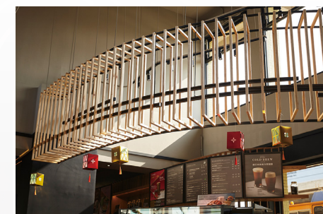
吧檯及櫃檯上方的天花造型皆以弧型的排列吊掛放置，讓人聯想火車的運行及來往時空的速度感。

這並非台鐵首次的資產活化案例，先前南港調車場都更案、松山車站設定地上權案、台北車站商場 ROT 案等，已經率先寫下亮眼的成績。台鐵擁有諸多老站房、宿舍等饒富歷史況味的傳統建物，搭上現今火熱的懷舊風、軌道沿線的人潮優勢，以及 3 月才剛剛成立的「資產開發中心」，勢必掀起新一波的軌道經濟。目前，南港玉成段都更案招商、新高雄車站旅館大樓將陸續完工，鄰近新豐的竹北舊站也正熱烈招商，老鐵道建築的新故事，鑼鼓喧天，好戲才正要上場。