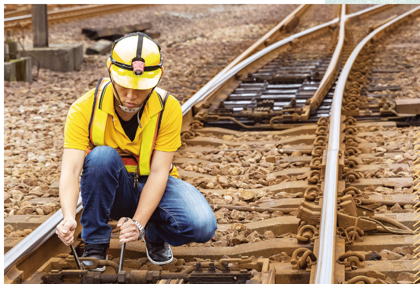
號誌設備與軌道路線焦不離孟，號誌人員的工作環境經常就在軌道旁。