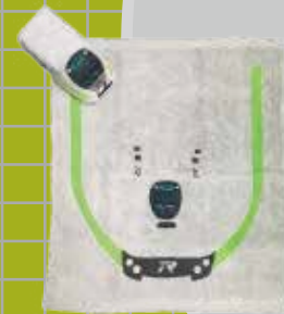
EMU900 造型毛巾 130元