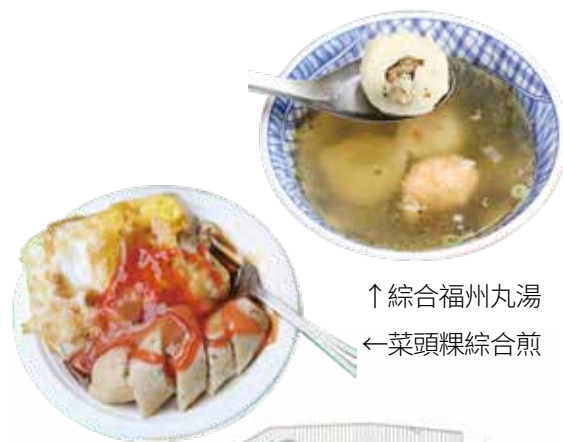
↑ 綜合福州丸湯 ← 菜頭粿綜合煎

若您是個吃貨，千萬不到錯過綠空沿線附近的「第二市場」，這個深植於臺中人記憶裡百年歷史的美食所在地，可說是到臺中旅遊必來的熱點之一。「第二市場」位於臺中市臺灣大道一段與中區三民路的交接口，主要以一座六角樓為核心，建築為放射狀型態，於1917年日治時期開設時，因此地為臺中市新富町三丁目，當時稱之為新富町市場，原是一個賣舶來品、高檔貨的市場也是日本有錢人消費的地方，又有「日本人的市場」之稱，隨著時代的變遷，當年的貴族市場現在變成平民美食的地方，後來經臺中市政府整修，才成為現在大家看到的新型態。市場內集結許多有名的古早味小吃，像是菜頭粿、爌肉飯、麻茅湯、香菇肉羹、紅茶、福州魚丸、意麵等等，每一家都是數十年的老店，不僅是許多在地人喜愛的古早味、兒時記憶，更吸引不少觀光客與饕客特地前往。