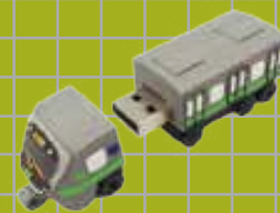
EMU900 質感隨身碟 32G / 64G 390 / 490元