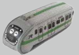
EMU900 造型筆袋 249元