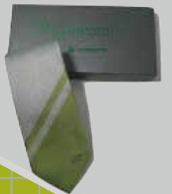
EMU900 質感領帶 250元