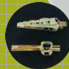
EMU900 質感領帶夾 250元