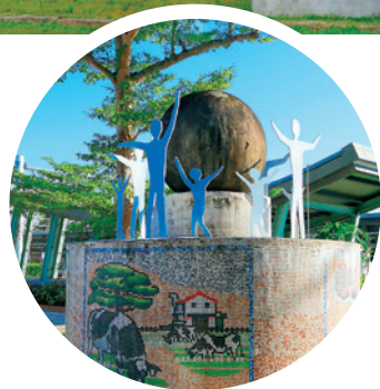
瑞穗車站旁的地球儀紀念碑