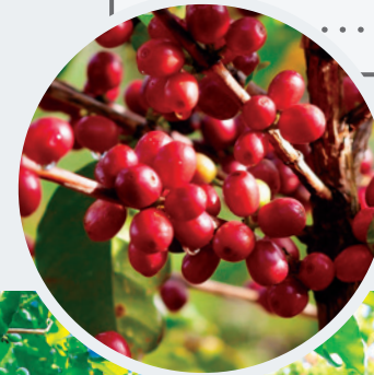
風味獨特的 舞鶴咖啡

一百多年前，日本人在開發東部時於紅葉溪的上游發現溫泉，命名為「紅葉溫泉」，在此興建公共浴場及溫泉旅社；而後在瑞穗鄉境內也發現泉源，遂有內、外溫泉之分，外溫泉便發展為如今的「瑞穗溫泉」。瑞穗溫泉的泉質屬氯化物碳酸鹽泉，水色偏黃混濁，且略帶鐵鏽味，偶有暗紅色的鐵質沉澱物，可洗浴不可飲用，常令遊客誤以為水質不淨。據傳此泉質對皮膚有益，許多遊客慕名而來。又因與不遠處玉里鎮「安通溫泉」的透明硫酸鹽泉「美人湯」遙相呼應，將瑞穗溫泉稱呼為「英雄湯」。