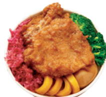
台鐵便當 騰雲座艙限定台鐵便當 (須於乘車前一日17:00前預訂)