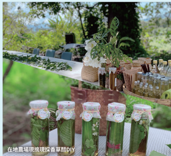
在地農場現摘現採香草醋DIY