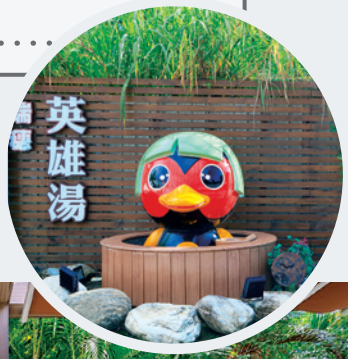
瑞穗溫泉又稱 「英雄湯」