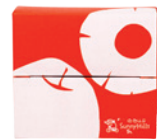
微熱山丘 鳳梨酥+蘋果酥 (一盒2個)