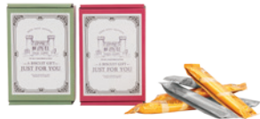
台灣優格餅乾學院 千層棒餅乾盒 (鹹蛋黃+肉鬆各3)