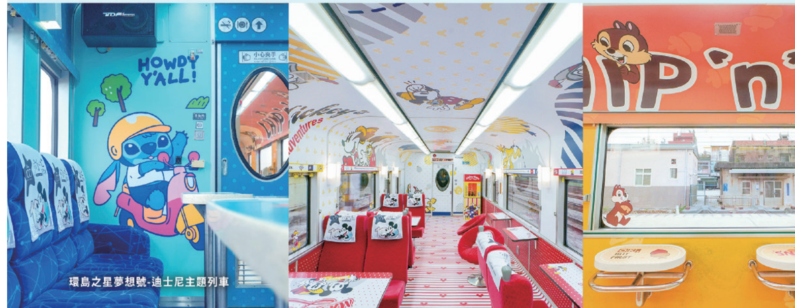
環島之星夢想號-迪士尼主題列車