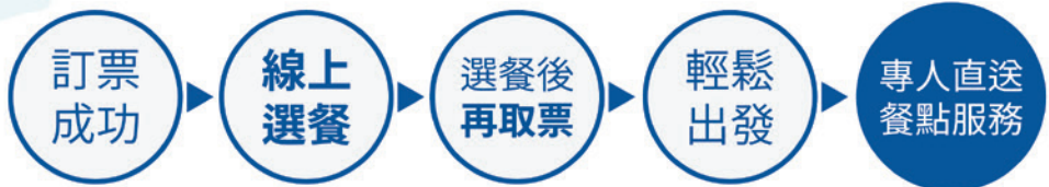
騰雲座艙限定台鐵便當介紹