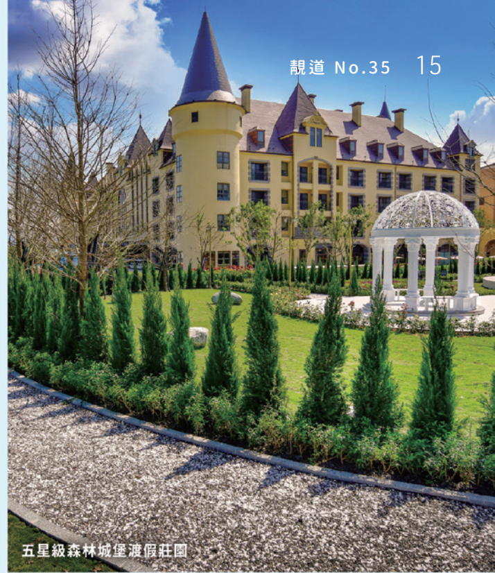
五星級森林城堡渡假莊園

北回歸線標誌公園 ● 花蓮縣瑞穗鄉舞鶴村台9線260公里處 ◎ 全年開放 ▶ 距離臺鐵瑞穗車站約5.6公里。 ▶ 公車可搭乘1137、1142至「北回歸線公園(瑞穗)」站下車。