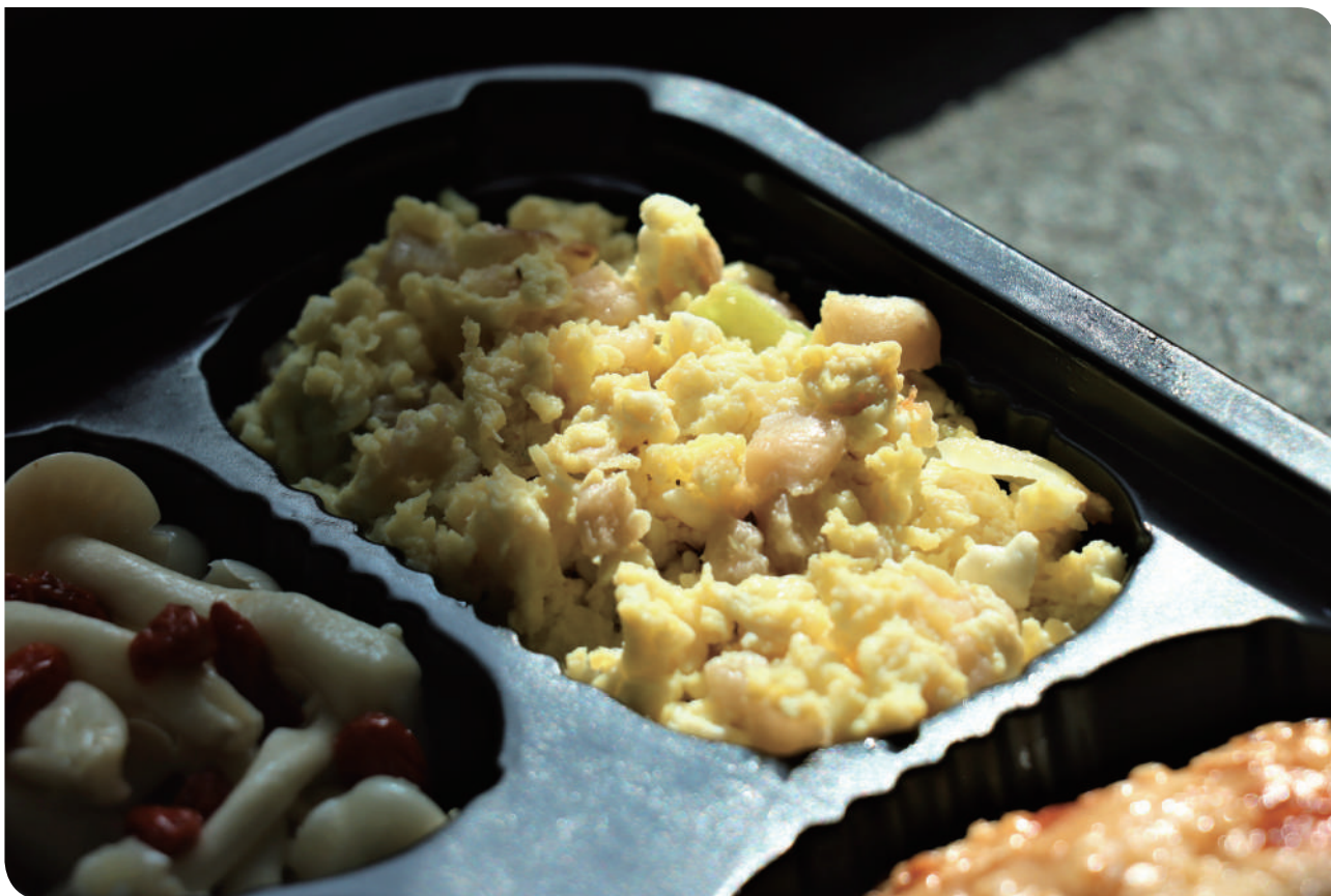
▲蓬鬆的菜脯蛋，由菜脯的鹹香與蛋香交織出令人懷念的工廠餐桌滋味

「菸廠尋味聯名便當」讓我們在造訪原創基地節與菸廠古蹟之際，一同以味蕾作為時光載具，邊品嚐台鐵便當的暖心滋味，邊追尋縱貫線與臺北城市發展相互交織的歷史軌跡，體驗「沿之有物」從空間、記憶到餐桌的多重層次。