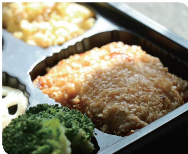
▲味噌醃漬的去骨雞腿排灑上白芝麻炙烤，散發出豆香以及堅果的芬芳

菜色；主食特別搭配帶有淡淡甜香的地瓜飯，並配以柚香蓮藕、菜脯蛋、美白菇及花椰菜等配菜，編織出色彩豐富又營養均衡的豐盛菜色。打開便當彷彿坐上時光列車，在醬香之間，感受老工廠舊時光的餐桌美味。