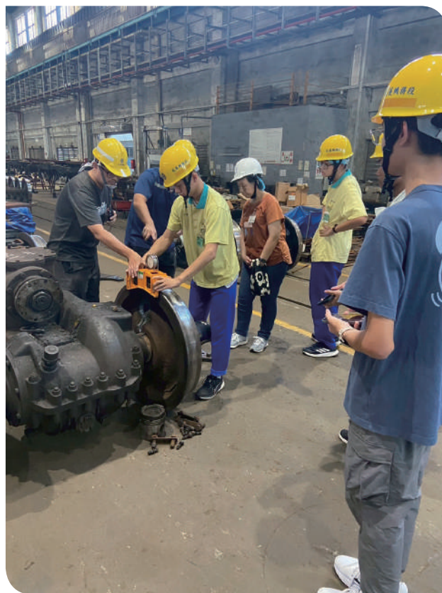
▲花蓮機廠講師指導學員體驗車輪車床的操作