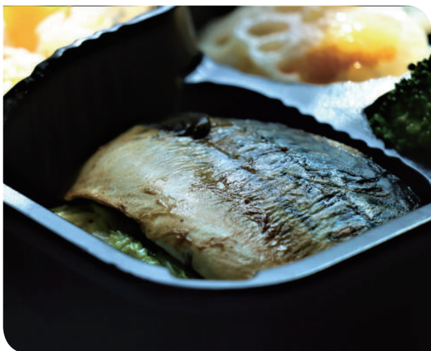
▲油光飽滿的佃煮鯖魚，浸潤醬汁的鹹甘滋味，讓人食指大動