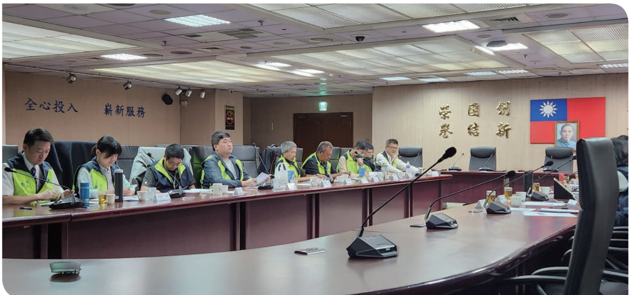
▲勞方代表發表意見，展現積極參與