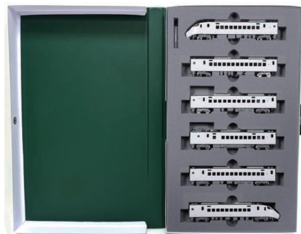
▲EMU3000 型 N 規模型藍線款「6 輛基本組」