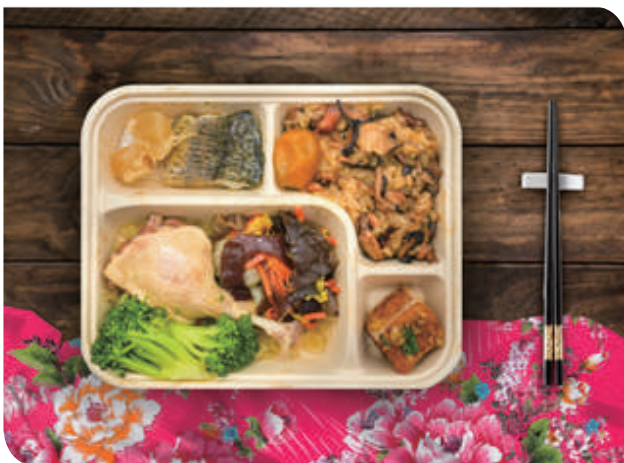
▲「宴『客』便當」以客家餐廳宴客菜為發想

臺鐵公司與臺北市客委會攜手合作推出聯名「食在好客~宴『客』便當」，是一場客家美食的文化饗宴，在旅途中就能「饗用」到客家美食料理的獨特魅力，透過味蕾認識客家精神及飲食文化的傳承與創新。