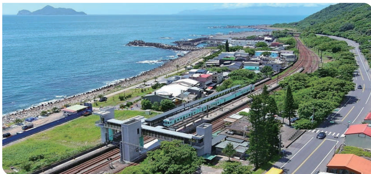
▲本公司「海風號觀光列車」停靠大里車站情形

有助於提升旅客乘車便利性及營運安全，創造優質友善舒適的乘候車環境，並配合宜蘭縣政府「蘭海鐵道五漁村計畫」及「蘭海自行車道串聯計畫」，本公司也將「海風號觀光列車」行駛到宜蘭線來，停靠大里車站，透過串聯地方特色車站整合附近觀光景點，形成完善的交通網絡，為臺鐵及地方創造雙贏。