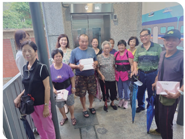
▲社區民眾爭先體驗新建電梯完工後帶來的便利