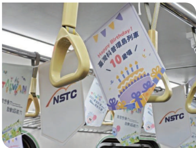
▲科普列車車內裝置

力。鄭董事長表示，火車本身是科學與工程的結晶，如今更被轉化為教育推廣媒介，臺鐵將持續提供後盾，讓科普列車載著夢想與希望前進。