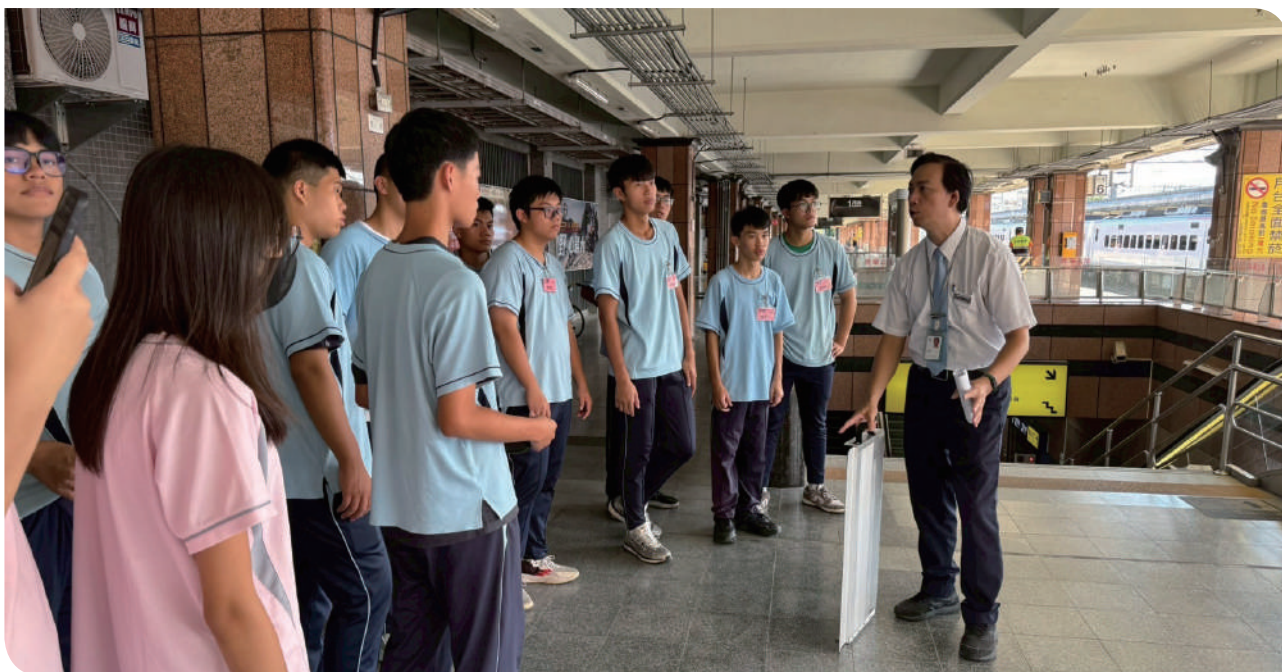
▲學員於花蓮站內聆聽講師解說旅運工作的內容

領域。活動最後安排「臺鐵職涯起航」專題，介紹本公司透明的招考制度、優渥的福利待遇以及友善的職場環境，協助青年學子掌握未來職涯方向。