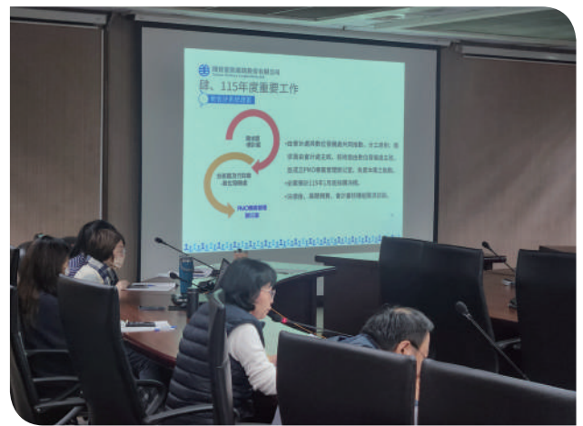
▲經營管理單位向勞資代表進行業務報告

勞資會議的安排不僅是符合法規，更是臺鐵企業文化的一部分。藉由常態化且公開透明的溝通機制，讓員工的聲音得以被聽見，資方政策也能更被理解，在理性與尊重的基礎上，共同推動職場環境與工作品質提升。臺鐵公司期盼全體同仁持續關心並積極參與勞資會議，讓「溝通成為文化，合作成為力量」。唯有攜手並進，才能打造更安全、更信任、更具幸福感的工作環境，讓臺鐵朝向永續發展的目標穩健前行。