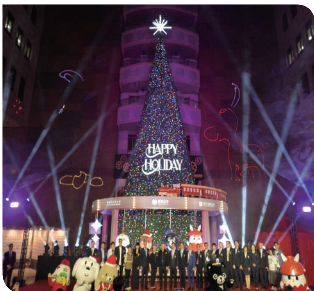
▲台北站聖誕樹點燈啟動儀式

隨著聖誕節即將到來，主辦單位別具巧思，於大廳中佈置高達 22 公尺的聖誕樹，總燈數達 6 萬顆，比去年更多、更璀璨，設計靈感取自紐約洛克斐勒中心的經典聖誕樹，以層層堆疊的燈光與精緻裝飾，營造出冬日最耀眼的景象。最頂端閃耀的巨型星芒象徵希望與祝福，彷彿引領每個心願向光前行。聖誕樹自 114 年 11 月 6 日起至 115 年 1 月 2 日止，於臺北車站一樓大廳展出。本公司誠摯邀請民眾一同前來欣賞並認領「心願寶盒」，讓愛與願望在光影之間延伸，共同為孩子點亮希望，感受聖誕節最純粹的溫度。