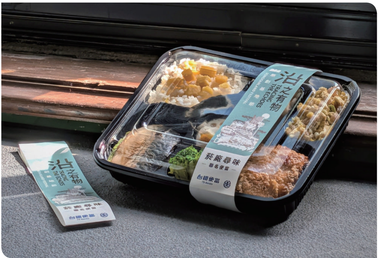
▲菸廠尋味聯名便當

原創基地節於 2025 年 10 月 31 日至 11 月 16 日於松山文創園區熱鬧登場，今年以「沿之有物 TRACING THE ECHOES」為年度主題，把舊產業鐵道當成核心主軸—「沿」象徵順著鐵道路徑回望歷史與城市發展脈絡，「物」則代表沿線工廠、倉庫與居民生活累積而成的產業遺產與人文故事。從一條不足 500 公尺、曾肩負