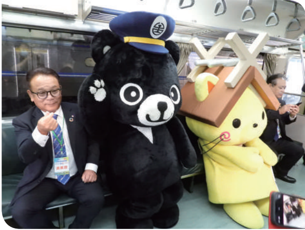
▲臺日吉祥物乘坐紀念彩繪列車之照片