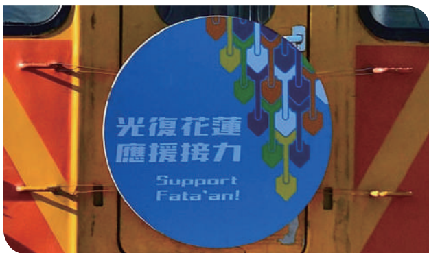
▲「光復花蓮·應援接力」車名版

2025年9月23日，花蓮馬太鞍溪上游因強降雨，導致堰塞湖溢流潰決，洪水沖入光復鄉市區，造成嚴重傷亡，在光復鄉最需要援手的時候，一塊特別設計的車名版出現在花蓮往返光復的柴聯自強號列車上。它以天藍色調為背景，象徵希望；鏟子的圖像巧妙融入設計中心，象徵這段期間每位在前線揮鏟的超人。車名版上寫著「光復花蓮 應援接力」，不只是目的地，更像是一封以列車寄出的信：我們來了，我們一直都在你身邊同行。