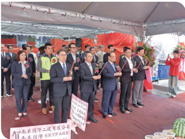
▲典禮中進行上香祈福儀式，祈求工程平安順利、後續施工圓滿完成，象徵建築主體結構階段告一段落，邁入新里程

本案以「綠意、串聯、共享」為核心設計特色，1 樓規劃綠化廣場，串聯玉東公園與新新公園，延伸城市綠帶，讓市民在日常生活中亦能親近自然、享受生態環境；2 至 4 樓規劃商業設施，並以空橋，跨越基地中間 12 公尺道路，以順利連結兩側商場，創造人潮流通與商業活絡效益；5 樓大型綠意平台，作為全區共享之開放休憩空間與戶外餐飲場域，促進交流，期許本案未來完工後，將為南港地區民眾提供商業、辦公、休憩與生活空間，帶動就業與經濟成長，形塑嶄新城市風貌，成為南港地區新地標。