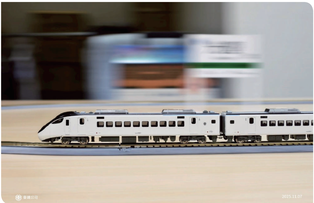
▲ EMU3000 型 (藍) N 規精密模型，每一處細節都完整呈現實車風貌

臺鐵公司與知名模型製造商日本株式會社關水金屬 KATO 公司再度攜手，推出全新 EMU3000 型 (藍) N 規精密模型，於 114 年 11 月 11 日於臺北夢工場舉辦首賣記者會，現場限量「臺灣限定版」包裝 EMU3000 型 (藍) N 規模型以及 EMU3000 型 (紅) 車頭模型！現場除模型搶購外，還有豐富的贈品與滿額抽扭蛋活動，讓民眾一次收藏、滿載而歸。