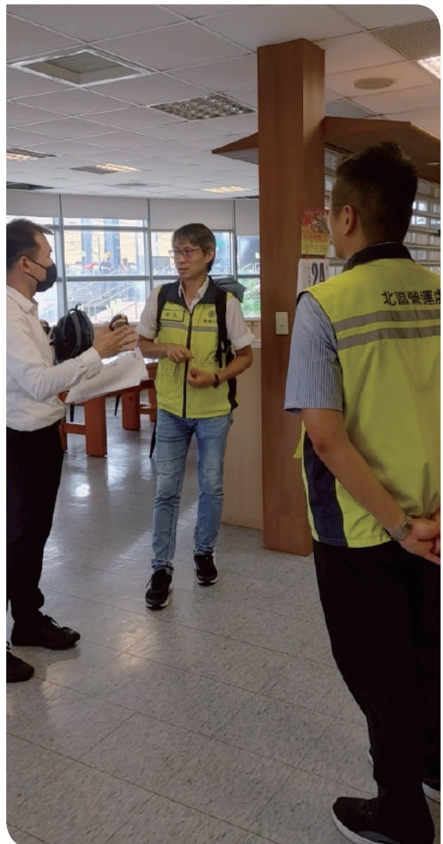
▲營運安全處於教師節前至新竹地區查核