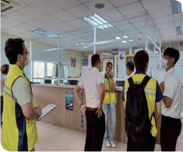
▲營運安全處於光復節前至潮州地區各單位查核