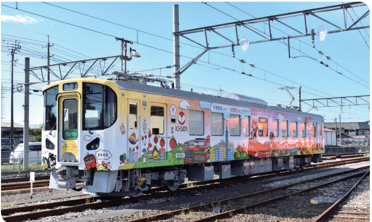
▲一畑電車彩繪之紀念列車

今年的跨國彩繪合作，不僅象徵臺日鐵道情誼持續深化，也展現同仁在跨部門協調及活動規劃上的努力成果。未來，本公司將持續與國際鐵道夥伴合作，透過多元活動與交流方式，讓鐵道成為串聯過內外文化、旅遊與情感的重要媒介，為旅客提供更多元且具溫度的乘車體驗。