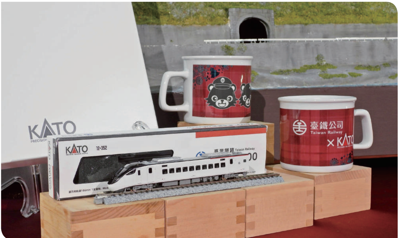
▲ EMU3000 型 (紅) 車頭模型 (旅途中的 N 規回憶) 及 KATO 公司特製充滿聖誕氛圍的馬克杯

打造出 EMU3000 型 N 規模型，從車身設計、塗裝細節到比例還原，皆以極高擬真度再現 EMU3000 型列車的獨特風貌，完整呈現臺鐵列車的現代美感與技術質感，親臨現場的民眾都為可收藏這段「藍」不住而感動。