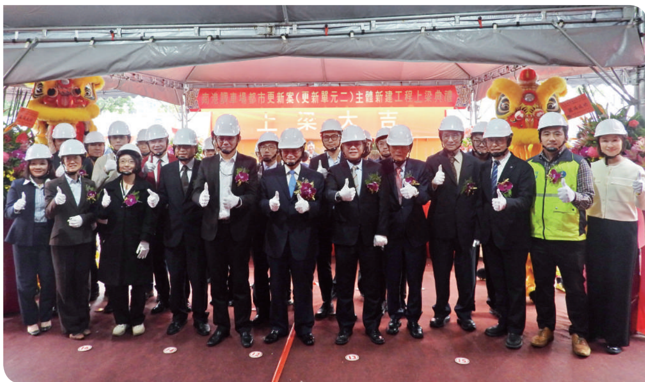
▲臺鐵公司、南港國際公司及各協力單位代表共同合影留念，齊心祈願工程順利、安全圓滿，展現公私協力、攜手推動南港城市更新的決心

臺鐵公司「臺北市南港調車場都市更新案」於 114 年 10 月 28 日在鄭光遠董事長、南港國際股份有限公司李虹明董事長及臺北市都市更新處的共同見證下，舉辦更新單元二「臺鐵棟大樓」上梁典禮圓滿完成，象徵工程進度邁入新里程，祈福後續工程進展順遂圓滿，全案預計 117 年底完工。