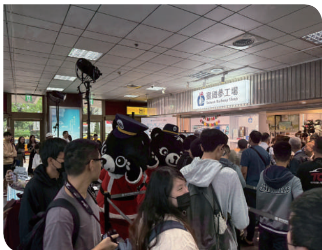
▲首賣記者會圓滿落幕，現場湧入大量民眾排隊等候

EMU3000 型盲包一卡通（共 4 款），限量 500 張（每人每次限購 4 張，隨機出貨），神秘