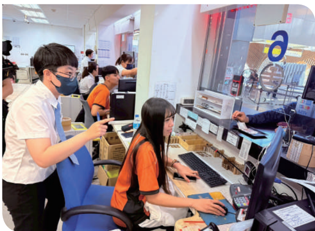
▲在花蓮站櫃檯，學員實際體驗票務設備的操作方式

本次體驗營選在教師節前夕辦理，不僅是向師生致敬的知性禮物，更展現臺鐵持續推動地方創生與培育新世代鐵道人才的決心。在體驗過程中，青年學子不僅只是覺得表面上的「新鮮好