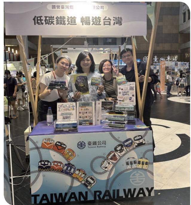
▲觀光亮點 行銷低碳旅遊

低碳成為旅遊的日常，而非負擔。這個秋天，不妨與最重要的那個人，安排一趟低碳、愉快、風景和心情都恰到好處的鐵道旅行。