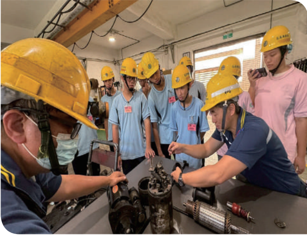
▲本公司花蓮機廠講師解說啟動馬達檢修的流程