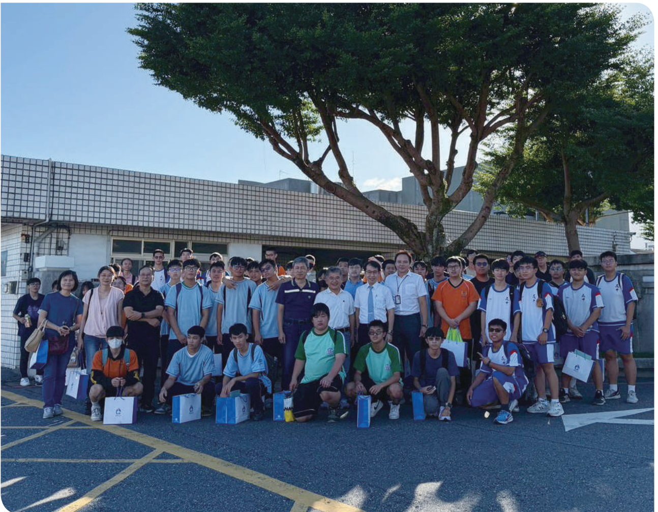
▲參加活動的師生於花蓮機廠門口合影留念

校際合作交流，預期每年參與規模可望突破百人，累計3年可培訓東部地區超過300名以上在地學子，持續養成鐵路人才，為臺鐵注入穩定新血，進一步落實「培育在地、留才在地」的願景。