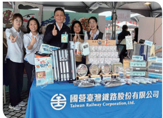
▲附業營運處臺北餐旅分處現場宣傳販售合作限定聯名「宴『客』便當」