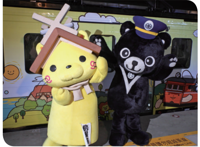
▲臺日吉祥物與彩繪紀念列車之合影

日止。列車外觀結合臺鐵吉祥物「漢娜將、鐵魯」與一畑電車的「一畑君、島根貓」，跨國同框呈現別具巧思的友好意象。