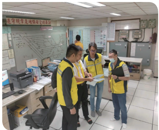
▲本公司營運安全處於光復節前至樹林、瑞芳地區查核

隨著教師節、中秋節、國慶日及光復節等連續假期的到來，旅運需求將顯著增加，臺鐵公司肩負保障旅客安全與提供優質服務的使命。為確保疏運期間營運安全無虞，營運安全處依據「重大節日前連續假期行車保安工作查核作業程序」啟動整備工作，並於假期前進行重點抽查，確保各項安全措施落實到位。