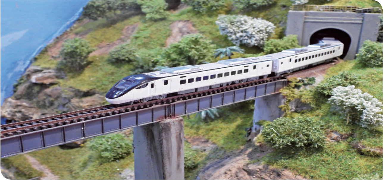
▲極高擬真度再現 EMU3000 型列車的現代美感與技術質感

EMU3000 型盲包一卡通，讓民眾體驗令人緊張興奮的開盒瞬間，抽出命定設計款，民眾驚喜連連！