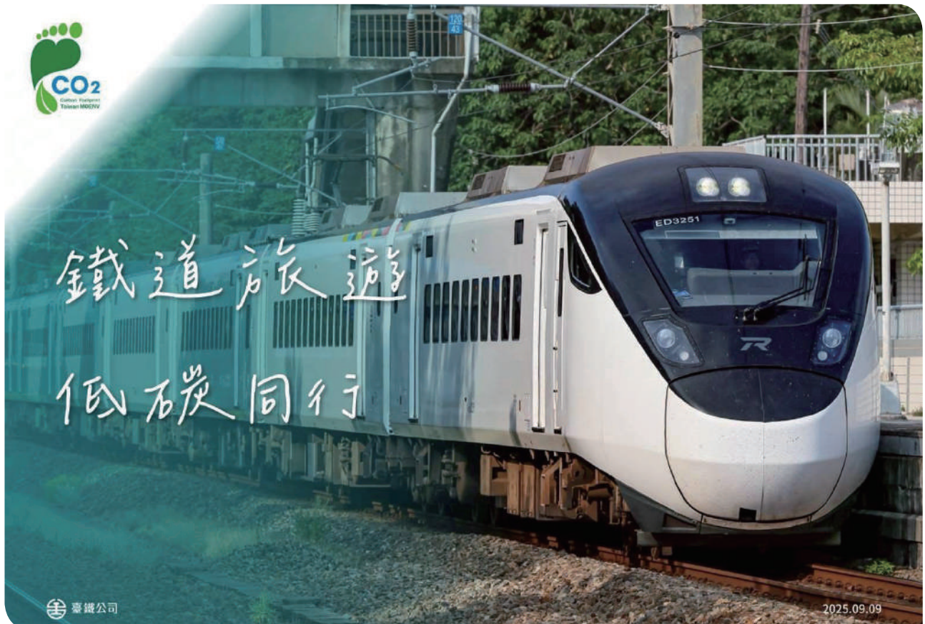
▲臺鐵是低碳旅遊最佳選擇