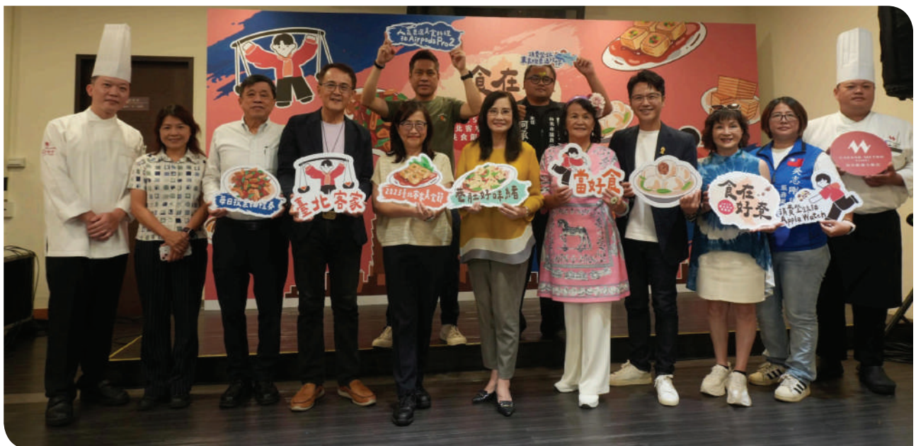
▲ 2025 臺北客家美食節 臺鐵公司與臺北市客委會攜手推出宴客便當

臺鐵公司與臺北市客家事務委員會於「2025 臺北客家美食節」攜手合作，以客家文化傳統宴客菜為靈感設計，推出限定聯名「食在好寮～宴『客』便當」，融合了展現客家飲食文化精髓，邀請大家共同品嚐「宴客」美食好滋味，販售日期自 114 年 9 月 26 日起至 10 月 26 日期間限定限量販售。