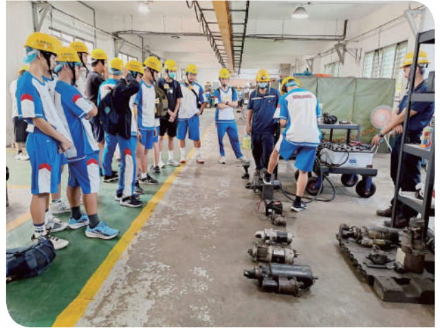
▲學員親身體驗馬達檢修作業

玩」，而是能真正感受到深層的鐵道工作的「專業嚴謹」，以及鐵道人特有的驕傲與使命感！根據調查，現場師生滿意度達九成以上，八成學員表示對臺鐵職涯產生高度興趣；活動也帶動地方