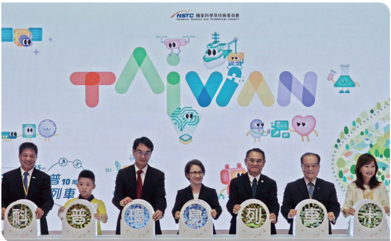
▲科普列車出發儀式

「2025 臺灣科普環島列車」於 10 月 20 日自台北站啟航，展開為期 6 天的全臺科學教育巡禮，並於 10 月 25 日返回台北站舉行閉幕典禮與科學市集。今年適逢科普列車 10 周年，由國科會主辦，臺鐵負責運輸及教育支援，將火車從交通工具轉化為行動教育平台，為全臺孩童提供安全便利的科學學習環境。