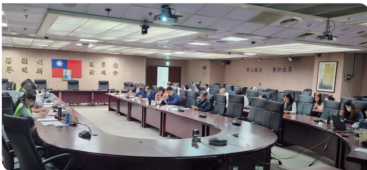
▲臺鐵公司召開勞資會議，勞資代表列席討論議題

為促進勞資合作、建立良好溝通機制，臺鐵公司依勞動基準法第 83 條及勞資會議實施辦法規定，定期召開勞資會議。透過制度化的協商平台，讓員工與公司攜手對話，落實永續經營理念，朝向幸福企業的願景穩健邁進。