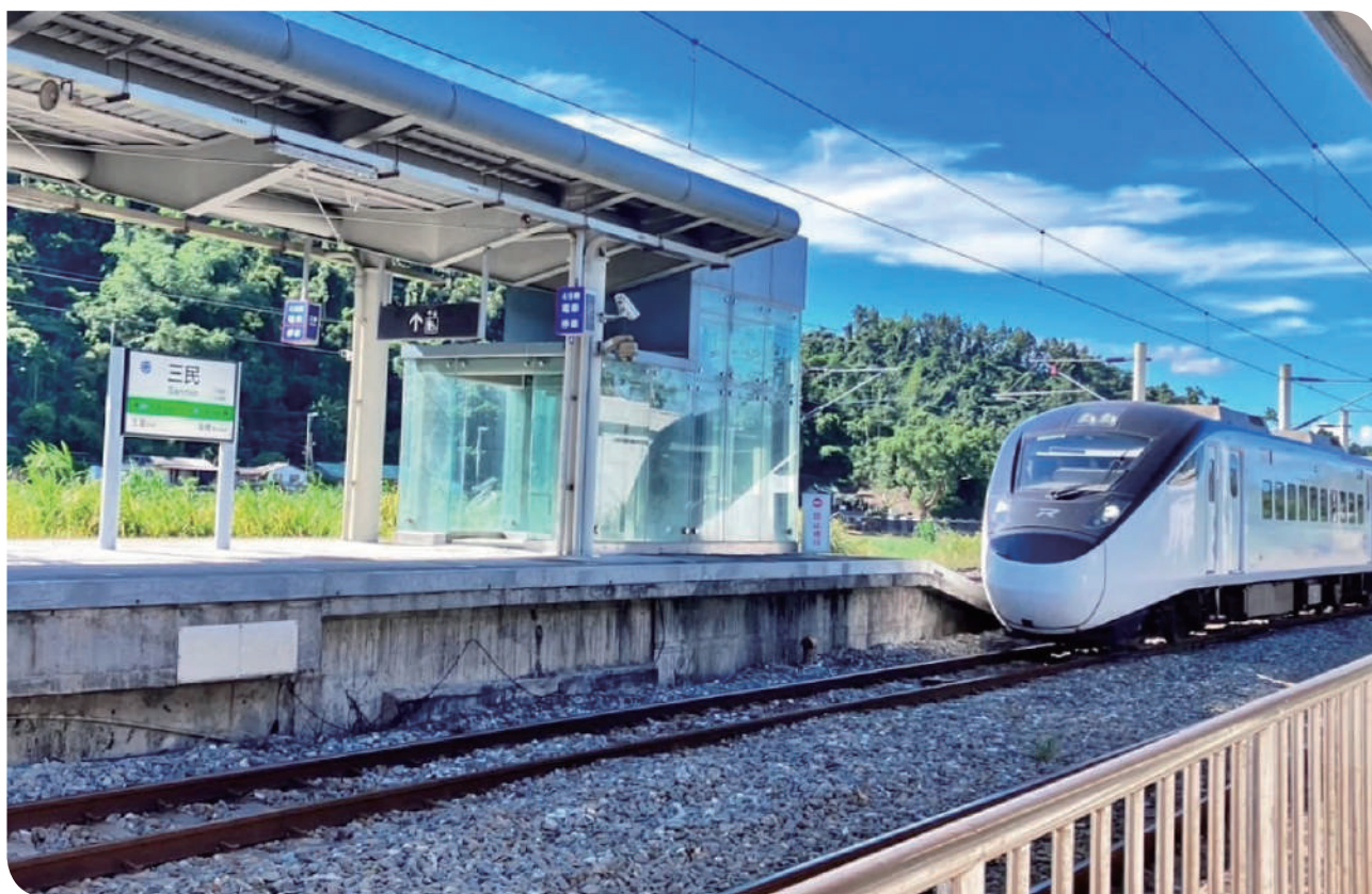
▲搭乘火車來趟「輕」旅行

如果說旅行是一場與風景的對話，那麼花東沿線的九座小站，就是最溫柔、最安靜的篇章。