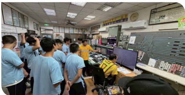
▲學員們專心聆聽行車控制盤的操作方式及示範