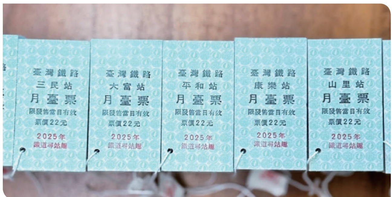
▲活動限量名片式車票