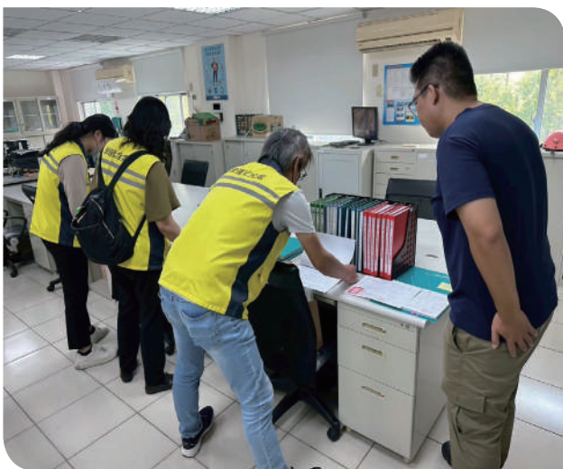
▲本公司營運安全處於中秋節、國慶日前至大甲、後龍地區查核