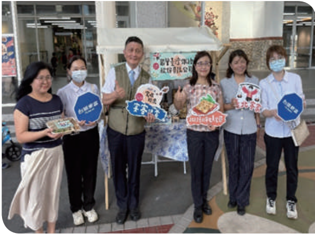
▲附業營運處古時彥處長與臺北市林奕華副市長合影宣傳造勢記者會