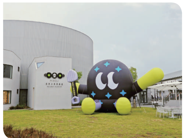
▲園區專屬吉祥物「隧道君」