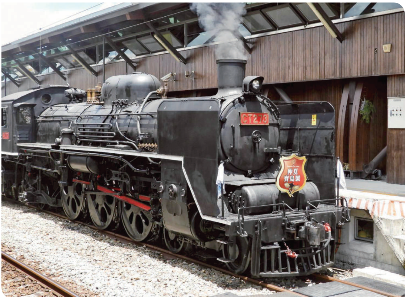
▲ CT273 蒸汽機車停靠池上站第 1 月台進行補水作業

乘坐仲夏寶島號，不僅是搭火車，更是一場穿越歷史的慢旅體驗。CT273 號蒸汽機車歷史悠