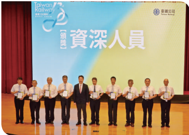
▲交通部陳世凱部長頒發「資深人員」獎項，並與受獎者合影