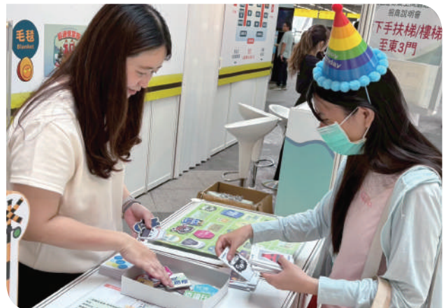
▲「賓果廉連看」遊戲體驗