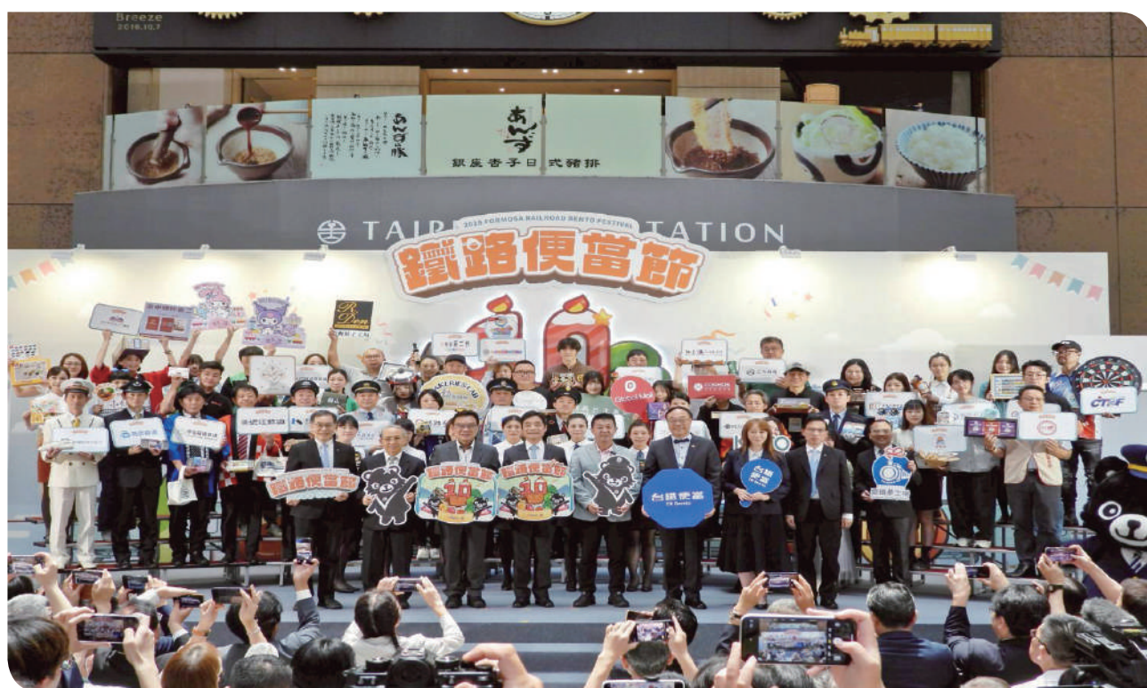
▲ 2025 第 10 屆鐵路便當節 - 臺北場 - 參展業者大集合