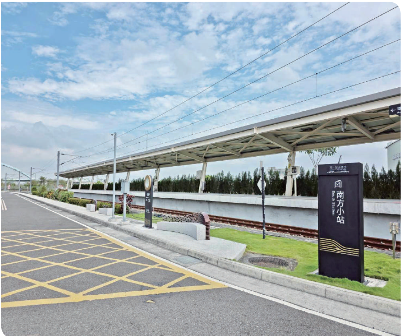
▲潮州機廠內 - 神秘南方小站

今年夏天搭上「噹噹一族彩繪郵輪式列車」，讓鐵道成為串連回憶與感動的旅行方式，開啟一段溫馨且充滿驚喜的仲夏小旅行。