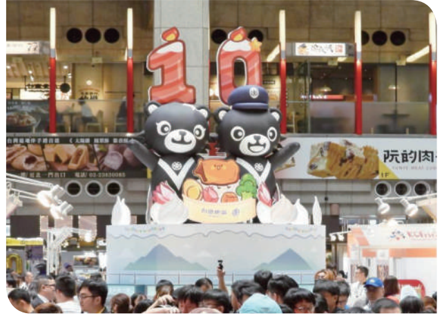
▲生日派對 - 鐵魯漢娜將十週年主題蛋糕

鐵路便當節高雄場的成功，也讓臺北場在 6 月 6 日至 6 月 9 日於臺北車站大廳舉辦的主場活