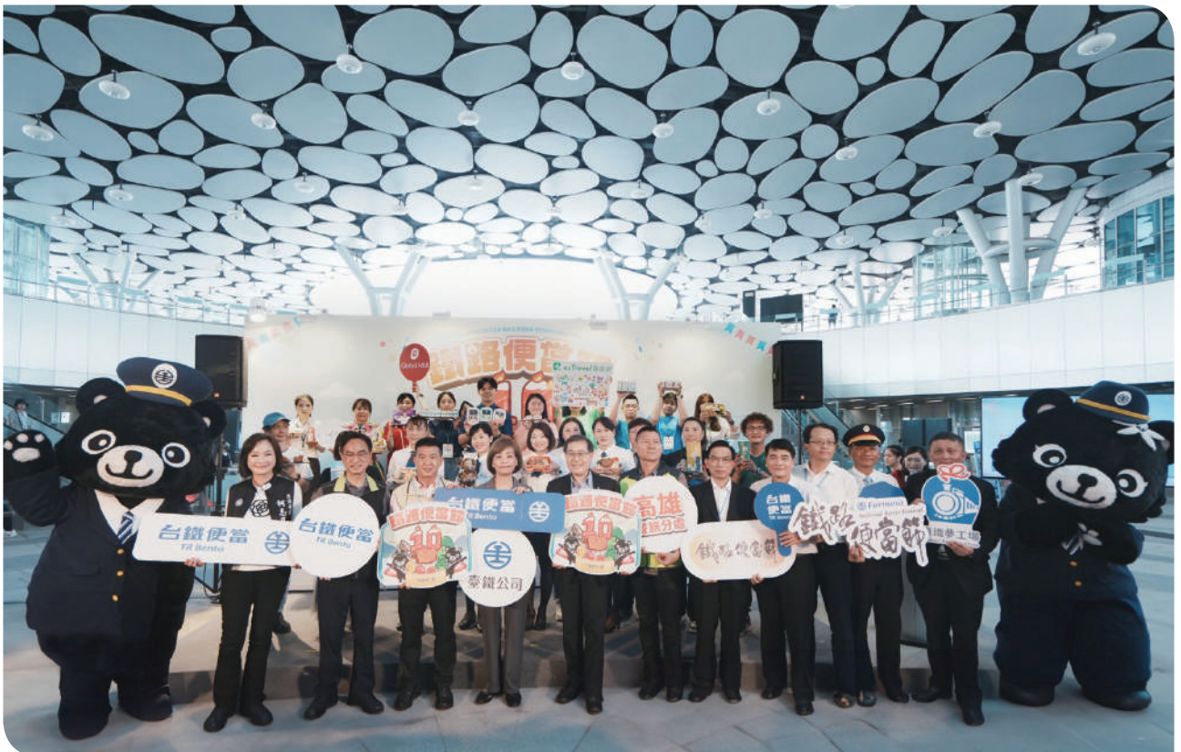
▲ 2025 第 10 屆鐵路便當節（高雄場）開幕記者會 - 嘉賓大合影

今年的鐵路便當節，不僅是十年來的感謝與回顧，更象徵臺鐵公司在轉型過程中的一次重要里程碑。便當不只是單純的餐點，更承載著旅途的情感與記憶，是鐵道文化延伸的具體表現。透過美食與創意的雙重軸線，臺鐵成功打造出一場