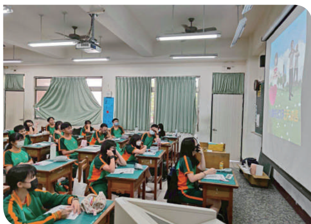
▲潮州機廠與政風室共同合作錄製的「天天誠信」帶動唱廉政宣導短片