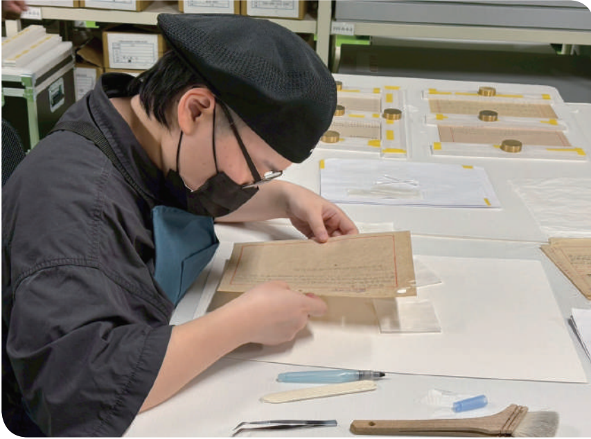
▲委外辦理文物整飭

務處、新事業開發室等專職專人分工進行展示教育、文物典藏研究、歷史建物文物活化進行推廣和管理，期待能夠將文物達到最佳效用。