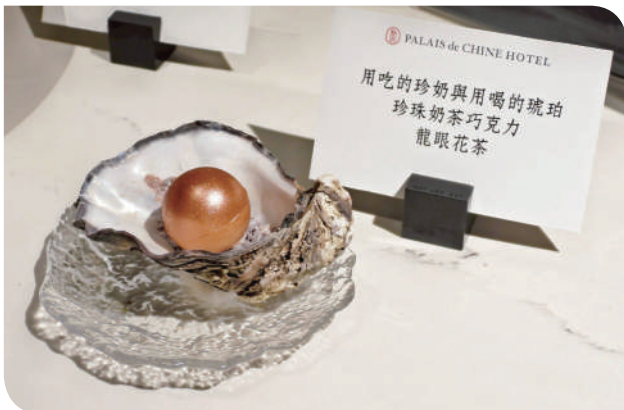
▲甜品：用吃的珍奶與用喝的琥珀

當鐵道不再只是抵達的工具，而是故事與風味的載體，「鳴日廚房」邀你上車，一同啟程。這不僅是一場旅程的開端，更是臺灣鐵道觀光的新篇章。