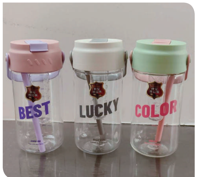
▲仲夏寶島號文宣紀念品環保水壺