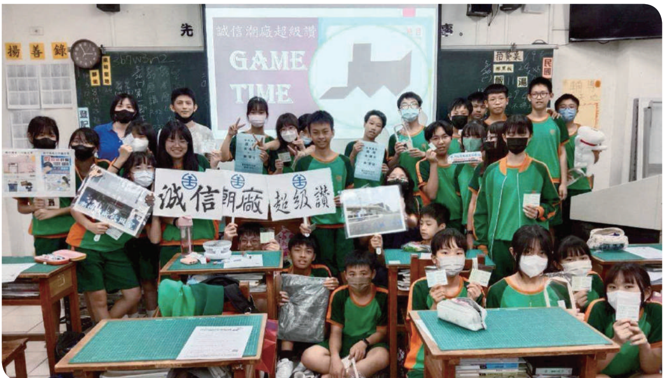
▲活動圓滿完成，大家都完成了互動關卡，人人有獎！