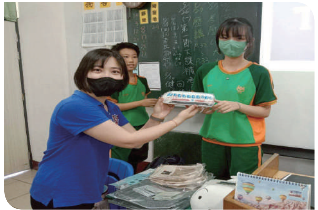
▲參與同學幸運地抽到臺鐵公司夢工場販售的火車造型文具筆袋

下一場「誠信潮廠超級讚」活動將繼續前進其他地點，帶著火車的故事、誠信的信念，向社會每一個角落傳遞本公司誠信永續的核心精神。