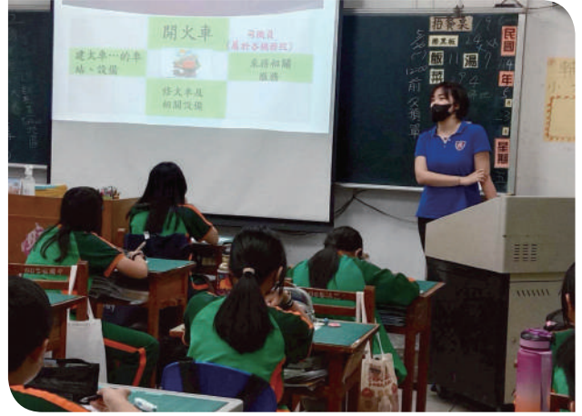
▲透過課程介紹，讓學生認知到火車運行除了車站跟司機員，還有許多默默耕耘的工程、電力、維修、行政單位等

從潮州機廠走入校園的這一場活動，不只是一種單純的職業導覽，而是一種企業文化與誠信精神的傳遞。本公司期待透過這樣的交流，讓誠信不再只是教科書上的抽象詞彙，而成為年輕學子心中的價值種子，日後開出改變世界的綠芽。