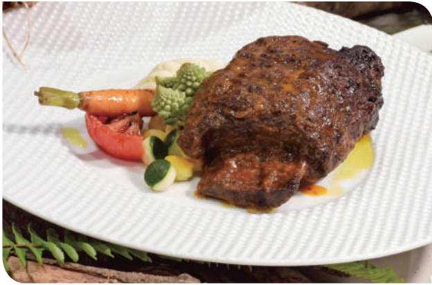
▲主餐：西部牛仔很忙 - 帶骨牛小排