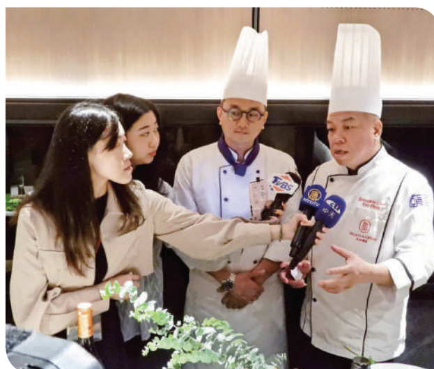
▲【移動美學 · 品味饗宴】縱谷山水名物宴