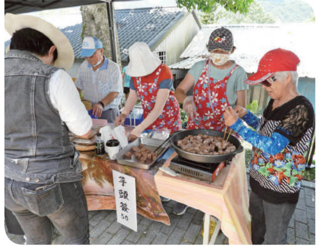
▲東部特產之一芋頭糰

久，聲音沉穩、氣勢磅礴，是臺灣鐵道文化的經典象徵。在夏日陽光下，蒸氣裊裊升起，配上花東縱谷如畫田野與青山，無疑是鐵道攝影愛好者的夢幻場景。