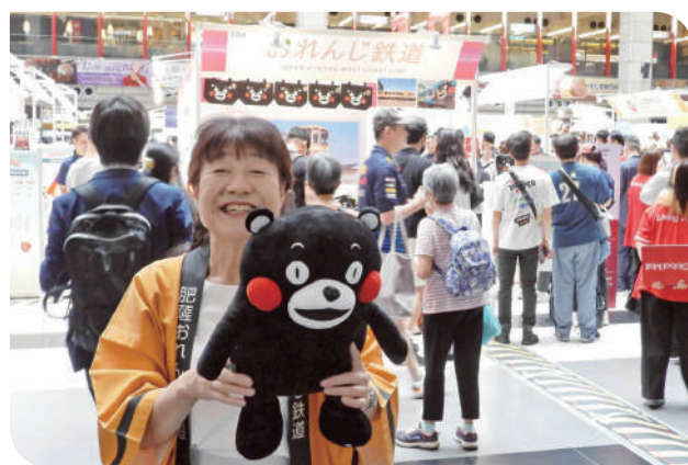
▲ 日本肥薩橙鐵道 (肥薩おれんじ鉄道) - 代表取締役古森社長特地親自來台參展並於現場販售限量空運來台特製便當