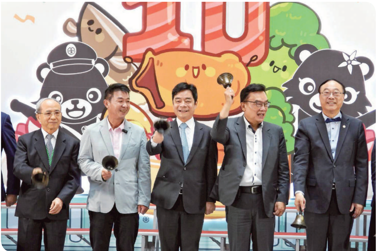
▲臺鐵公司伍勝園董事長及與會人員運安會林信得主任委員、許智傑立法委員、林國成立法委員、觀光署周永暉署長為 2025 第 10 屆鐵路便當節臺北場進行啟動儀式 - 搖鈴開賣

展場內劃分五大主題區域：「台鐵便當店」、「美味直送專區」、「鐵魯漢娜將主題餐廳」、「互動體驗區」與「十週年主題蛋糕」裝置藝術。