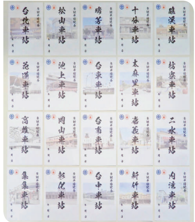
▲ 20 款鐵印樣式

參與者只要憑台鐵鐵印帳與當日車票（包含實體車票、電子票證乘車證明、周遊券、TR-PASS 或 Taiwan PASS 等），就能於活動期間前往全台 20 個指定車站兌換特色鐵印。車站涵蓋