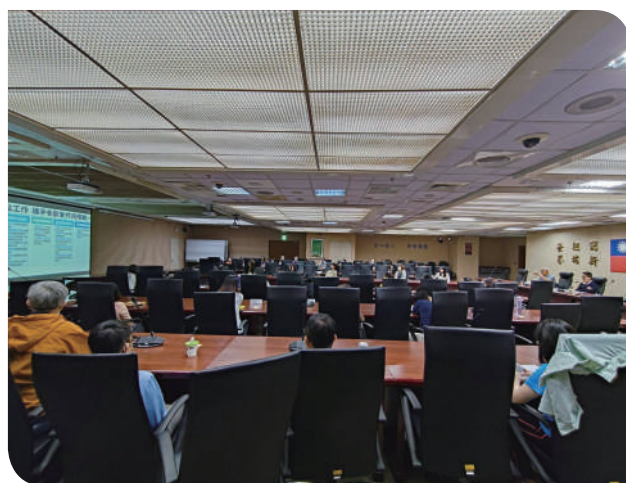
▲114年5月16日召開「從地方創生看臺鐵可能的角色」演講

臺鐵公司於114年5月16日邀請曾旭正教授演講「地方創生看臺鐵可能的角色」專題，過程中曾教授除了侃侃而談35年社區營造經驗，並且活潑生動的分享日本北海道的地方創生經驗。曾教授更是早期文建會（文化部前身）推動臺灣社區總體營造政策時，構思政策的幕後重要推手。我們可以從北海道古川町的一條小水溝—瀨戶川開始，理解在地居民如何以瀨戶川水質改善為核心，凝聚社區參與意識，並持續擴展至在地鄉親願意並樂意分工、課責至共同決策，進一步發想出國內外馳名的人間四月天「春季古川祭」，吸引在地年輕人回流與數萬遊客參訪。