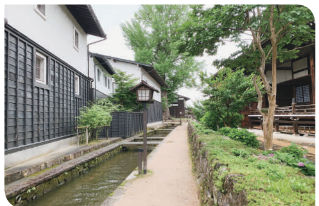
▲日本北海道古川町瀨戶川為社區總體營造核心