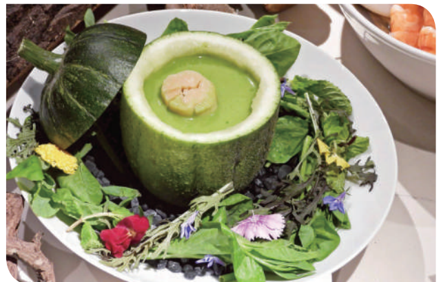
▲湯品以食材盛裝，結合 ESG 理念，減少一次使用餐具