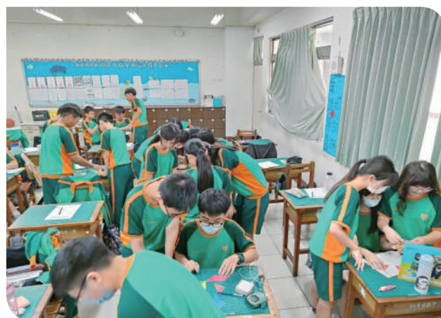
▲臺鐵公司政風處自製文宣設計趣味益智遊戲「以誠相載 永續服務」七巧板

在南臺灣的高屏平原，有一處鐵道迷熟悉的地標——潮州機廠。這裡不僅是火車的「健康檢查站」，也是臺鐵公司誠信文化的推動基地。潮州機廠與政風室攜手策劃了一系列別具意義的活動：「誠信潮廠超級讚」。以活潑互動方式傳達誠信經營與永續治理的企業理念，並將廉潔精神深植於民眾與學子心中。