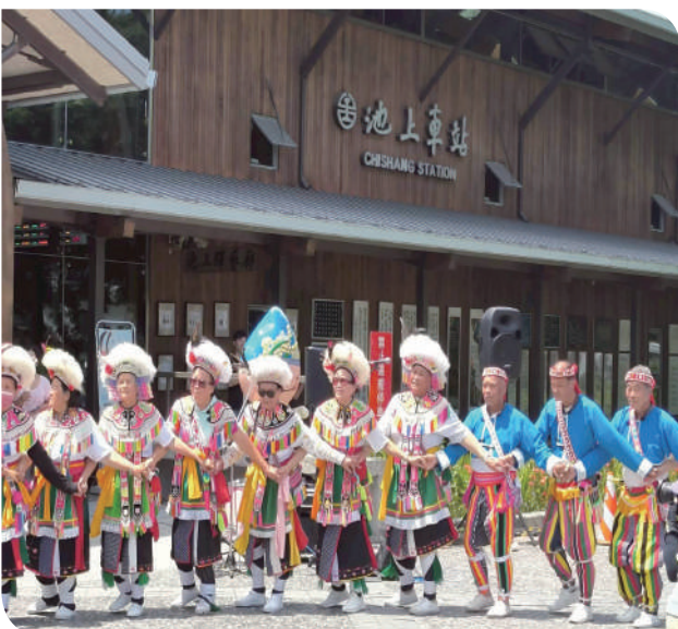
▲池上鄉公所與池上農會邀請地方表演團體

一起在今夏搭上這列緩慢卻充滿故事的仲夏寶島號，讓蒸汽與鐵道聲，陪你寫下一段專屬於臺灣的經典旅程。