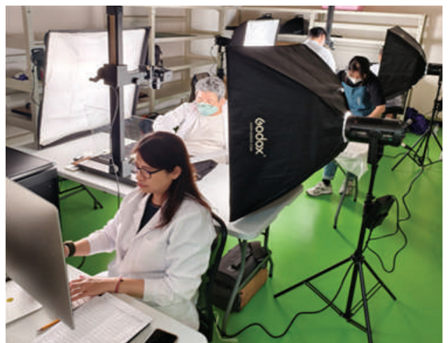
▲委外辦理數位保存

對於硬體面文物修復及管理，台電文物典藏中心委外辦理文物整飭及規劃，根據文物性質進行合宜保存方式，建置具有國家級消毒作業、恆溫恆濕系統、Novec 1230 氣體滅火設備、淹水警報器等專業規格之「國家檔案保存標準庫房」收納保管文物，每年至少編列 1 千萬元經費預算確保文資穩定存續，展現高度專業性系統性管理方法。