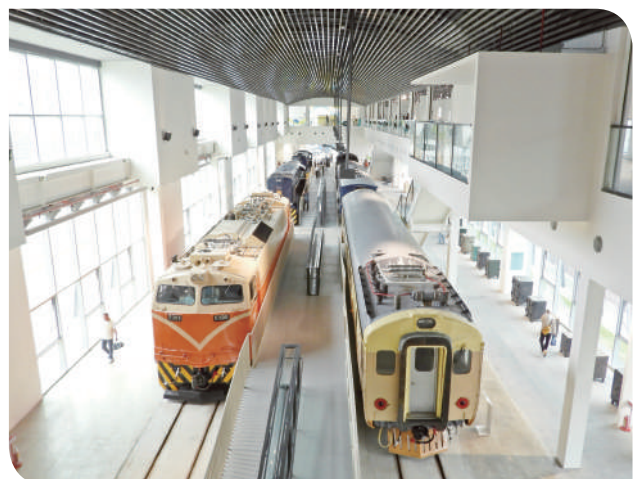
▲列車展示館室內一景