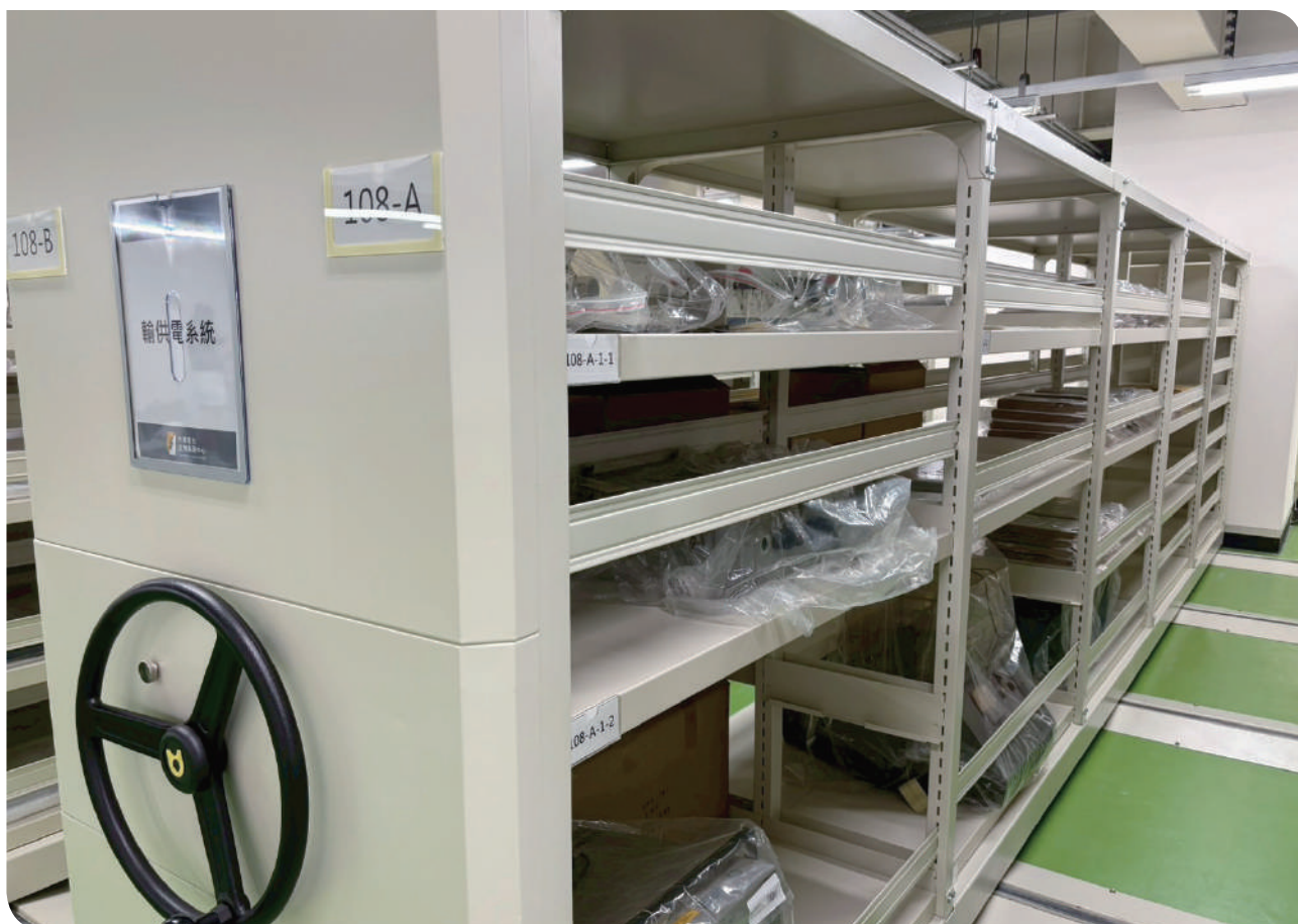
▲台電文物典藏中心文物庫房

透過實地參訪，瞭解台電文物典藏中心能擁有堅強的文資管理軟實力，係跨單位齊心協力共同創造文資歷史的結果，由召集人及執行工作小組先行規劃，後續由公眾服務處、秘書處、財