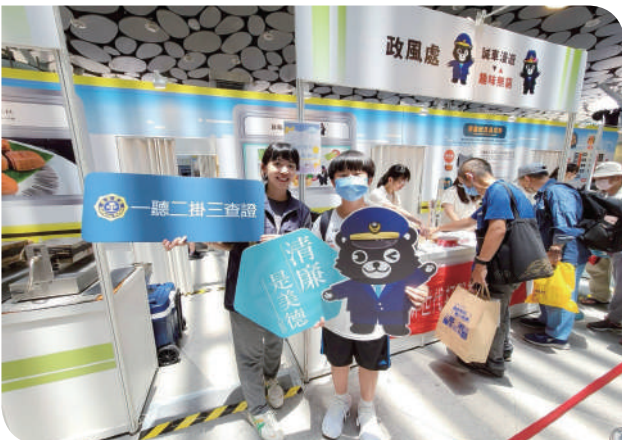
▲參與民眾於展區前合影

活動兩日吸引眾多親子家庭熱情參與，現場氣氛熱絡，也讓企業誠信教育突破以往刻板的宣導框架，成為實用又有趣的體驗。透過這樣充滿互動與創意的方式，本公司不僅傳達了誠信經營