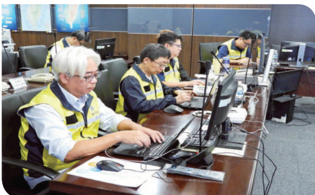
▲「票價調整一級應變小組」工作情形

這場改革，標誌著本公司邁入新階段的起點。在安全與準點之外，本公司將持續提升服務品質，為國人提供更安全、準點且便捷的運輸服務。