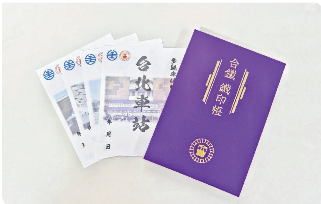
▲鐵印帳及特色鐵印展示