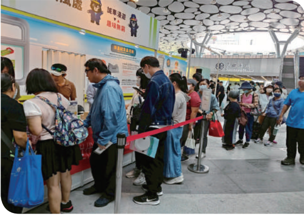
▲展區現場排隊人潮

活動現場化身為一座鐵道主題樂園，設有「賓果廉連看」、「反詐火車迷宮」、「鐵定串廉」與「廉政保齡球」等趣味關卡，寓教於樂之餘，也巧妙融入企業誠信、反詐騙與鐵路行車安全等重要觀念。參加者只要順利完成各項挑戰，即可兌換臺鐵精心準備的宣導紀念品，不少家長與小朋友一起闖關，玩得不亦樂乎。