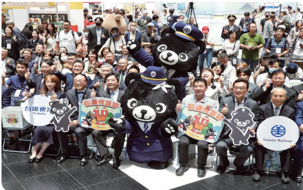
▲ 2025 第 10 屆鐵路便當節 - 臺北場開幕記者會 - 嘉賓大合影

每日限量推出多款特色便當、聯名商品與文創精品，邀請旅客在熟悉的臺北車站空間中，重新品味鐵道美食的感動與記憶。