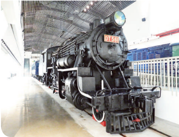
▲全球唯一僅存，百年美製蒸汽機車 DT561

計有 17 間店鋪引進各種特色餐食、咖啡廳、在地農特產及手工藝品創作。其中，營運廠商並以苗栗之舊地名「貓裏」發想，成立「喵務處」，會有臺鐵第一任的貓處長率領可愛貓群和遊客療癒互動。商鋪區未來也有機會依經營情況延長營業時間至夜間，提供溫馨的燈光氛圍與休憩座椅服務旅客及附近居民，為苗栗市區新增一處夜間步行慢活的好所在。