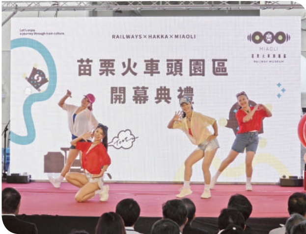
▲表演人員勁歌熱舞歡慶園區開幕