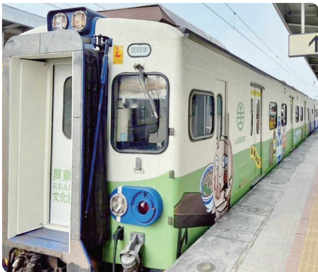
▲ EMU500 型嗶嗶一族彩繪列車

睽違多年，鐵道迷們引頸期盼的「郵輪式列車」終於強勢回歸！這一次，臺鐵公司以滿載童趣的「嗶嗶一族彩繪列車」為主角，於