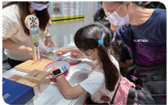
▲「鐵定串廉」遊戲體驗

誠如本次活動名稱所示，「誠車漫遊」不只是鐵道旅程的延伸，更是全民廉潔意識啟程的起點。在遊戲與笑聲中播下誠信與防詐的種子，臺鐵正以嶄新姿態，朝向更值得信賴的永續企業邁進。