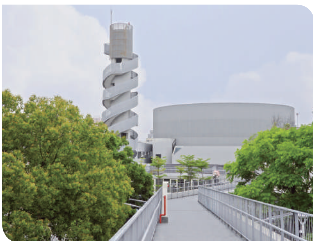
▲可鳥瞰苗栗車站正線列車運轉之空橋與瞭望塔

商鋪區係由舊有之鐵路一村宿舍建物整建及新建為「火車頭一村」，活化利用招商，園區內