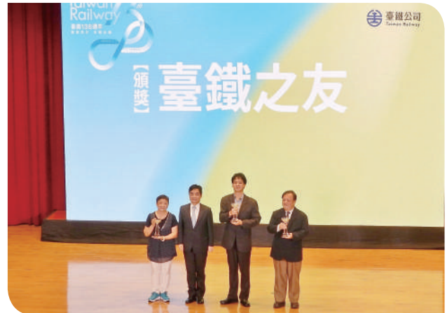
▲臺鐵公司伍勝園董事長頒發「臺鐵之友」獎項，並與受獎者合影

慶祝大會中，臺鐵公司表揚了一群默默耕耘、堅守崗位的鐵道人，分別頒發「臺鐵之友」、「優良志工」、「服務滿40年資深人員」及「績優人員」等獎項，向這些為鐵路奉獻心力的夥伴致上最崇高的敬意。正是有他們的堅持與付出，讓這條貫穿臺灣、連結人心的鐵道路網，持續穩健前行。