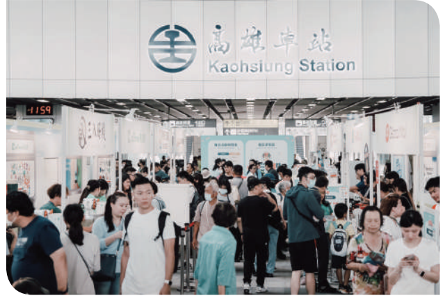
▲民眾踴躍參觀，現場人潮絡繹不絕