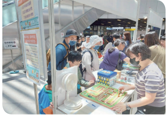
▲「反詐火車迷宮」遊戲體驗