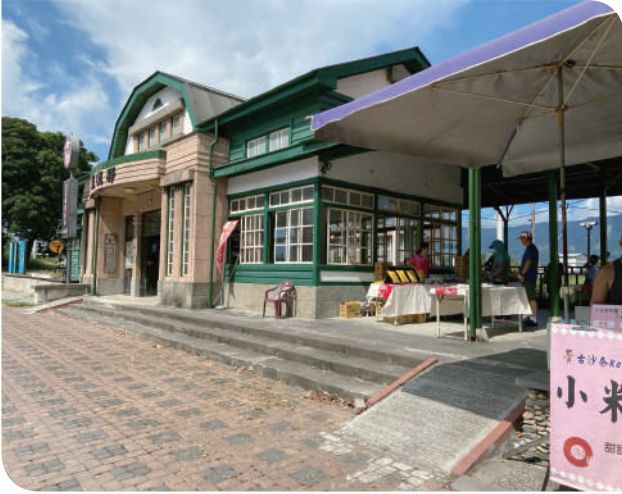
▲關山站建於 1922 年，舊名「里壠」，1937 更名為關山