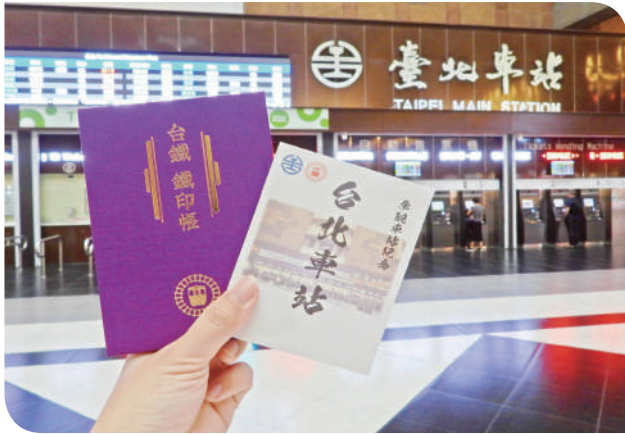
▲旅客手持鐵印及鐵印帳，於臺北車站售票窗口前留影紀念

個指定據點開賣，每人每次限購一本，售價新台幣 499 元。這本鐵印帳，是對日本鐵印文化的致敬，也是臺灣鐵道旅行的新創舉。