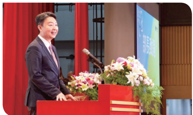
▲交通部陳世凱部長親臨鐵路節慶祝大會祝賀臺鐵138週年生日快樂

114年6月6日上午9時，臺灣鐵路公司於臺鐵大樓演藝廳舉行「114年鐵路節（臺鐵138週年）慶祝大會」，交通部陳世凱部長、臺鐵公司伍勝園董事長及各級長官蒞臨致賀，與來自國內外軌道界的夥伴、日本十餘家友好鐵道業者代表齊聚一堂，共同見證這段悠長鐵道歷史的新頁。