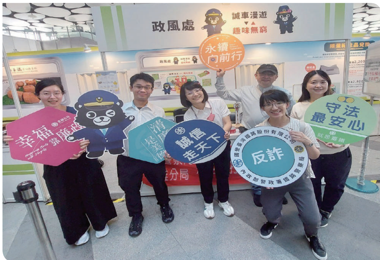
▲臺鐵公司政風處同仁合影