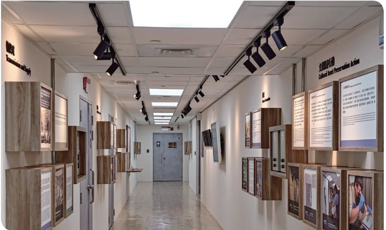
▲走廊展示臺灣電業發展歷史