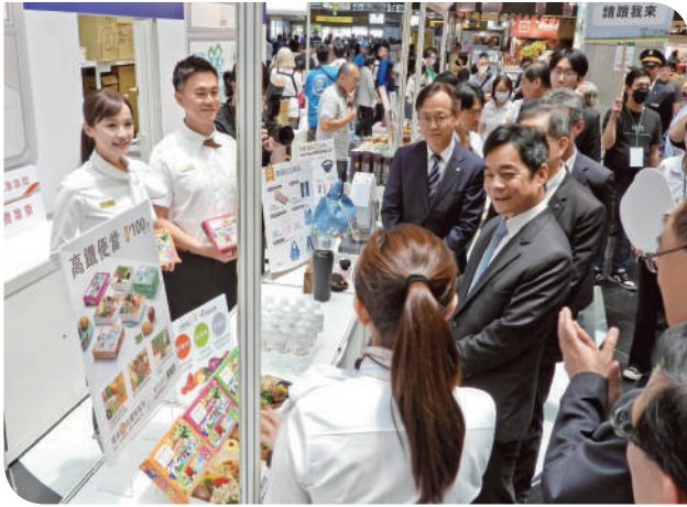
▲臺鐵公司伍勝園董事長前往台灣高鐵攤位加油打氣

(限量 10 組)、復古藍皮列車與莒光列車造型的陶瓷便當盒，以及紀念鐵魯與漢娜將 10 歲生日的「芭芒柳」精釀啤酒與專屬周邊商品。其中人氣吉祥物鐵魯與漢娜將的現身，也為活動帶來高潮，不僅吸引大小朋友排隊合照，也成功帶動拍照打卡熱潮。