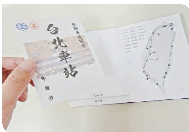
▲特色鐵印蒐集過程

這項活動自鐵路節起同步開跑，首波限量發售 114 年 6 月 9 日在臺北、臺中、高雄、花蓮四