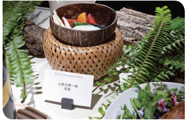
▲前菜：山裡的那一碗

耘鐵道觀光的用心經營。作為臺鐵推動觀光列車的重要夥伴，雄獅此次再度發揮整合力，邀請雲品國際加入陣容，共同為國內鐵道旅遊注入新世代的創意與服務思維。