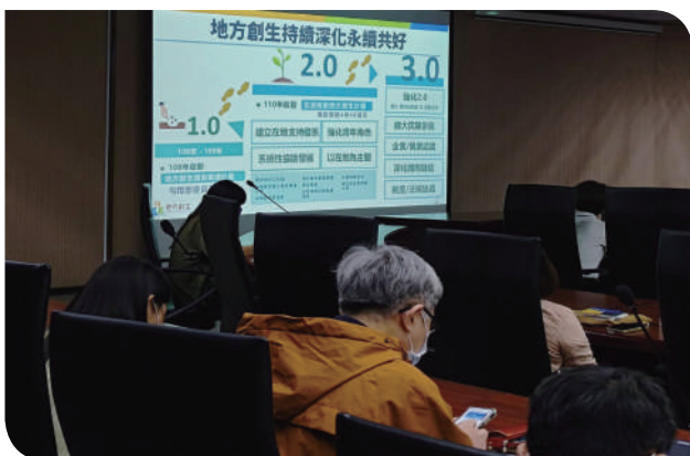
▲行政院國家發展委員會地方創生政策

目前臺鐵公司已訂有「車站結合地方創生作業要點」以響應政府地方創生政策，可有效利用車站空間，促進車站與地方連結，提升車站及周邊地區活力，並透過地方創生發展與各車站毗鄰地區閒置空間活化，經過本次演講對於後續推動地方創生業務，整合內外部資源，加速車站活化進程等業務，更具有重要指導意義。