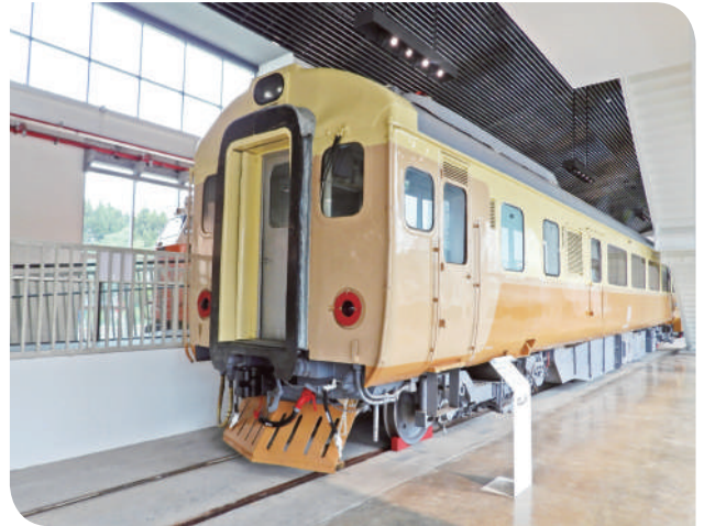
▲英國製優雅配色之 EP108

苗栗火車頭園區定位為寓教於樂的親子同遊園區，不僅針對鐵路文物作保存與展示，在展覽主題上亦特別設計多種互動體驗裝置，如大型 LED 薄膜影音牆、齒輪、氣壓煞車、火車車輪等有趣互動，園區也對購買套票之團體旅客，提供搭乘遊園小火車、投煤影音體驗及戶外轉車盤操