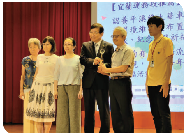
▲交通部部長王國材頒發「臺鐵之友」貴賓合影

112年6月9日鐵路節是臺灣鐵道界最重要的日子！臺灣鐵路已邁進136年，臺鐵局特別於臺鐵大樓演藝廳舉辦「112年鐵路節(臺鐵136週年)慶祝大會」，邀請交通部王國材部長親臨大會頒獎，祝賀臺鐵136週年生日快樂，同時向長年在工作崗位上風雨無阻、努力不懈，提供國人優質運輸服務的臺鐵人致意，感謝大家無私的奉獻與付出。部長在致詞中表示，臺鐵提供優質便利民行的軌道輸運，並持續扮演公共運輸關鍵角色，因為有臺鐵團隊的努力，民眾方享有安全、便捷的服務，都市環境發展及國人生活品質得以提高。交通部將積極協助臺鐵公司化，持