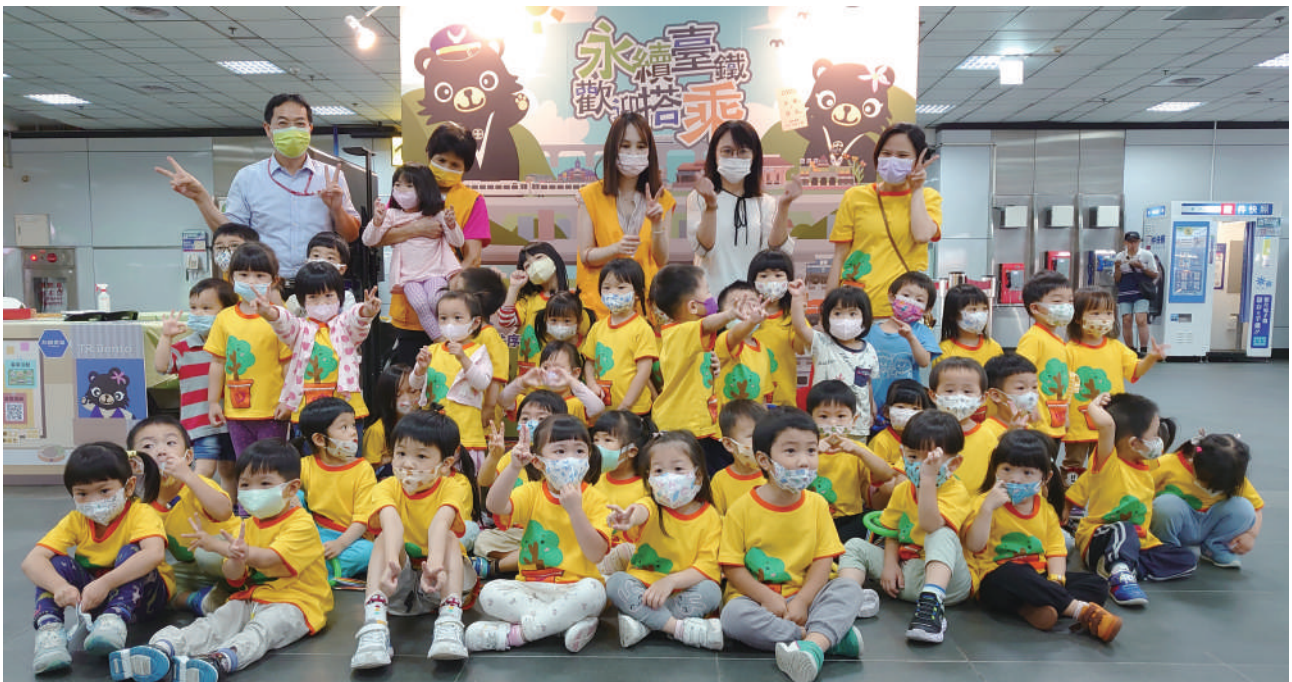
▲臺北車站職場互助教保服務中心師生參觀「誠信好好玩」展區與主視覺背板進行大合照

為歡慶 112 年鐵路節 ( 臺鐵 136 周年 ) 及第 8 屆鐵路便當節，臺鐵局政風室特別設計結合臺鐵局運輸服務及附屬事業特色，以「誠信」為主題之廉潔數位教材，並進行系列性宣導活動，包含於 6 月 1 日至 6 月 14 日邀請全國民眾參加「永續臺鐵，歡迎搭乘」線上有獎徵答活動；6 月 9 日至 6 月 12 日於第 8 屆鐵路便當節設置「誠信好好玩」展區；6 月 12 日結合便當節閉幕式致贈參展廠商感謝狀儀式，舉行「誠信經營、永續臺鐵，感謝有您」倡議活動，邀請同仁、企業代表及大小朋友一同共襄盛舉。