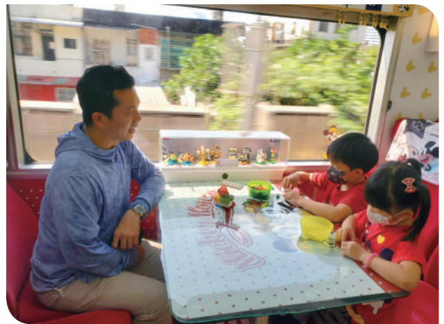
▲陪伴小朋友一起玩樂高積木共享迪士尼歡樂時光

迪士尼 100 週年為主題所打造的臺鐵「環島之星夢想號」迪士尼主題列車，提供多種娛樂設施與體驗活動，讓旅客一上車就可以盡情玩樂，堪稱是全台最好玩、最歡樂的觀光列車！為給予旅客更多不一樣的驚喜，臺鐵「環島之星夢想號」協力廠商易遊網攜手全球知名玩具樂高®合作，將 LEGO® Disney100 周年系列商品搬上「環島之星夢想號」。旅客搭乘臺鐵「環島之星夢想號」，可體驗全臺最歡樂好玩的迪士尼主題