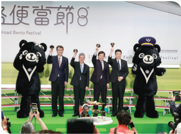
▲行政院院長陳建仁、發言人林子倫、交通部部長王國材、局長杜微搖鈴揭開便當節活動

道》蕭菊貞導演與臺鐵局局長對談分享鐵道故事、DIY 現場體驗手作、今年特別增加互動體驗闖關獲取免費「扭蛋機會」鐵路系列活動，讓民眾不僅能享美食，也能玩得盡興！