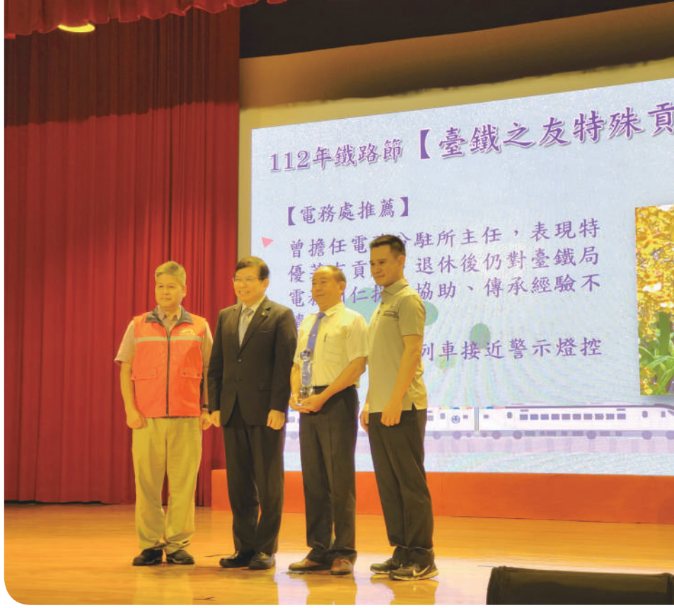
▲交通部部長王國材與「特殊貢獻獎」貴賓合影