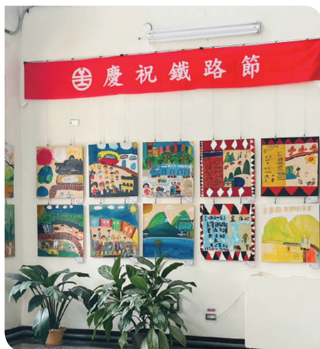
▲東澳車站內慶祝活動

位於原民鄉的東澳車站傳來美妙的聲音，東澳國小穿著原住民服飾現場合唱，搭配東澳站高