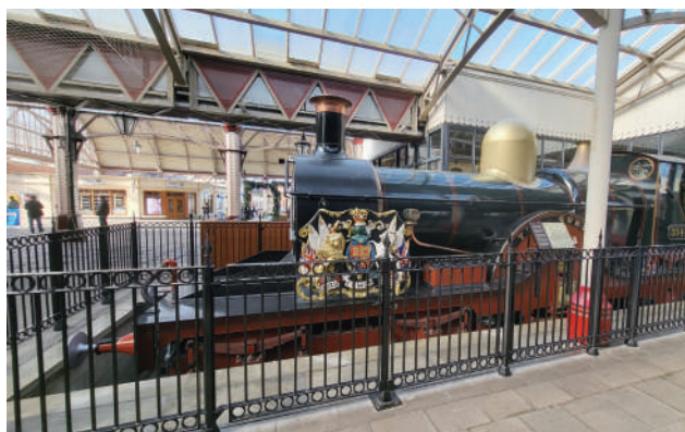
▲ The Queen 女王號機車頭