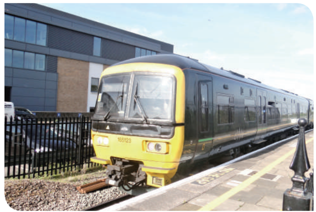
▲ Great Western Railway (GWR) 二節車廂柴聯車

在一個風和日麗，倫敦難得的美麗晴天，搭乘英國鐵路 Great Western Railway (GWR)，編號 165123 的二節車廂柴聯車，車頭是鮮黃外觀搭配綠色造型設計，抵達僅有一個月台的溫莎 - 伊