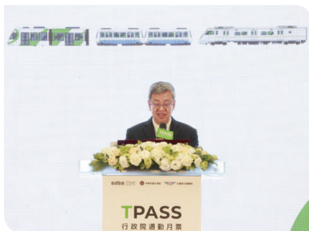
▲行政院陳院長建仁活動致詞

行政院陳院長致詞時表示，交通部依「疫後強化經濟與社會韌性及全民共享經濟成果特別條例」，編列 3 年經費 200 億元推動全國公共運輸