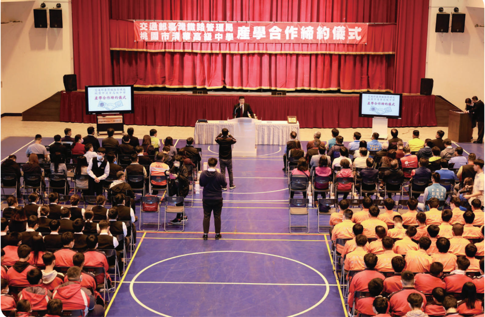
▲臺鐵局局長杜微致詞勉勵清華高中同學

知能與專業技能，並積極協助學生考取相關證照，提高未來進入相關產業機會，達成學校核心價值「成就每一位學習者」。其後臺鐵局亦不斷投入優良師資，並贈予校方柴電機車、車廂等設備，加強實習效能，未來將結合富岡基地內新設之鐵道學院（員訓中心）軟硬體，讓學生有充分的就學環境及就業出路。