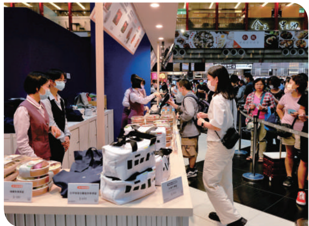
▲ 2023 第 8 屆鐵路便當節搶購排隊人潮

本屆鐵路便當節展場由臺北車站 1 樓多功能展演區外擴，參展廠商家數 ( 由 39 家成長至 42 家 ) 及參觀人數刷新歷史紀錄 ( 相較上一屆成長 15.24% )，展場營收再創新高 ( 相較上一屆成長 33.03% )，台鐵便當推出 2 款商品化高價便當，營收破歷年新高 ( 相較上一屆成長 55.5% )，媒體露出則數增加 260 則 ( 相較上一屆成長 153% )。期待明年的便當節可望打造鐵道界知名品牌盛宴，進而引領國內外觀光朝聖風潮。