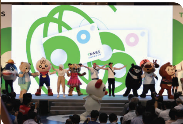
▲各單位吉祥物一起舞動 TPASS 通勤月票