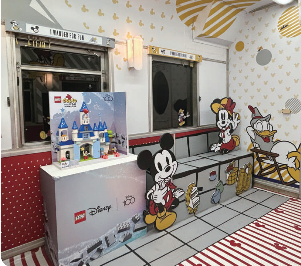
▲ 三合一魔法城堡積木與米奇