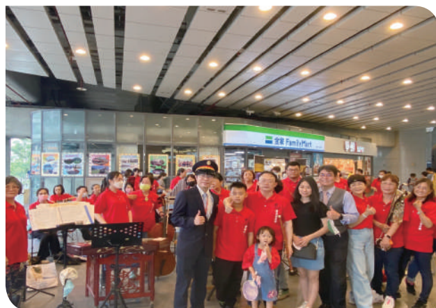
▲豐原站在地社團才藝表演

臺中站於6月4日辦理慶祝活動，邀請五權社區大學學員、維他露基金會、經典國際公司、臺中李方艾美酒店、大魯閣新時代購物中心、鐵道故事館、臺中捷運公司、及本局臺中餐廳、資開中心臺中所共襄盛舉，提供摸彩禮品，藉由本