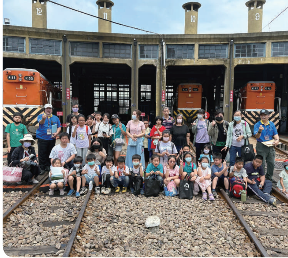
▲彰化站弱勢家庭學生參觀活動

賢市長等貴賓蒞臨同慶！外部社區團體計有彰化市立圖書館合唱團、Babuza 混聲合唱團、烏克蘭麗班音樂饗宴、舞蹈等各式表演；站內會議室安排火車模型動態展示；第二月台還有深受國人喜愛的臺灣國寶蒸汽火車 CK124 靜態展示；同時安排芳苑國小與美國小弱勢家庭學生參觀活動，讓小朋友們以最近距離的方式接觸平時不易接觸的鐵道文化。