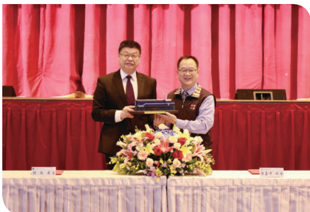
▲臺鐵局局長杜微與清華高中董事長陳光增互贈禮物

同培育新生代鐵路專業人才，更透過至鄰近的臺北運務段加強產學合作營運實習課程，學生於實習期間將實務操作與理論課程互相結合，及早建立鐵路基礎知識，有效縮短未來投入鐵路運輸產業適應期，臺鐵局同時鼓勵對鐵路運輸職涯有興趣願意投入服務的學子加入，共同提升整體軌道運輸服務，創造鐵路事業新願景。