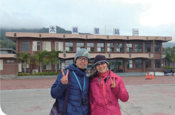
▲哲誠陪伴媽媽停留太麻車站前合影