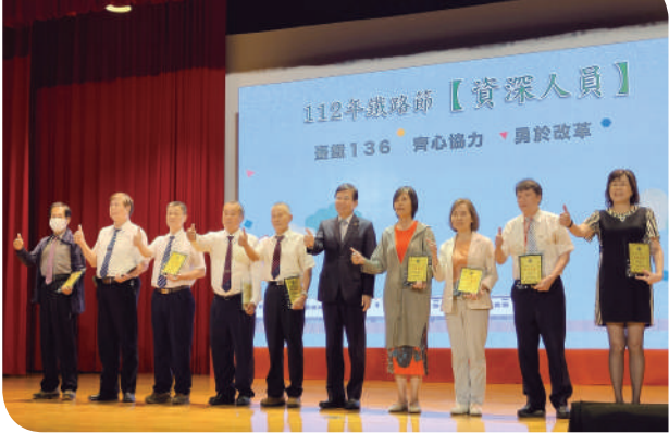
▲交通部部長王國材與臺鐵「服務資深人員」合影