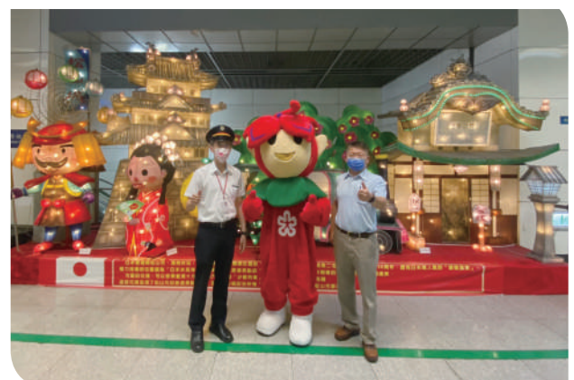
▲松山站候車區展示日本松山市花燈