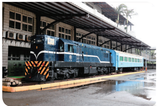
▲ R70 機車頭及復興號車廂