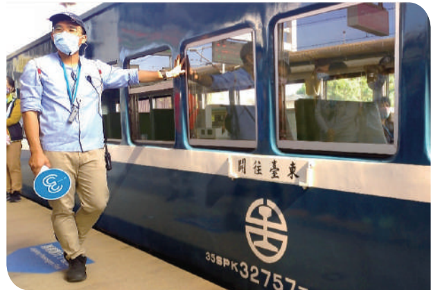
▲藍皮解憂號停靠月台