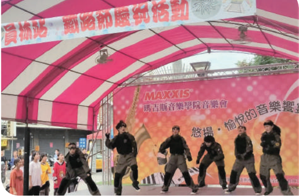
▲臺中運務段員林站在地社團舞蹈表演