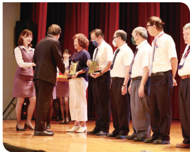
▲交通部部長王國材頒獎服務資深人員

國營臺灣鐵路股份有限公司即將在明 (113) 年元旦掛牌，今年係「臺鐵局」舉行各式各樣鐵路節系列活動，深具意義的一年。轉型改革需要所有臺鐵人齊心協力，勇於面對困難與挑戰，【臺