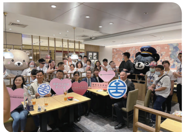
▲臺鐵參與微風基金會暨唐氏症基金會公益活動

2F 名店大戶屋美食。局長表示：「臺鐵局支持公益活動，希望今天的鐵道文化巡禮可以帶給唐寶寶們在建築歷史、鐵道文化、人文風情三方面一次滿足，台鐵暖心，唐寶寶開心。」局長還親自致贈最美區間車 EMU900 造型毛巾及口笛給唐