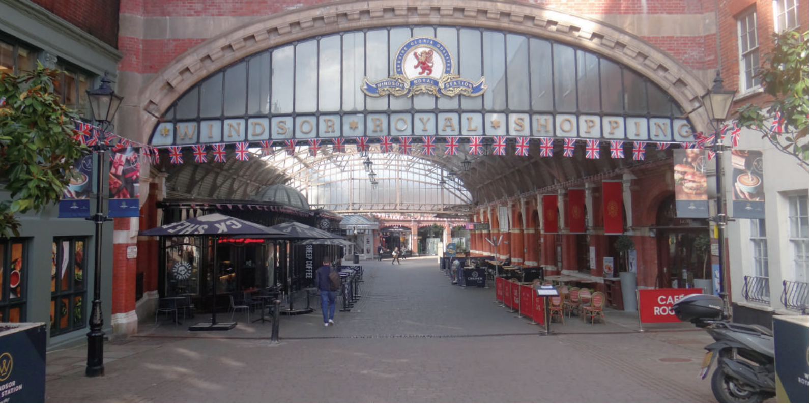
▲溫莎皇家購物中心正門及商店街

板顯示購物中心地圖指引資訊及於商店側面牆面嵌上地圖等相關資訊。整個購物中心包含時尚精品、服飾店、咖啡店、餐廳、生活用品及禮品店等商店，其中還有很多女生喜歡的 Jo Malone 香水店，而禮品店販售很多英國特色商品，滿滿的英國元素，整條商店街非常值得一逛。整排商店街上方屋頂造型簡單，採透明光板設計，陽光穿透灑入建築物間，漫遊其中，體驗濃縮版小鎮風情，尤其是在咖啡店悠閒的享用下午茶，極具英式情調，嚐盡整個溫莎的浪漫。