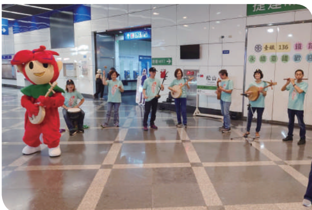
▲松山車站大廳「丟丟銅仔、板橋查某..」等傳統民謠表演