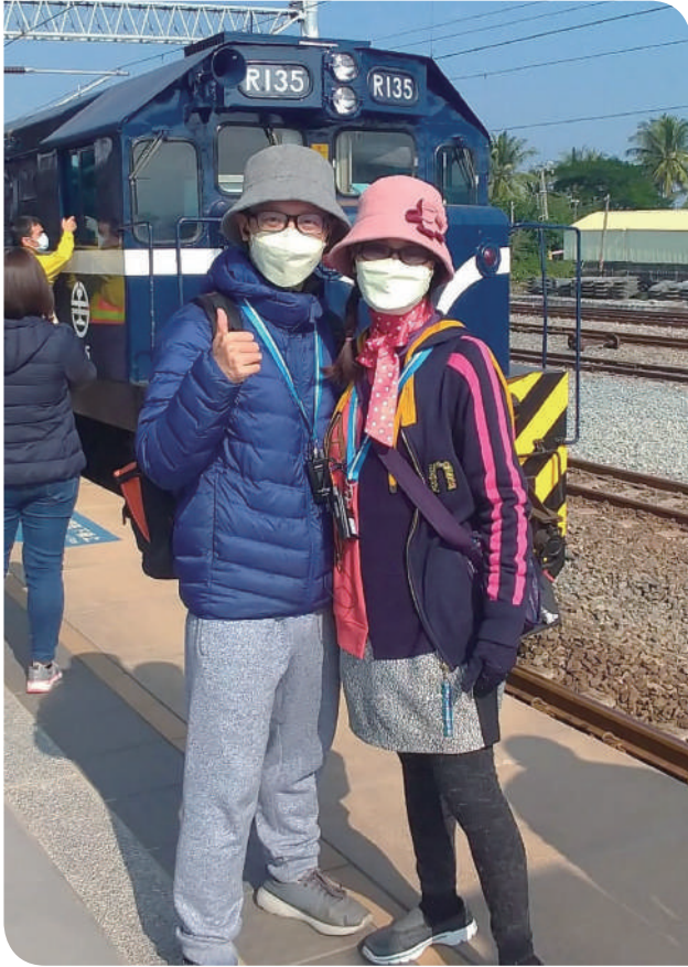
▲哲誠陪伴母親踏上南迴之旅