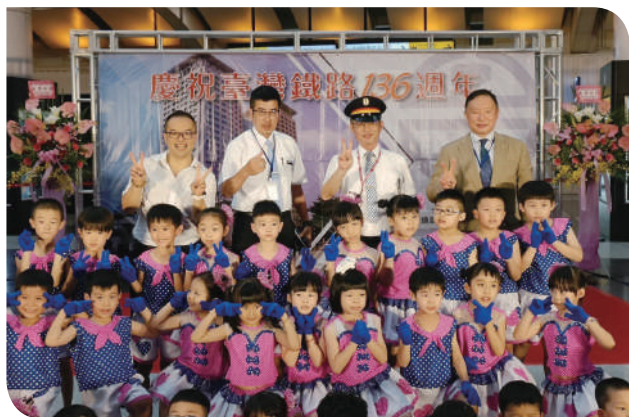
▲培幼文教機構旗下雙語幼兒園合影

活動設有靜態展覽區，展示至今 136 年間臺灣鐵路興建時的珍貴照片，及陳列知名攝影師們捕捉下的鐵道風景，藉由多組照片令現場民眾得