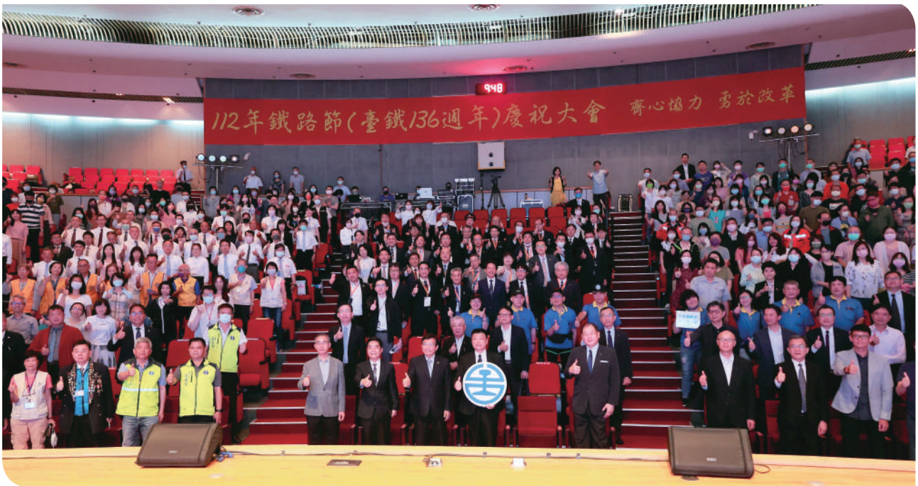
▲交通部部長王國材、臺鐵局局長杜微與臺鐵 136 週年活動貴賓合影

112年6月9日鐵路節是臺灣鐵道界最重要的日子！臺灣鐵路已邁進136年，臺鐵局特別於臺鐵大樓演藝廳舉辦「112年鐵路節(臺鐵136週年)慶祝大會」，邀請交通部王國材部長親臨大會頒獎，祝賀臺鐵136週年生日快樂，同時向長年在工作崗位上風雨無阻、努力不懈，提供國人優質運輸服務的臺鐵人致意，感謝大家無私的奉獻與付出。部長在致詞中表示，臺鐵提供優質便利民行的軌道輸運，並持續扮演公共運輸關鍵角色，因為有臺鐵團隊的努力，民眾方享有安全、便捷的服務，都市環境發展及國人生活品質得以提高。交通部將積極協助臺鐵公司化，持