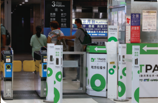
▲臺鐵局特設 TPASS 通勤月票出入口