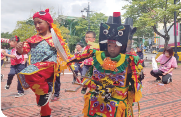
▲宜蘭國小附幼迎媽祖表演