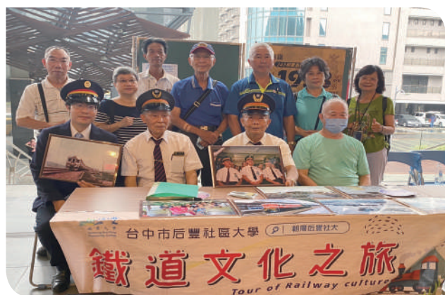
▲豐原站后豐社區大學鐵道文化之旅

彰化站也於6月4日歡慶臺鐵局136歲生日，慶祝活動由段長蘇鎮霖主持，邀請立法院黃秀芳委員、彰化縣政府柯呈枋參議、彰化縣社會處王蘭心處長、芳苑鄉林保玲鄉長、彰化市公所林世