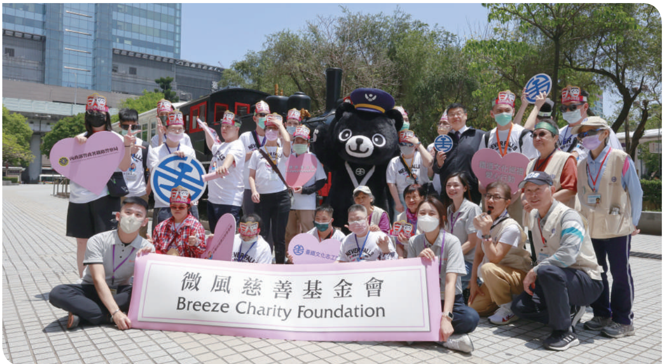
▲臺鐵文化志工、局長杜微陪伴唐寶寶體驗鐵道活動合影

臺鐵局與微風慈善基金會攜手合作，112年5月10日在臺北車站舉辦「鐵道文化巡禮」公益活動，希望透過鐵道文化的探索，讓唐氏症基金會的唐寶寶們感受不同的生活體驗。