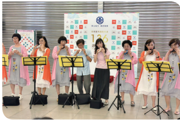
▲臺中站五權社區大學才藝表演