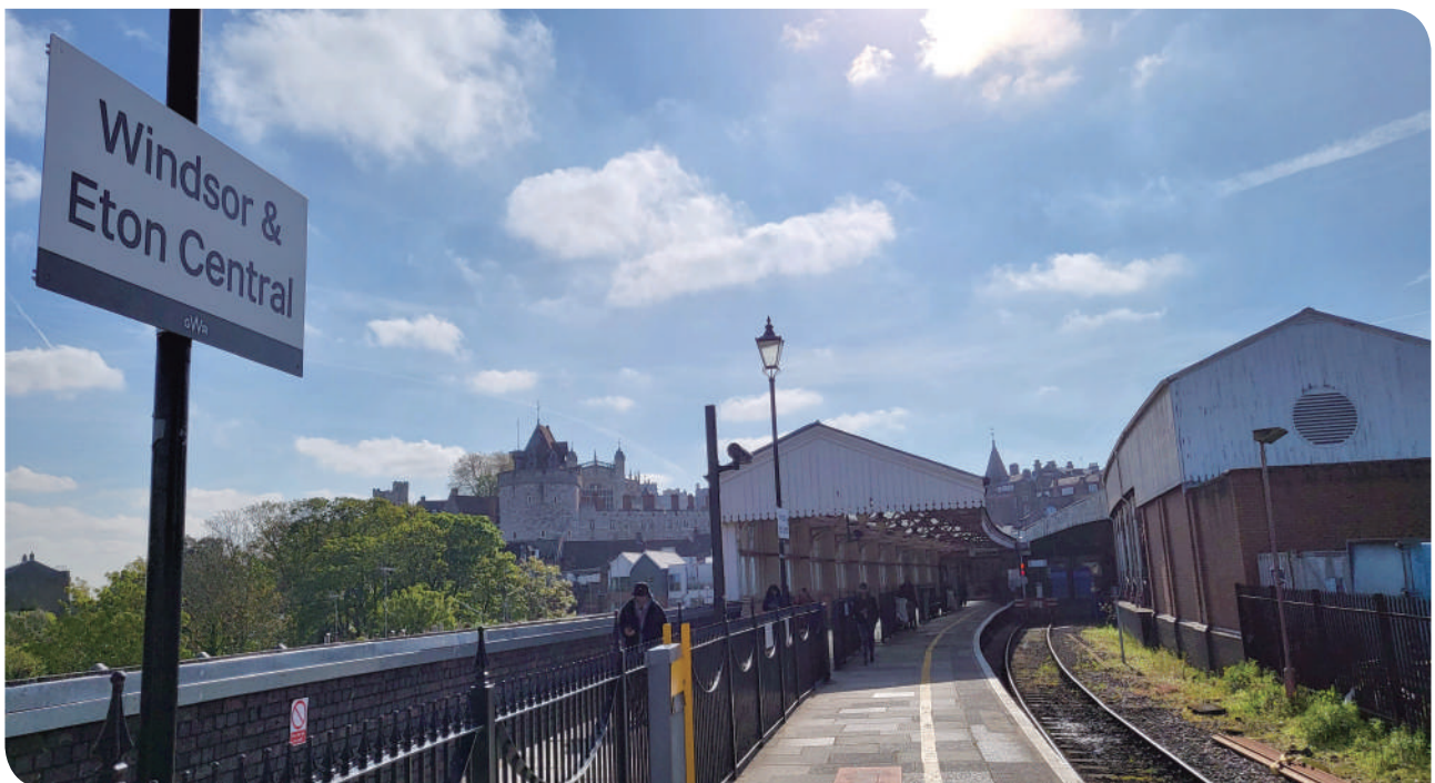
▲溫莎 - 伊頓中央車站月台

頓中央車站。本站為端點站，簡單的側式月台，並以欄杆劃設連結至停車場的走道，出站並未設驗票閘門，而是僅在入口處設置感應式驗票機，由於在英國逃票罰款很重及影響後續之信用評