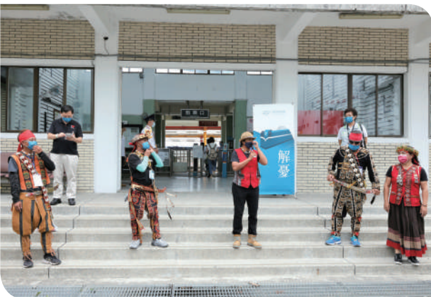
▲解憂號停靠金崙車站外原住民嚮導