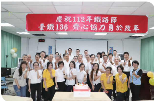
▲宜蘭運務段臺鐵136鐵路節切蛋糕慶祝

緊接著6月8日辦公室全體同仁難得穿制服上班，上午忙著佈置會場打點餐點，準備迎接貴