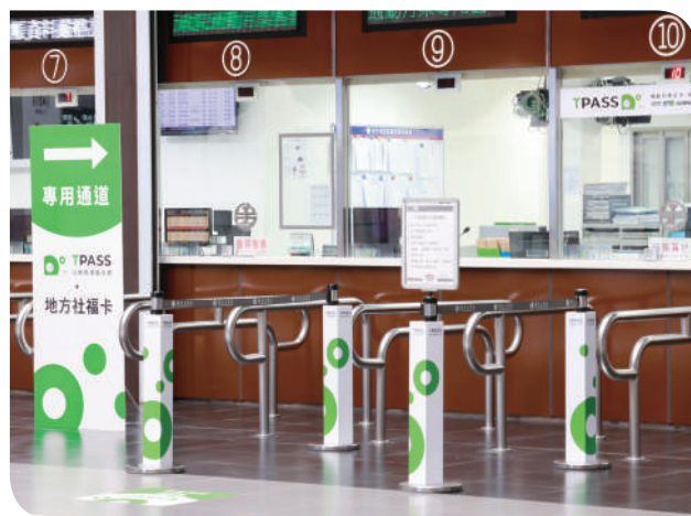
▲臺鐵局 TPASS 通勤月票申辦窗口

王部長說明，通勤月票第一階段先以北中南三大生活圈為主，涵蓋 11 個縣市及 7 種不同的運具，包括鐵路、捷運、輕軌、公路客運、市區公車、渡輪、公共自行車，讓通勤族可以用優惠的價格，在多元的公共運輸工具中選擇使用。其他生活圈或縣市也已經陸續籌劃月票方案，後續