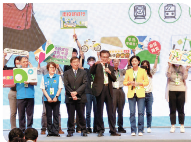
▲中部各縣市政府推出通勤月票宣導

交通部最後表示，三大生活圈通勤月票包含基北北桃 1,200 元、中彰投苗 999 元、南高屏 999 元，另外部分縣市也有推出縣市內通勤月票方案，民眾可依本身通勤需求自由選擇購買。另外通勤月票方案除了可以使用原有票證卡片直接購買外，也可以購買本次特別設計的 TPASS 統一票證卡片（每張 100 元，完成記名程序可退款 100 元），詳細月票購買方式及使用規定民眾可