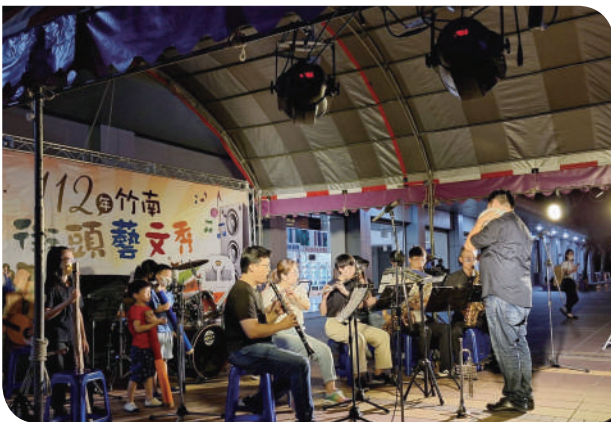
▲竹南站竹南鎮管絃樂團演奏