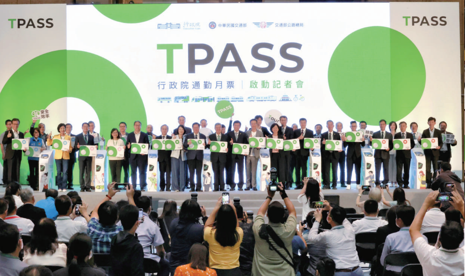
▲行政院院長陳建仁、副院長鄭文燦、交通部部長王國材、臺鐵局局長杜微與各縣市政府及相關業者活動合影

7月1日上路，院長除了肯定交通部的努力之外，也期勉交通部持續與地方政府合作，擴大推動各地通勤月票，展現政府推廣公共運輸的目標與決心，讓民眾可以更方便、更自由選擇搭乘公共運輸。