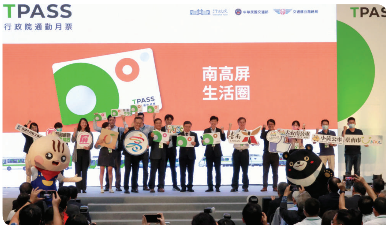
▲南高屏各縣市政府推出通勤月票宣導

通勤月票措施，藉以減輕通勤族群交通負擔及促進公共運輸使用，對於北中南三大生活圈月票於