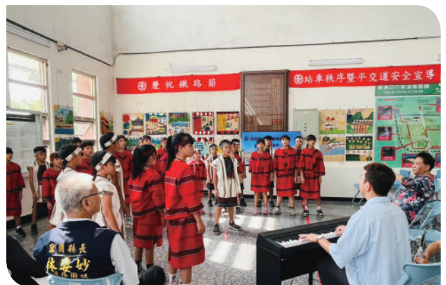
▲東澳車站內東澳國小原住民合唱