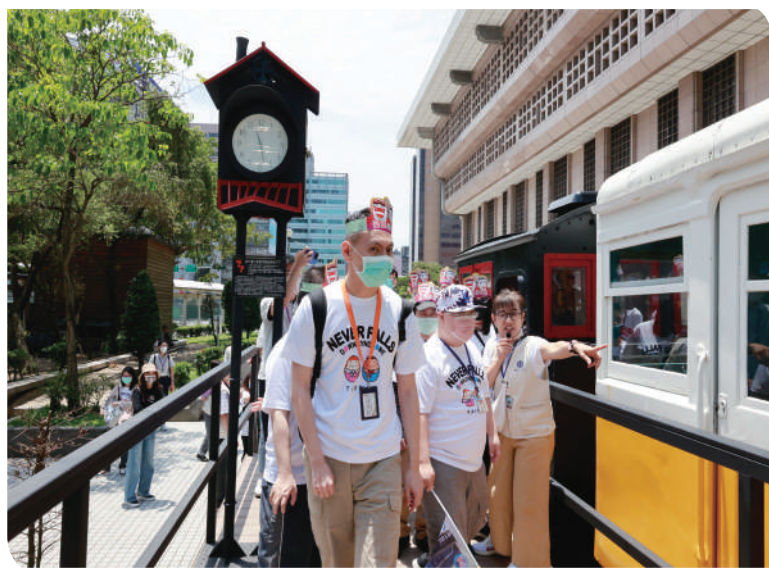
▲臺鐵文化志意向唐寶寶介紹展示 LDK58 蒸汽機車頭及 LDR2201 柴油客車