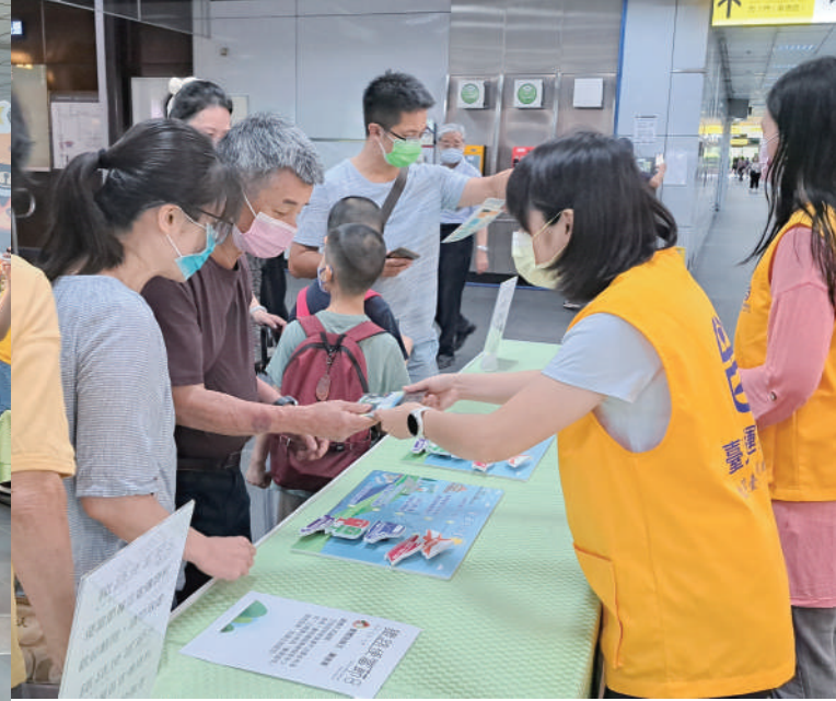
▲親子檔聯手挑戰「誠信好好玩」展區「誠信拼圖趣」互動遊戲。

臺鐵的刻板印象已經有慢慢改變，以及表達支持公司化，認為往後應更有效率效能，顯示臺鐵局於轉型改革付出之努力，已讓外界看見並肯定。