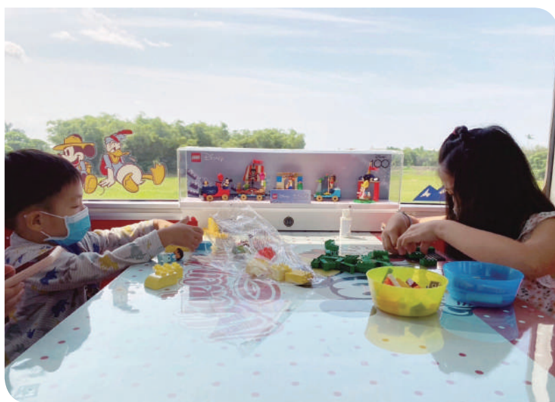
▲ 列車上小朋友盡興組立樂高積木遊戲

系列商品外，7月2日前還可參加「樂高®創意拼拼樂」自由拼砌體驗活動，讓大小朋友發揮創意拼砌屬於自己的夢幻城堡，作品完成後上傳至個人社群並寫下指定hashtag，即可獲得樂高贈禮兌換券(需於指定店家購買LEGO®Disney100週年系列商品方可兌換)。藉著在列車上拼砌樂高，小朋友發揮創意，大朋友釋放童心，一起在迪士尼與樂高的陪伴下留下最美好的旅行回憶。