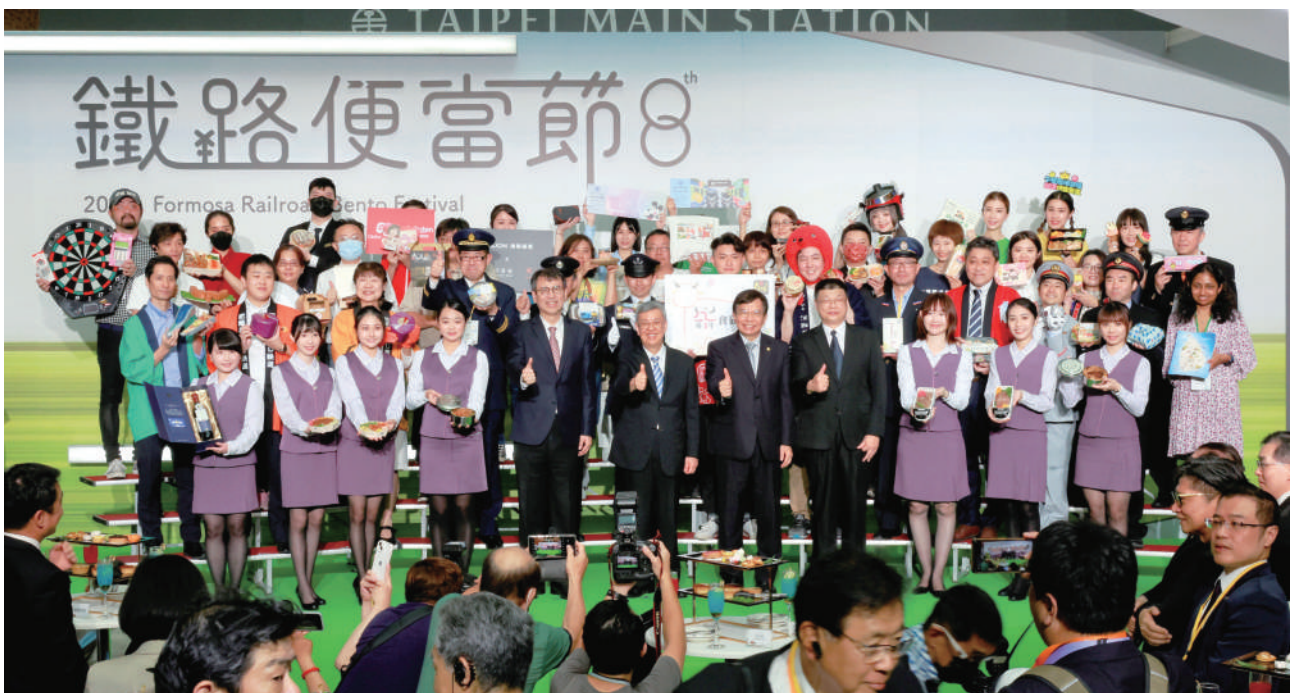
▲行政院院長陳建仁、發言人林子倫、交通部部長王國材、局長杜微暨參展單位合影

行政院陳建仁院長 6 月 9 日親臨臺北車站 1 樓多功能展演廳為 2023 第 8 屆鐵路便當節揭開活動序幕，院長表示，本屆鐵路便當節活動從（6 月 9 日 - 6 月 12 日）結束，為期 4 天，包括日本 12 家鐵道同業、斯里蘭卡鐵道同業、國內各地方政府機關、國內便當、文創、旅遊、百貨業者等共同參與，創下歷年來參與業者家數最多的紀錄。而此次鐵路便當節的主題為「啟程 · 享食 · 永續」，以綠色鐵道旅遊響應減碳旅遊模式，並挑選具「海洋之心生態標章」認證的在地國產海鮮食材入菜，也呼應聯合國 17 項永續發展目標（SDGs），並盼明（2024）年 1 月臺灣鐵路管理局公司化後，能夠健全國營鐵路