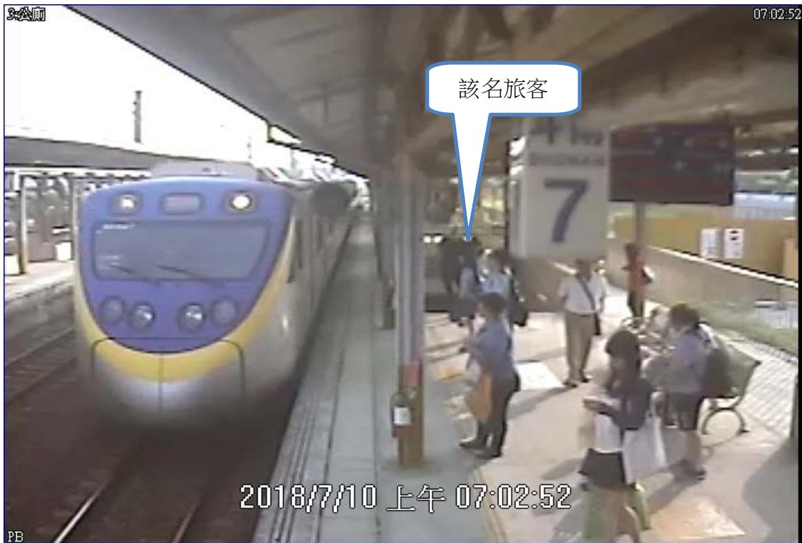
圖一、第2303次車進站時旅客在月台候車情形