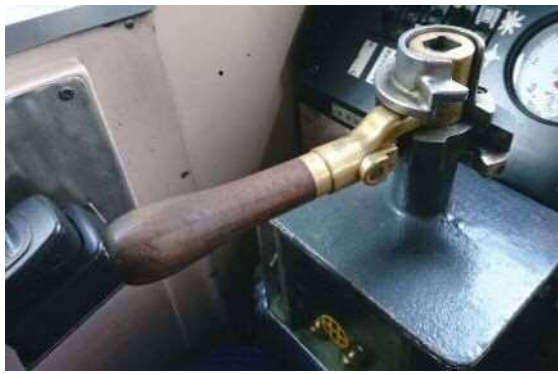
▲柴聯自強號司軔閥把手