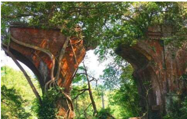
▲遠眺雄偉的龍騰斷橋遺址

慢遊在舊山線，隨處都能發現讓人驚呼連連的美景與秘境，若是餓了，周邊也有許多客家美食可以大快朵頤一番，實在是非常值得全家大小一同出遊休憩的好景點。