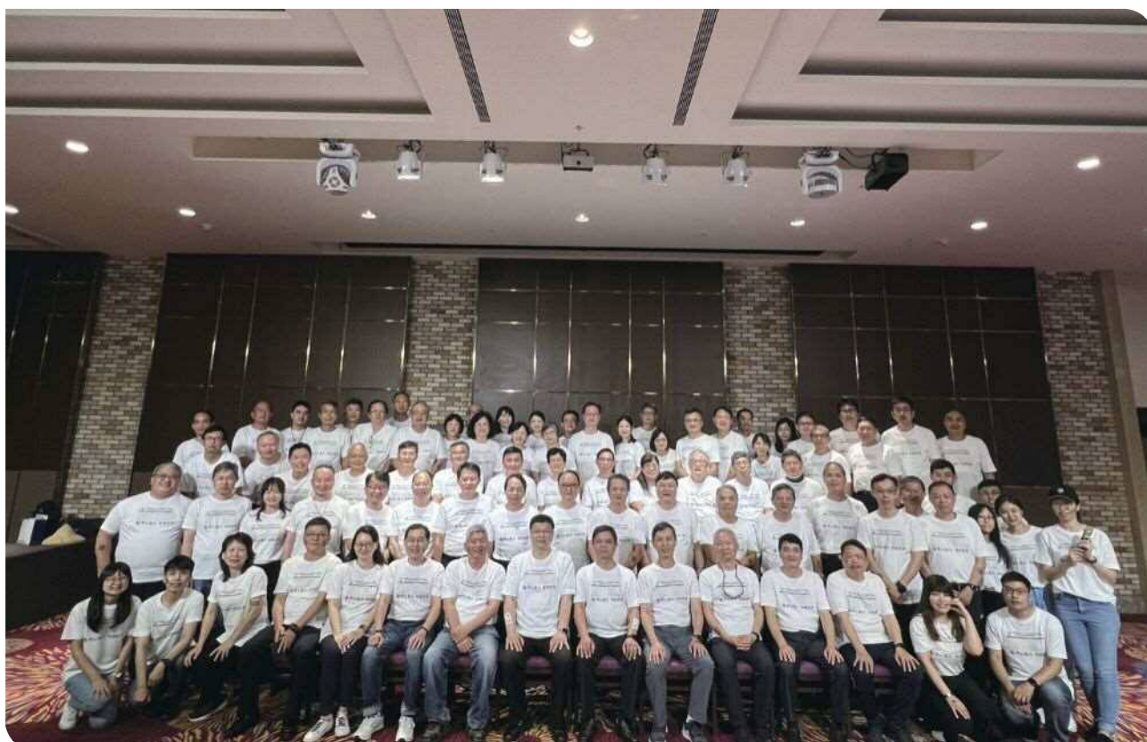
▲參與 112 年臺鐵局主管共識營全體人員合影

完成本次共識營重頭戲後，一行人又風塵僕僕地踏上自行車，騎返於玉里站，貼心的站方人員為慰勞主管們烈日下的辛勞，特意準備光復糖廠名物 - 枝仔冰緩解酷熱，那透心涼的消暑聖品也讓旅途增添一抹甜蜜，隨後並前往瑞穗天合飯店舉行人事室及企劃處的兩項簡報座談會。座談會中人事室與企畫處交替向主管們簡報目前公司化推動進度及未來人事組織，冀以透過座談會之討論，可從上至下傳遞公司化後員工們深切期盼