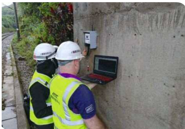
▲電子輔助瞭望員 - 安裝及測試

臺鐵局已擇 7 處臨軌工程試辦電子輔助瞭望員，並陸續於 111 年底完成測試設置，後續將制定相關標準作業程序，逐步導入臨軌工程，期能降低鐵路工程之風險性，以確保臨軌作業及旅客搭乘鐵路之安全。