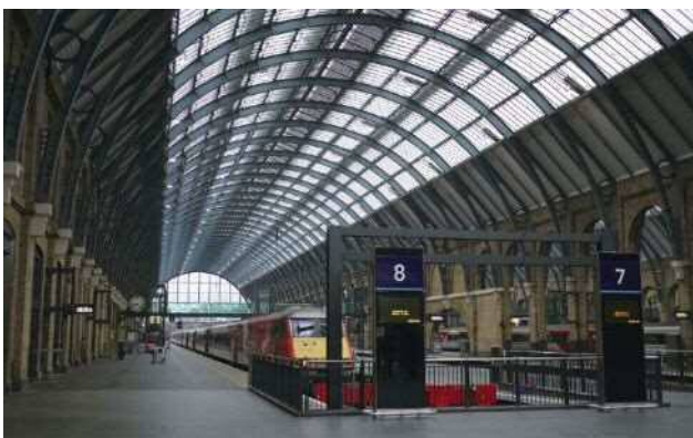
▲國王十字車站半拱型樓頂

2000年，LCR與國王十字區的另一個土地所有者Exel集團(後於2005年被德國DHL收購)合作，找來有土地資產開發經驗豐富的開發商Argent LLP共同成立The King's Cross Central Limited Partnership(KCCLP)合夥公司，配合倫敦市政府提出的城市空間發展願景-倫敦計畫