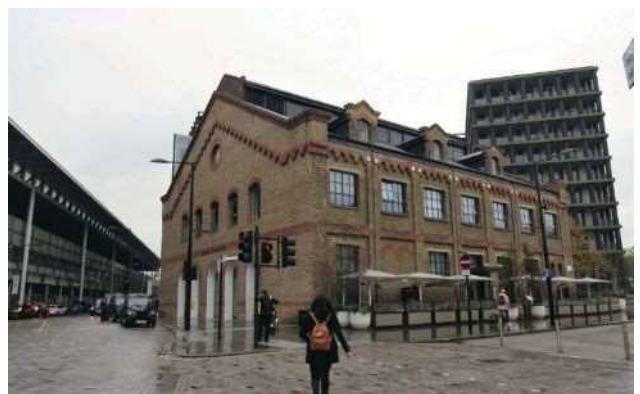
▲前身為倉庫的建物，改造後，已進駐多家餐廳