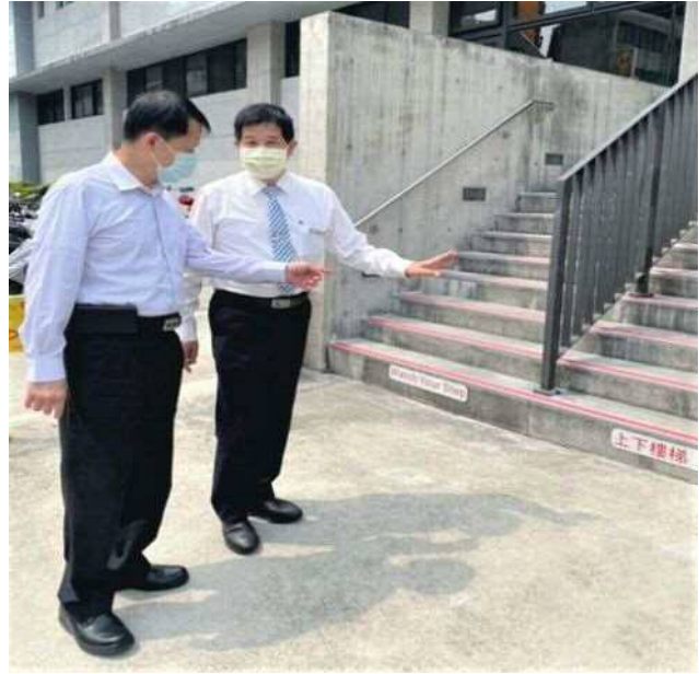
▲督導臺北車班關心同仁出入辦公室安全

原因是工務及電務後勤單位，隨著時代演進增添很多新設備及新任務，以致無法以現有人力達到類似北捷的強力後勤支援能量，或許也因此遭外界認為本局橫向聯繫不周。