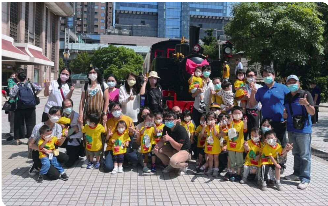
▲家長老師參與孩子親子活動