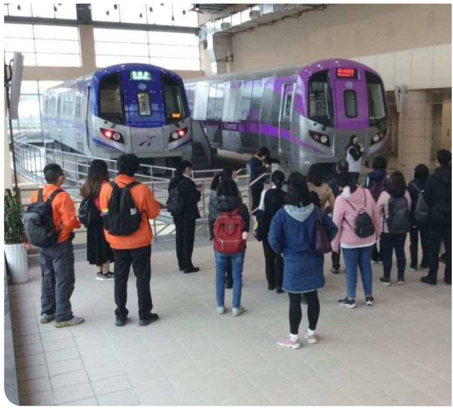
▲桃園捷運公司行控中心大樓擺放捷運車廂

到中壢車站。由此可知，整體交通建設除軟、硬設備提升外，前瞻性相關規劃也必須一併納入妥善考量。