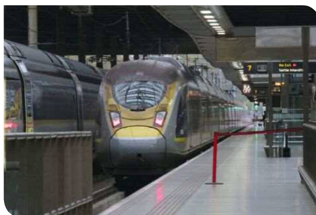
▲停靠於聖潘克拉斯車站的歐洲之星列車

倫敦國王十字車站連同僅隔一條街的聖潘克拉斯火車站（St Pancras International station）是英國最大的交通轉運站，地鐵、火車、跨國的歐洲之星匯集在此站，也是倫敦市內最多地鐵路線交會的車站，在爆發 Covid-19 疫情前，進