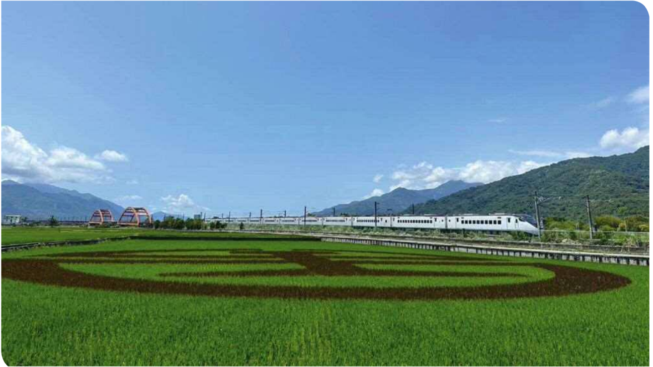
▲ EMU3000 自強號行經玉里臺鐵 logo 彩繪稻田美景

112 年臺鐵局主管共識營選定於好山好水的東臺灣玉里 - 瑞穗兩地舉辦，伴隨著東部延綿不絕的稻浪，當列車行經玉里、富里路段時，即可望見百年老店臺鐵的局徽映入眼前。