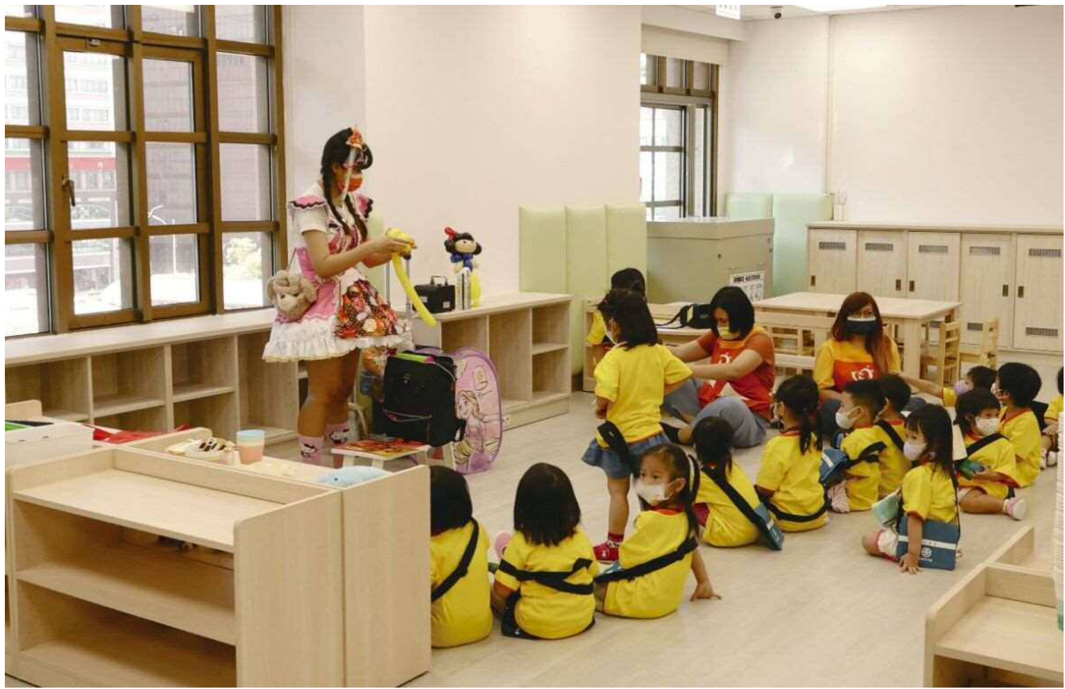
▲老師以氣球製作趣味造形分享學童

臺鐵局委託優質非營利法人「社團法人臺灣兒童教育發展協會」、「財團法人聖母醫護管理專科學校」辦理，收托 2-6 歲幼兒總計 70 名，學費比照非營利幼兒園收費規定，每月 2,000 元，以臺鐵局、與臺鐵局簽訂聯合提供教保服務契約機關員工之子女、孫子女為優先申請對象，餘額則對外開放。