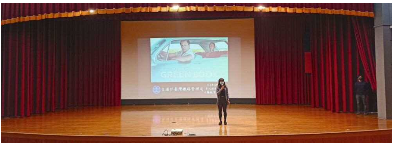
▲人事室介紹《幸福綠皮書》這部經典電影

臺灣住民從最早的原住民、相繼移民而來的閩南人、客家人、外省人，以至今外籍配偶等，不但包容原住民文化，也包容華人不同族群的文化和東南亞文化，形成多元文化的社會。本局人事室為了推廣多元族群文化及人權教育，特別於112年3月20日舉辦本次教育訓練，期望達到建立同仁促進多元族群融合的觀念。