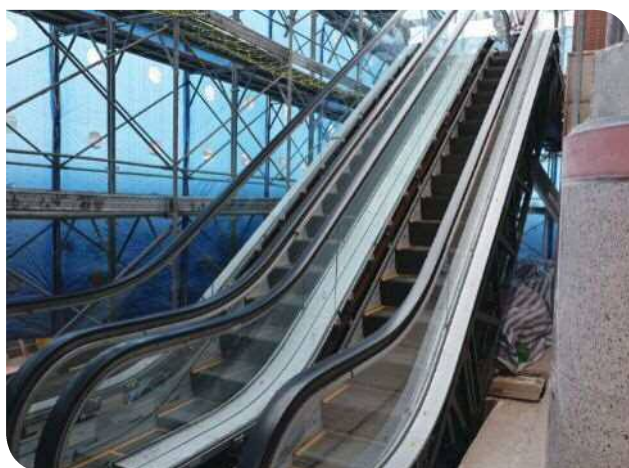
▲鶯歌車站增設電扶梯工程

工程經費約1.3億元，於車站前後站與1、2月台等4處增設共12部電扶梯，並配合鶯歌當地文化意象導入車站美學，同時改善候車空間，以因應高齡化社會年長者需求及提昇行動不便旅客轉乘便利性，及提供更舒適友善便利的搭乘環