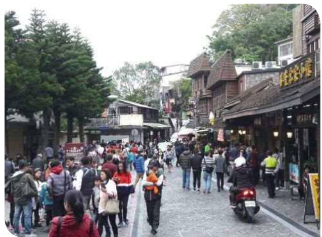
▲舊山線鐵道著名景點勝興車站

位於三義這座景色怡人山城內的舊山線路段，是具有百年歷史的鐵道，其間有著數不勝數的鐵路建築，而沿線經由臺鐵與苗栗縣地方政府及民間業者多年的合作，已打造出一個充滿鐵道