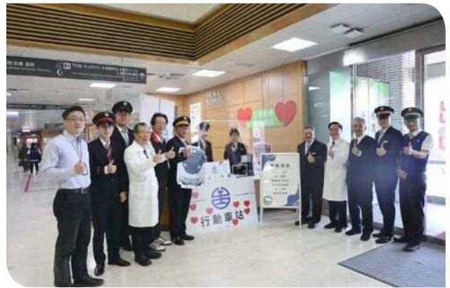
▲臺鐵於花蓮慈濟醫院設立「臺鐵行動車站」窗口

統不能透過一般無線網路運作，要在醫院架設一個功能齊全的車站窗口，並不容易；為解決網路與個資保護等問題，花蓮車站特別協請中華電信協助，在符合法律規範的情況下，順利完成了設備與網路架設。花蓮慈院院長林欣榮表示，感謝花蓮車站積極尋求各方合作，造福許多病人、家屬以及花蓮慈院同仁，院方也會全力支持這份為花蓮鄉親服務的心意。