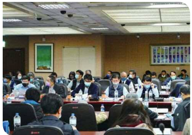
▲智慧鐵道資訊整合平台專家學者座談會出席各界代表

局長表示，「智慧鐵道資訊整合平台」為臺鐵數位轉型核心重點項目，因應組織轉型在即，系統規劃建置更應配合公司化推動進程，成立專案管理辦公室，親自帶領各單位加速推動數位化與智慧化的發展，擘劃臺鐵未來智慧鐵道發展藍圖，運用數位科技優化營運流程、決策，並提升服務價值，以達成安全、可靠及效率之各項願景目標。