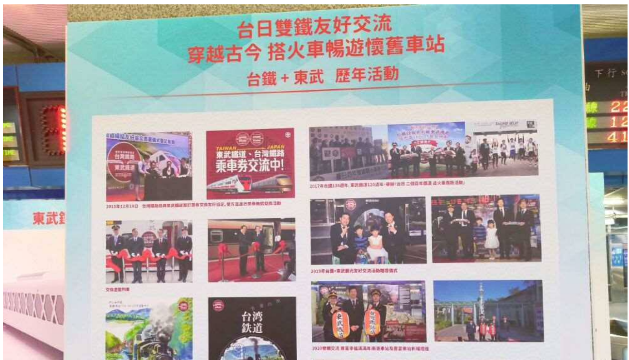
▲臺鐵局、日本東武鐵道歷年活動看板