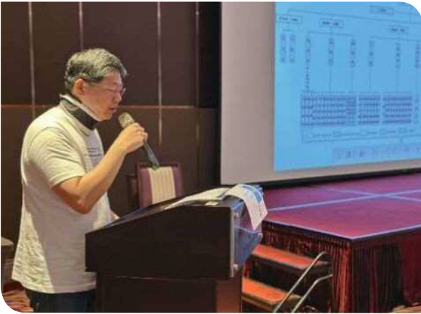
▲人事室主任臺鐵公司化組織架構簡報