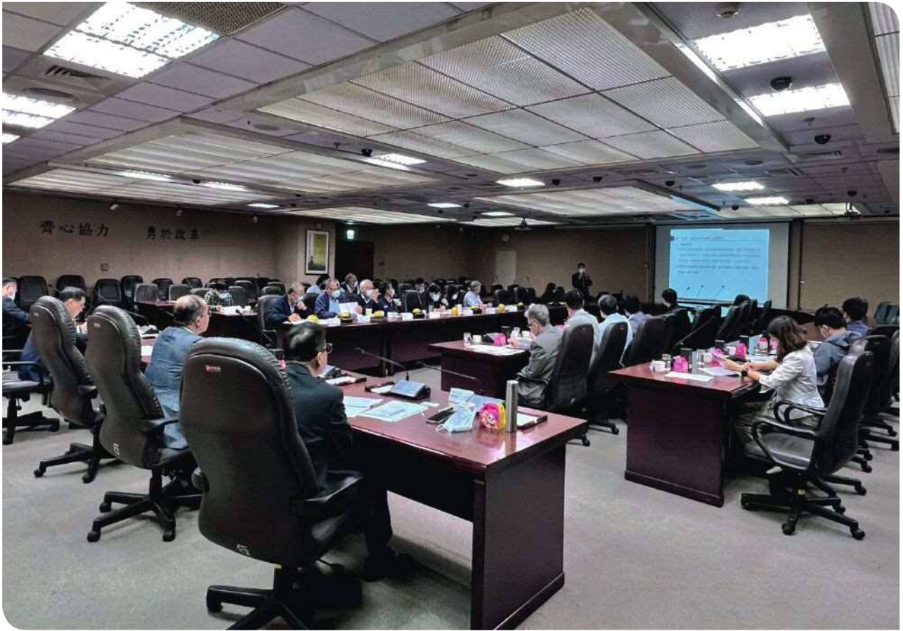
▲臺鐵局與鐵研中心加強技術交流合作研討會場

臺鐵局特別感謝鐵研中心諸多協助，更期許透過鐵研中心努力，爭取雙方各類技術或產品的驗證認可、授權，攜手在互信與合作的平台，讓