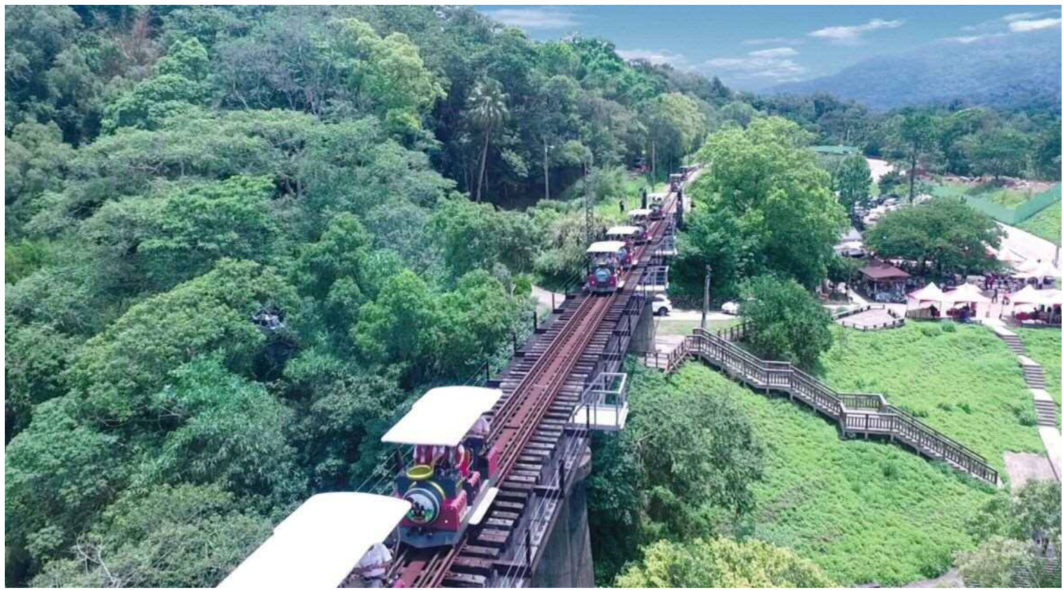
▲軌道自行車行經二代魚藤坪鐵橋