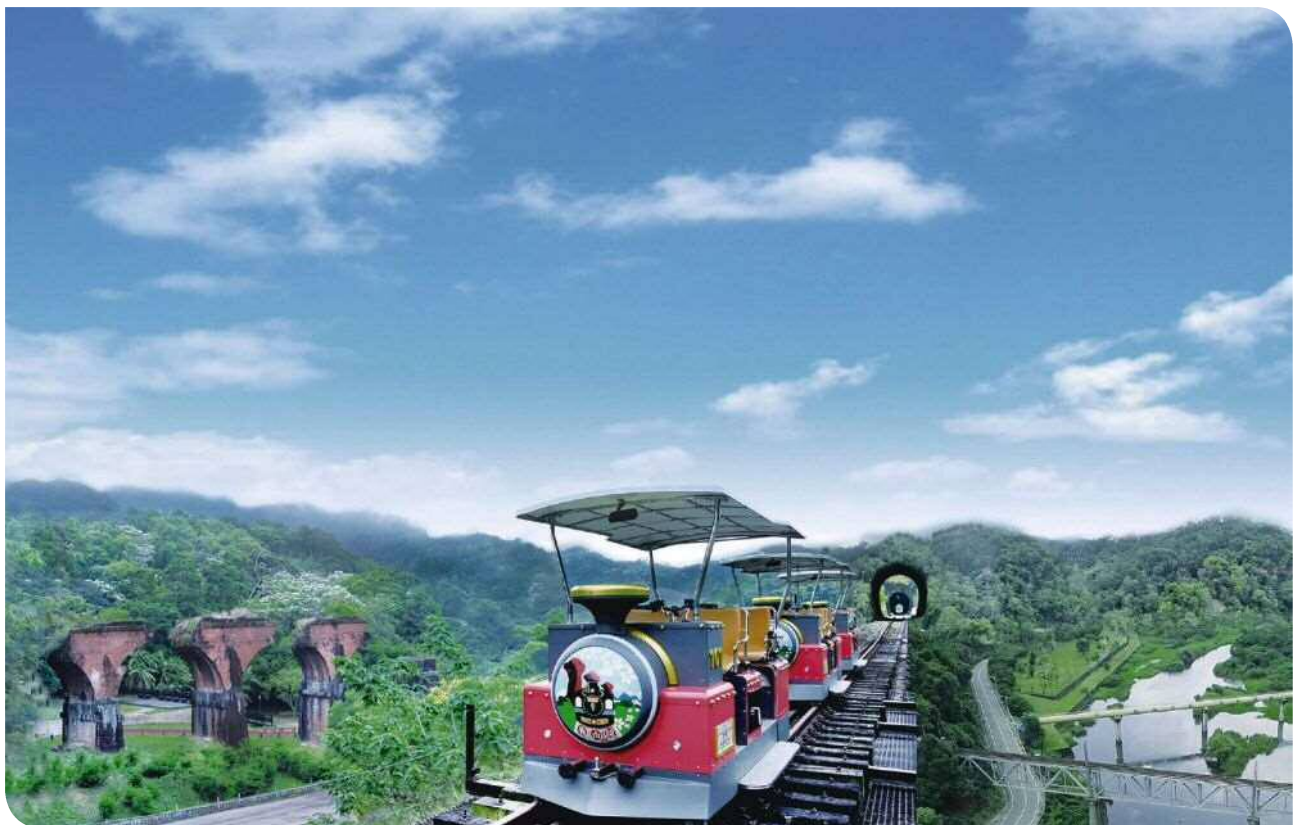
▲舊山線軌道自行車