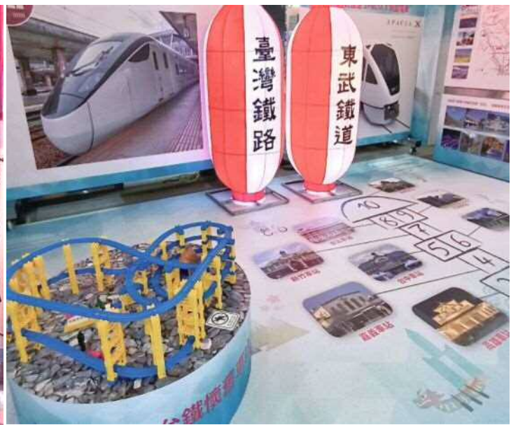
▲臺日雙鐵友好大樹燈座贈燈展區

繼上次「搭鐵道暢遊臺日雙鐵沿線名勝鐵道周遊地圖遊戲」地貼供遊客現場玩樂，這次更新為「穿越古今 搭火車暢遊臺日雙鐵懷舊車站之旅的跳房子遊戲圖」，地貼跳房子遊戲是將臺日雙鐵沿線的代表車站景點放入圖中，從遊戲中認識及欣賞臺日各名勝景點。