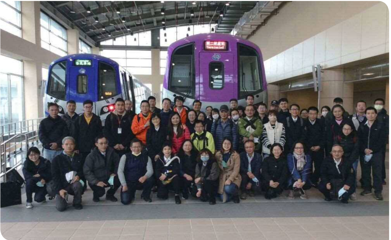
▲宜蘭運務段參訪人員於桃園捷運公司捷運車廂前合影

為因應本局公司化在即，由宜蘭運務段在2023年3月2日主辦宜蘭地區「標竿學習—桃園捷運公司」教育訓練，偕同宜蘭工務段、宜蘭機務分段及宜蘭電力段等員工51人一同參訪桃園捷運公司。