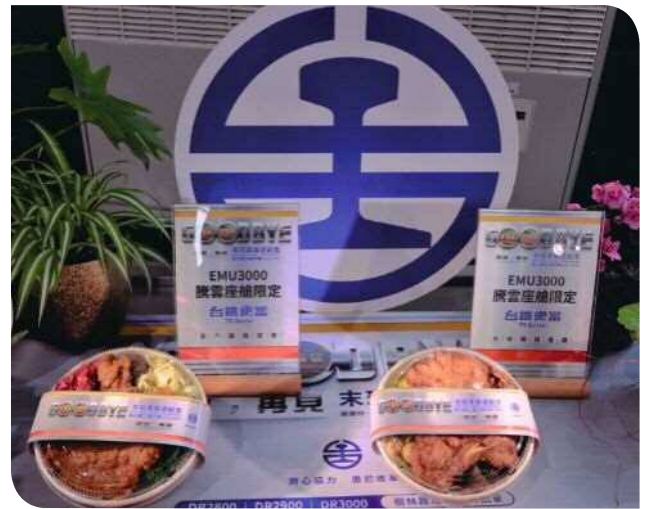
▲隨車發售騰雲座艙限定台鐵便當

樹林車站台鐵便當店、兩列紀念列車及花蓮夢工場限量販售 1 日快閃限時限量的「騰雲座艙