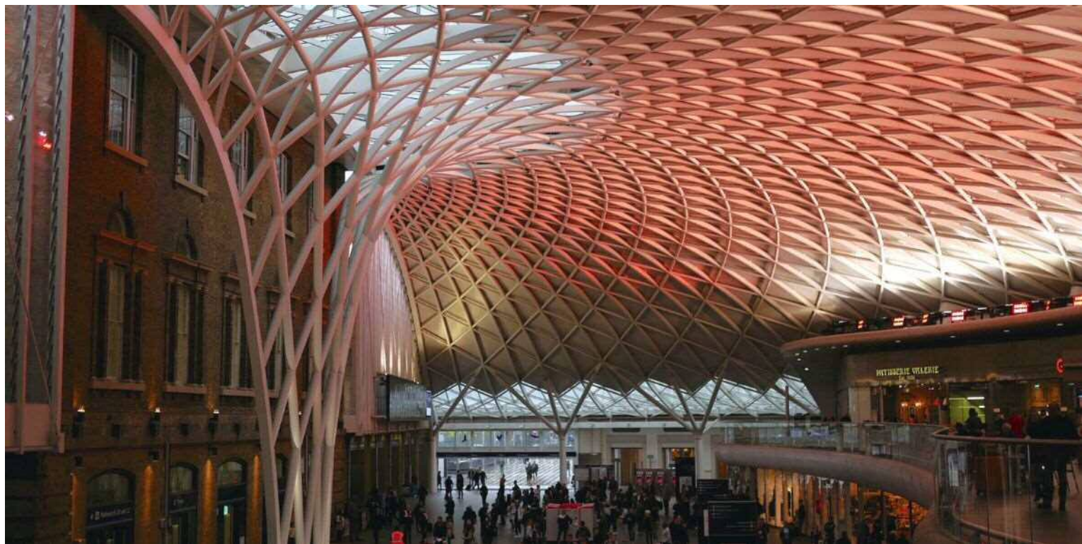
▲國王十字車站融合舊建物的新造半圓形候車大廳

(London Plan)，將國王十字車站周遭腹地劃定為重點開發區，透過都市再生後的土地混合使用，該區域蛻變為全新的商業、住宅和公共空間。