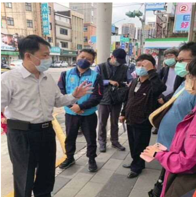
▲現勘埔心站站前人行路面及車道損壞修復工程