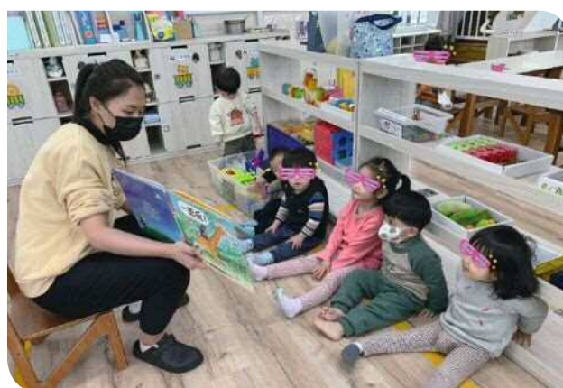
▲繪本童書故事朗讀豐富幼兒的生活

為配合政府 0-6 歲國家一起養政策目標，臺鐵局積極響應推動公共化托育設施，歷時一年多的規劃及籌備，於臺灣鐵路工會、臺鐵局職福會及各單位協力積極推動下，分別成立「交通部臺灣鐵路管理局臺北車站職場互助教保服務中心」及「交通部臺灣鐵路管理局宜蘭職場互助教保服務中心」，並於 111 年 8 月 15 日、111 年 8 月 30 日正式提供教保服務。