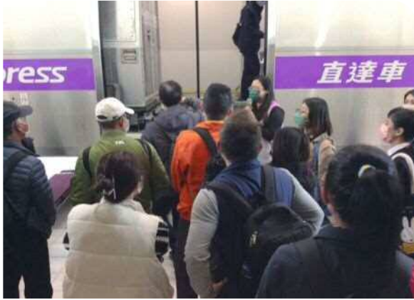
▲參訪試乘桃園捷運公司捷運車廂