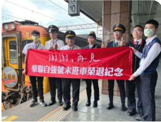
▲花蓮車站柴聯自強號榮退末班車紀念