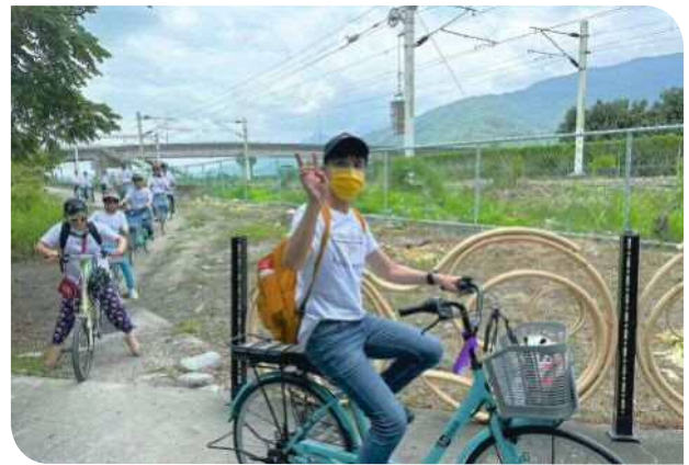
▲與會同仁體驗自行車車道漫遊

共識營行程尾端，趁著乘車前的短暫時刻，參觀了飯店相關設施及服務，也藉機學習五星級飯店服務之流程及配套，收穫滿滿的主管們，就在瑞穗輕鬆及愉快的氛圍下，踏上北返的列車，結束這一天既充實又愉快的行程。