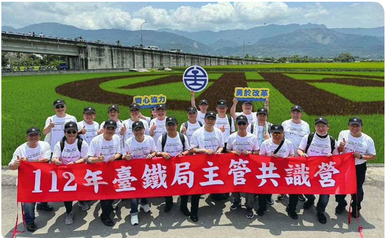
▲共識營一級主管於玉里臺鐵 logo 彩繪稻田宣示「齊心協力 勇於改革」合影