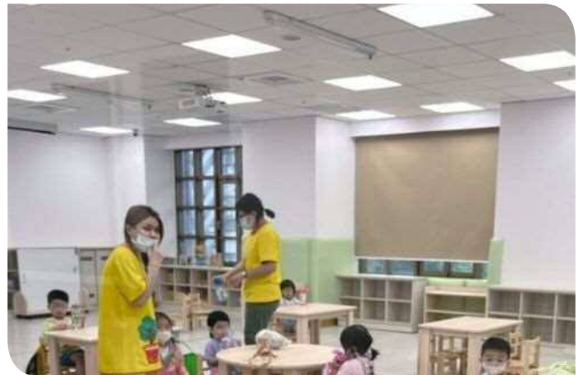
▲教保中心老師與幼兒教學互動

另為精進教學品質及瞭解員工、家長對職場教保中心提供托育服務滿意度，臺鐵局分別依照職場教保中心老師與親子互動度、課程安排是否豐富幼兒的生活經驗、教學課程是否養成幼兒良好的生活自理習慣等項目做問卷滿意度調查；員工、家長滿意度高達 94 分以上，其中以教職員對家長及孩童態度溫和友善、能即時回報孩童在職場教保中心的飲食與健康情形、提供孩童學習資料讓家長有疑問時可以溝通討論並提供具體的