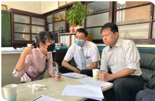
▲前往督導新竹站、新竹車班及了解新竹古蹟鐘塔案

缺乏，甚至面臨整合運、工、機、電各段指揮權不足的困境，這些就是以後分區營運處必須特別留意的地方。以協調中心目前的角色功能來看，在有限人力資源之下，實無法推動太多事務；另一面向是如果強行推動時，嚴重一點都可能影響