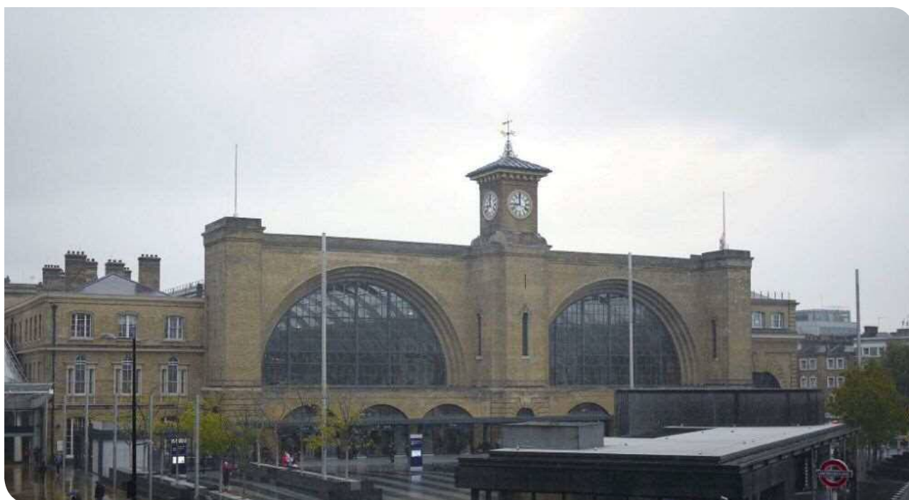
▲英國倫敦國王十字站

出該站的國際線旅客每年已經超過 3,400 萬人次（日均運量約 9.5 萬人次），從這站搭乘倫敦地鐵的旅客每年更高達 8,800 萬人次（日均運量約 24 萬人次）。