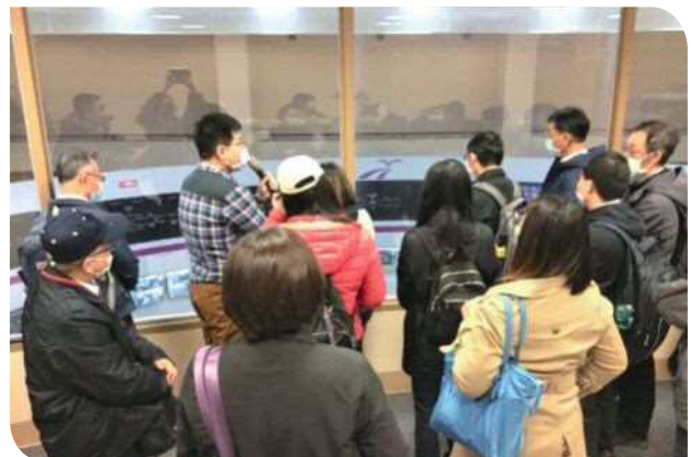
▲參訪桃園捷運公司行控中心

綜上所述，雖然臺鐵公司化各界都有不同的聲音，本局的同仁工作上也勢必會更具挑戰性。但大勢已定，如果能讓臺鐵這個百年招牌擦拭光亮，組織再造煥然一新，期盼臺鐵全體員工上下齊心協力勇於改革，也衷心祈願臺鐵公司化順利成功，「贏」向嶄新的未來。