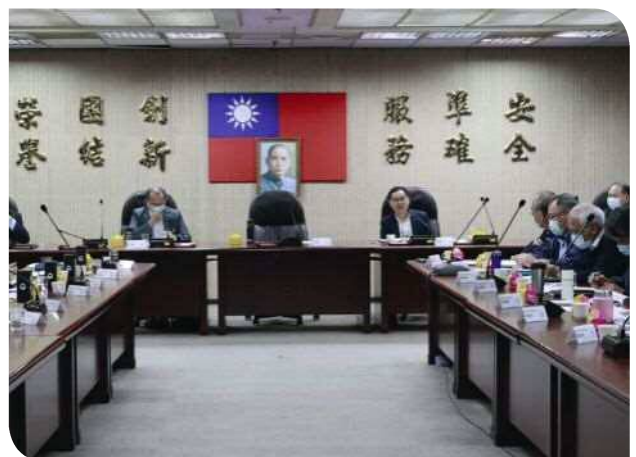
▲臺鐵局副局長馮輝昇致詞

外在異物與環境因素對行車安全的影響等，進行討論與交流。希望藉鐵研中心的共同參與協助，提升鐵路運輸系統的可靠性。