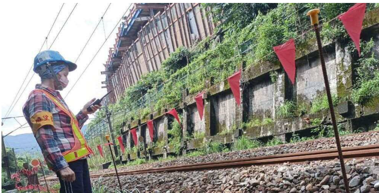
▲邊坡工程施工指派瞭望員監視

臺鐵局身負鐵路運輸之重責，惟在鐵路運輸不中斷之前提及高風險環境下，辦理臨軌鐵路工程實為不易之工作，臺鐵局自 408 次列車事故後，積極就各領域落實安全管理改革，引進電子輔助瞭望員機制，即為其中一項重要改革。