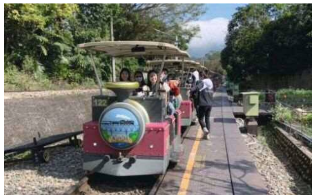
▲乘坐舊山線軌道自行車旅遊旅客