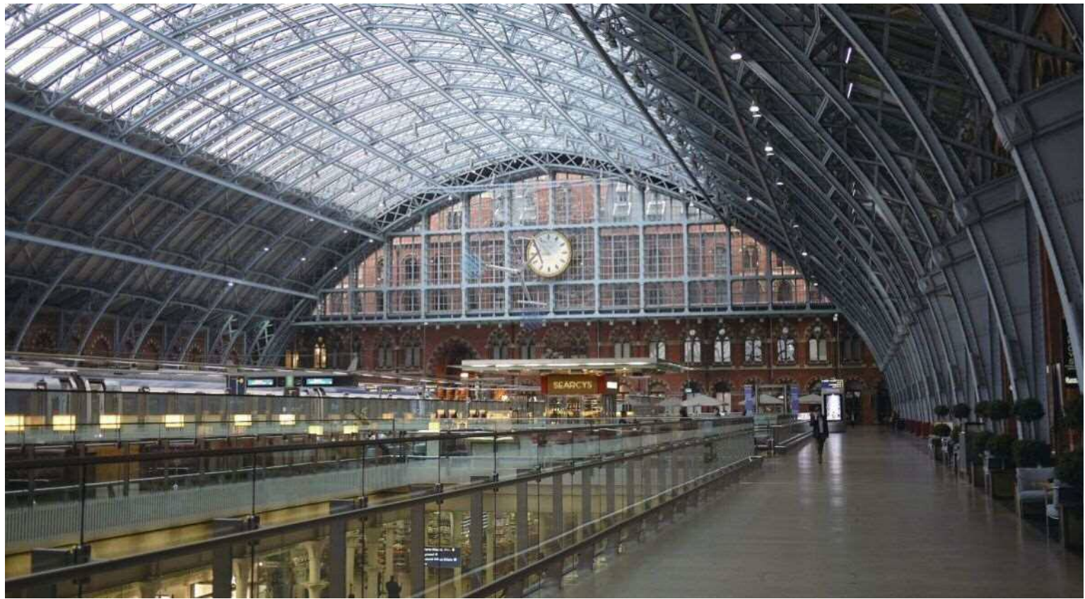
▲重新翻修的聖潘克拉斯車站

早期因工業衰退的影響，國王十字車站周遭的鐵路運輸和工廠設施，長期疏於管理，堆置煤貨的礦場、倉庫被閒置，環境雜亂不堪，衍生出不少治安及都市形象問題，國王十字區還曾被列為「倫敦十大貧民窟」之一。直到上世紀的90年代，英國政府推動英國國鐵私有化，1996年英法海底隧道開通，開駛連通歐洲大陸的歐洲之星國際列車，車站所在的國王十字區開始啟動再造計畫，成為車站重生以及都市更新的關鍵轉折。