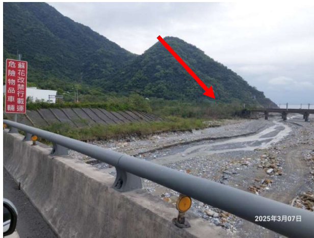
圖三：本標的由臺鐵公司高架鐵路下方穿越