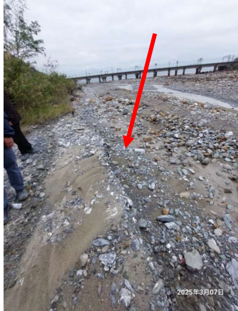
圖二：通往本標的通道已坍塌，無法前往