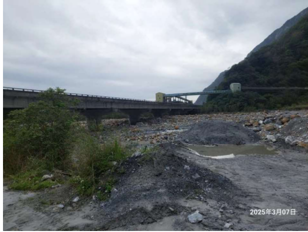
圖一：通往標的須經過河床地，路途險峻