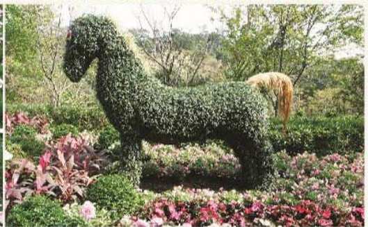
粉紫色的繡球花，與桃紅色的杜鵑花互相爭豔。 Light-purple hydrangea and magenta azalea.