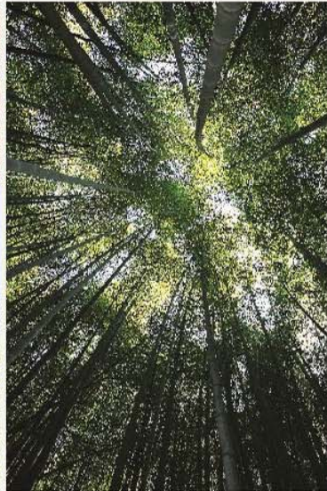
石棹可見茂密的孟宗竹林，筆直挺立。 Moso bamboos in Shizuo.