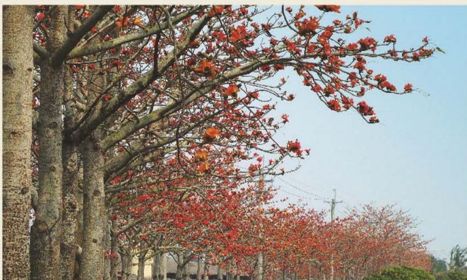
台南白河林初埤的木棉道在春季熱情如火地綻放。