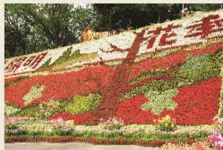
陽明山春季花卉繽紛亮麗，遊人如織。