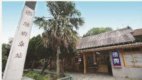
勝興車站以木頭為建材，建築相當獨特。 The unique wooden structure of Sheng Hsing Station.