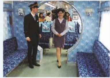
「進化 1001 號」以天空藍為主色調，車廂內的壁紙也印上外星人。

在暑假期間，從新竹到基隆及彰化，沿途徵才；此外，也曾作為民眾結婚專車使用。在 103 年 1 月，這輛專車更化身為「淨空檢查車」，驗證了花東鐵路電氣化完工的里程碑。同年年底，因為旅遊風氣的盛行，支線列車調度吃緊，DSC1001 進行改裝，撤掉了會議功能及設備。從「局長行政專車」名稱和功能的轉變，似乎也看到了台灣在民國 80 至 90 年代社會的脈動。