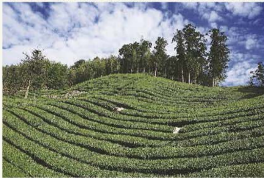
石棹茶園生產品質優異的高山茶。 High quality mountain tea produced at a Shizuo tea plantation.