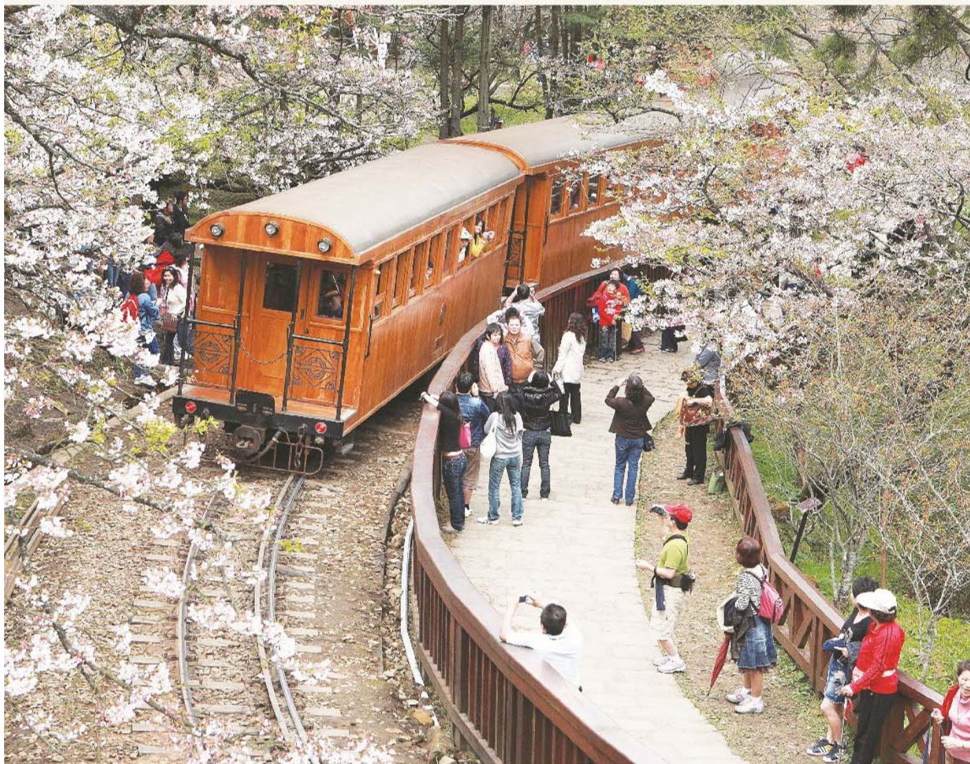
搭乘森林小火車穿越櫻花林，充滿浪漫氛圍。 A romantic ride on the Alishan Forest Railway through cherry blossom country.