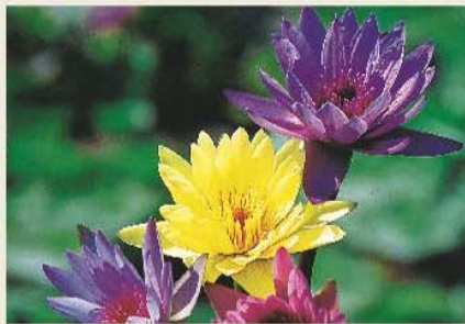
花蓮吉安의 蓮城蓮花園有許多品種的香水蓮。

種苗繁殖改良場和當地休閒農場規劃的花田景觀，每個時節都有新鮮事！搭乘台鐵至豐原站下車，轉搭豐原客運至新社，一路上只見花海嬌迎遊人、山徑綻放芳華。行至彰化員林火車站，轉乘員林客運到田尾公路花園，欣賞各式切花和園藝盆栽，尤以菊花為大宗，上百家花卉批發業者讓人目不暇給。中部知名的集集小火車深入台灣地理中心，出站後租輛自行車徜徉鄉間小路，鄰近的農田開放向日葵採花體驗，碩大的金黃燦爛花朵更豐富了山城記憶。