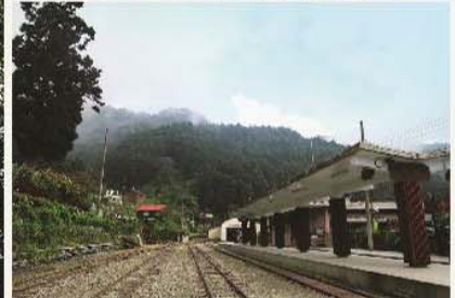
阿里山森林鐵道的中繼站—奮起湖站。 Fenchihu Station of Alishan Forest Railway covers a considerable area.