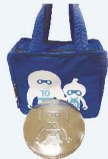
「進化 1001 號」不鏽鋼便當空盒組（含便當提袋） / 一個 350 元 共有 mr.ten 和 miss.one 兩款。