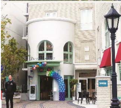
北野異人館街旁的建築充滿濃厚異國風情。