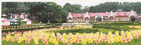
西湖渡假村強調浪漫歐風與自然休閒。 The West Lake Resortopia offers a European atmosphere both romantic and relaxing.