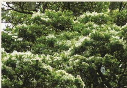
台大的流蘇花披滿樹冠，看似雪花點點。