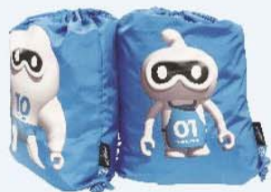
「進化 1001 號」束口背袋 / 一只 165 元， 共有 mr.ten 和 miss.one 兩款。