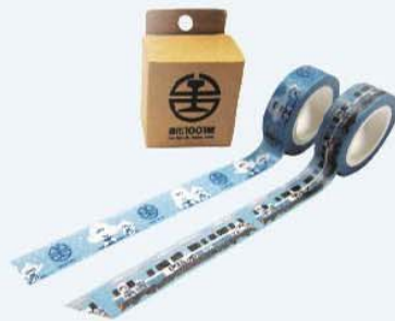
「進化 1001 號」紙膠帶組 / 一組 199 元 (2 捲)