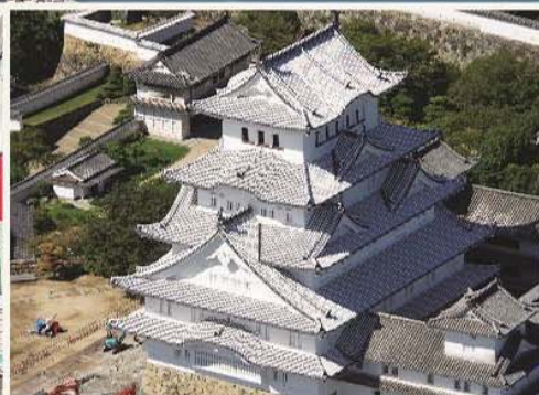
姬路城是日本名城，形態優美，別名「白鷺城」。