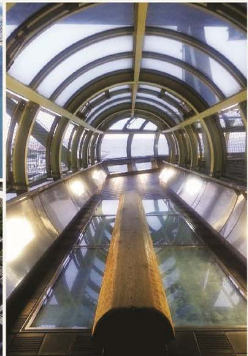
若想體驗刺激感，可踏上明石大橋觀景步道的玻璃獨木橋。