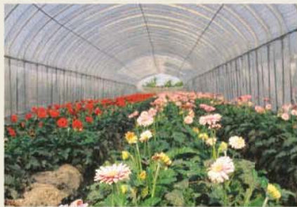
彰化田尾公路花園的花卉批發產業發達。