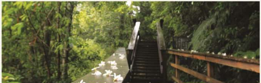
幽靜的挑柴古道，即使桐花被雨打落也頗富意境。 Tung flowers in the rain look poetic on the old timber carrier's trail.