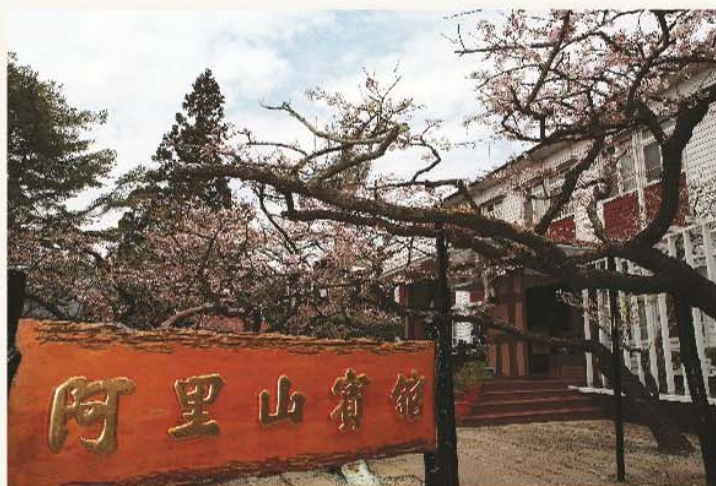
阿里山賓館前植有許多吉野櫻，花季時美不勝收。 A magnificent sight of Yoshino cherry trees in front of Alishan House.