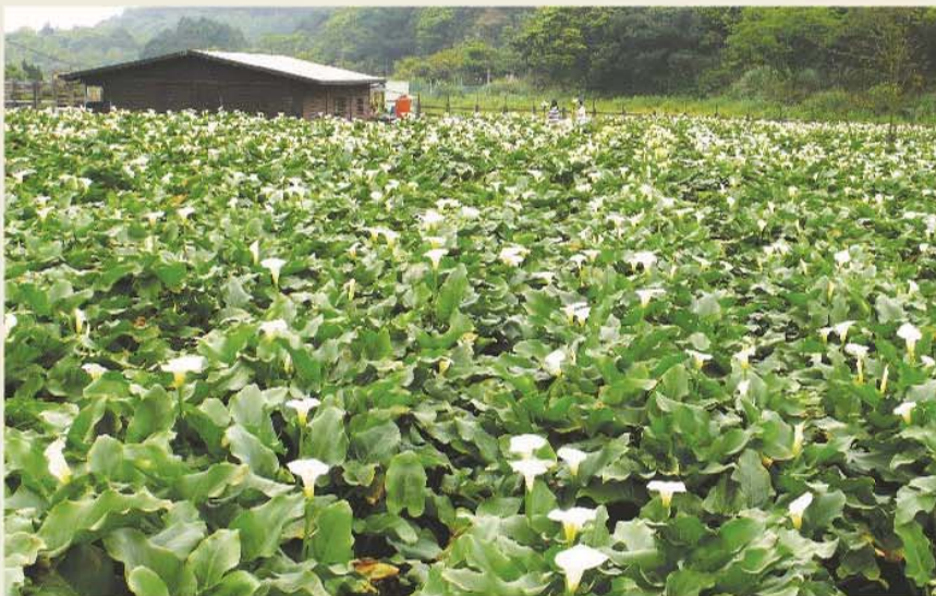
竹子湖白色海芋在一片翠綠中更顯清麗。