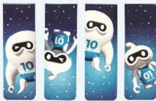
「進化 1001 號」磁鐵書籤 / 一組 99 元 (4 入)

台鐵局餐旅服務總所配合「進化 1001 號」專案，同步推出四項限量商品，包括：束口背袋、紙膠帶組、磁鐵書籤、不鏽鋼便當空盒組（含便當提袋）。