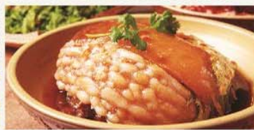
在勝興車站附近可吃到傳統客家美味。 Traditional Hakka cuisines near Sheng Hsing Station