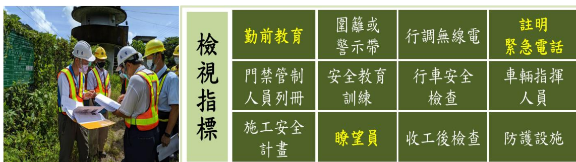
圖 1 臺鐵臨軌在建工程 12 項檢視項目

加強各工地安全管理，派專人保管工地大門鑰匙，管制人員進出，並於工地設置 CCTV 或電子圍籬，實施強化安全控管，如圖 1 所示。