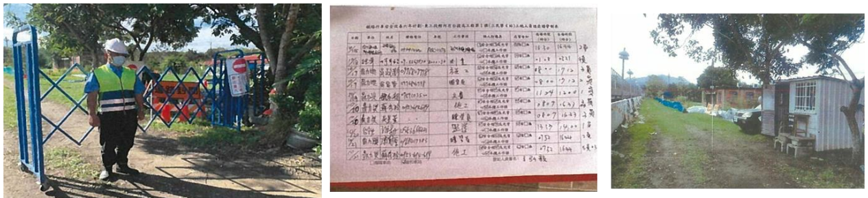
圖 3 臺鐵工地安全管理