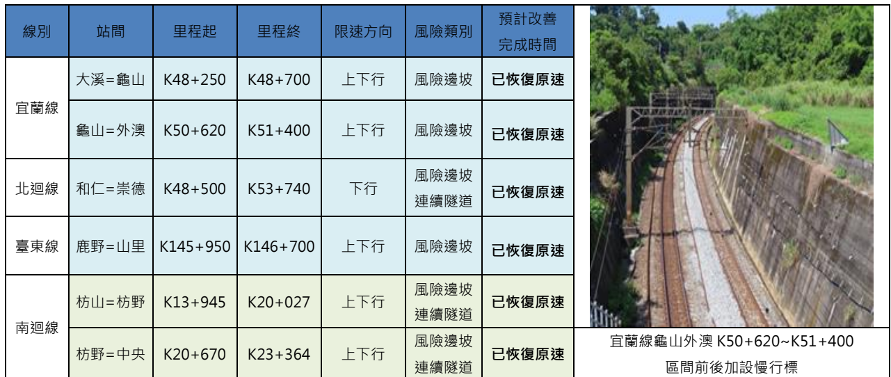
圖 7 東線列車降速運轉