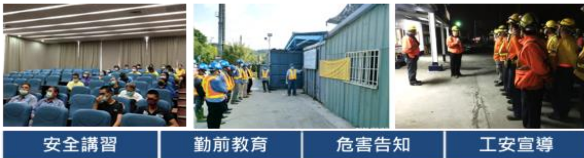
圖 4 臺鐵落實工地人員行車安全教育