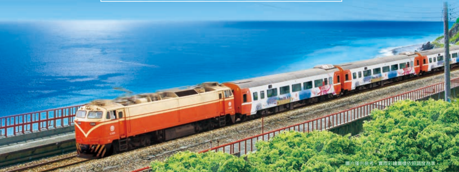
圖片僅供參考，實際彩繪圖樣依照調度為準。