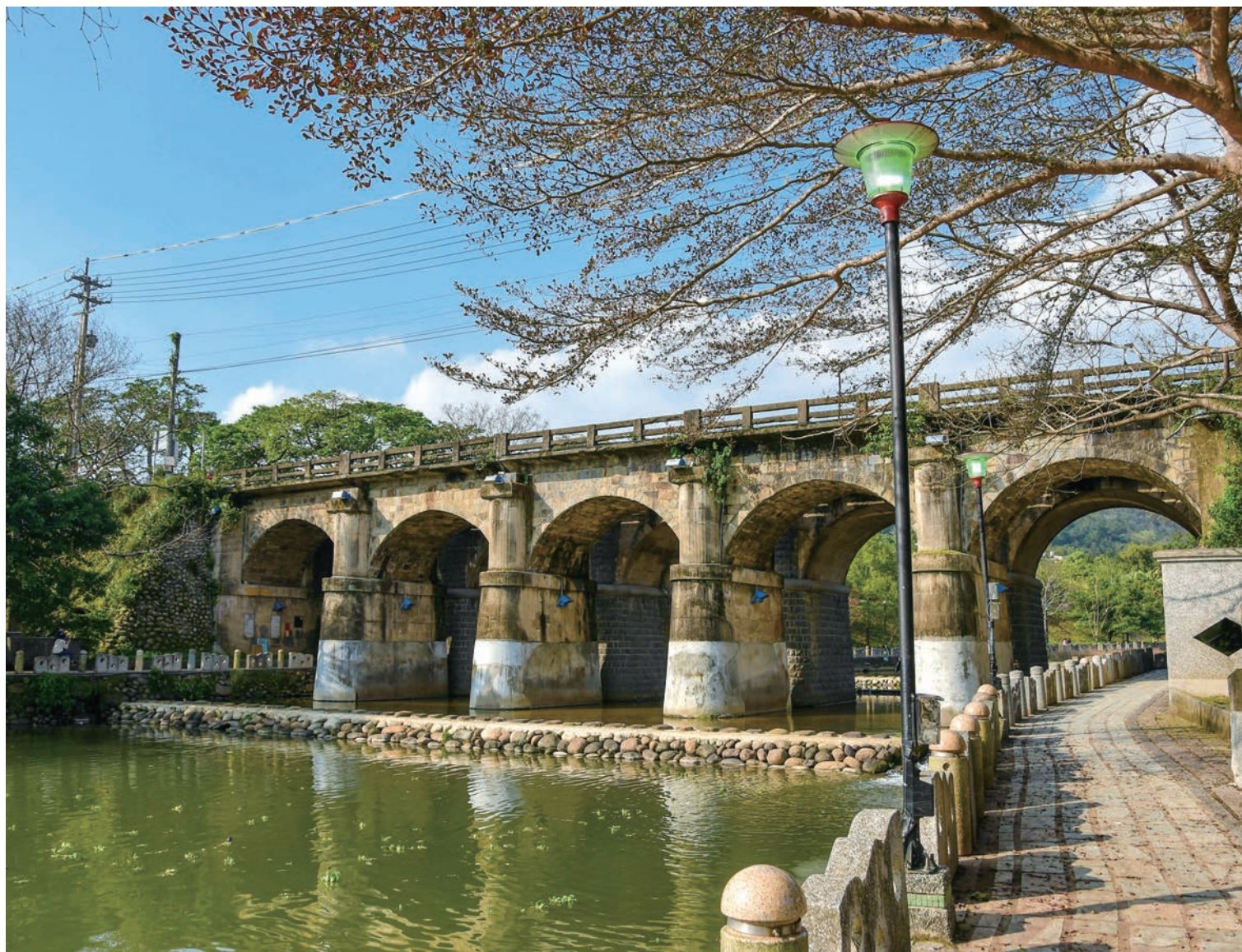
東安古橋又被稱為「彩鳳橋」，復古又典雅。