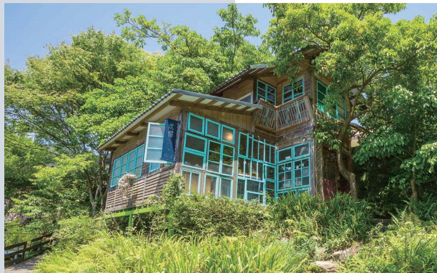
希望工場中的「虎帽金工」，外觀以古早時代的毛玻璃打造成山中小屋。