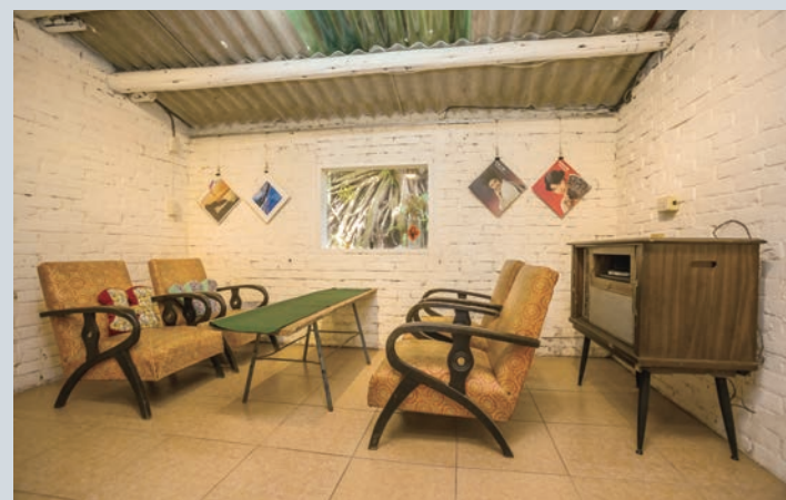
土旺書屋以古早時代的家俱擺設，打造出復古的閱讀展覽空間。

開放時間 | 週一至週五上午10:00-17:00，週末及假日上午10:00-17:30（週二公休） 備註：入園費可抵園區消費